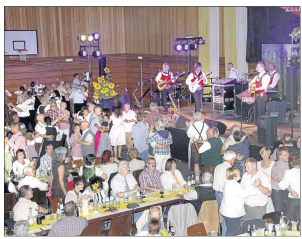
Zu einem „Tiroler Abend“ lud der Freundeskreis Liebfrauenheide Klein-Krotzenburg ein in die Kreuzburghalle und die Beteiligung der Bevölkerung war immense. Nach den „Original Hainburgern“ als Vorgänger präsentierten sich die „Original Zillertaler“ und viele Tanzbeine wurden geschwungen.

komplette Mittelschiff der St. Nikolaus-Kirche. Als der brennende Dachstuhl einstürzte, gingen damals alle Altäre, die Heiligenfiguren, die Kanzel und die barocke Orgel in Flammen auf. Das neue Dachgestühl zimmerte die Klein-Krotzenburger Firma Euler, deren Chef Frank den Teilnehmer am kommenden Sonntag führen wird.