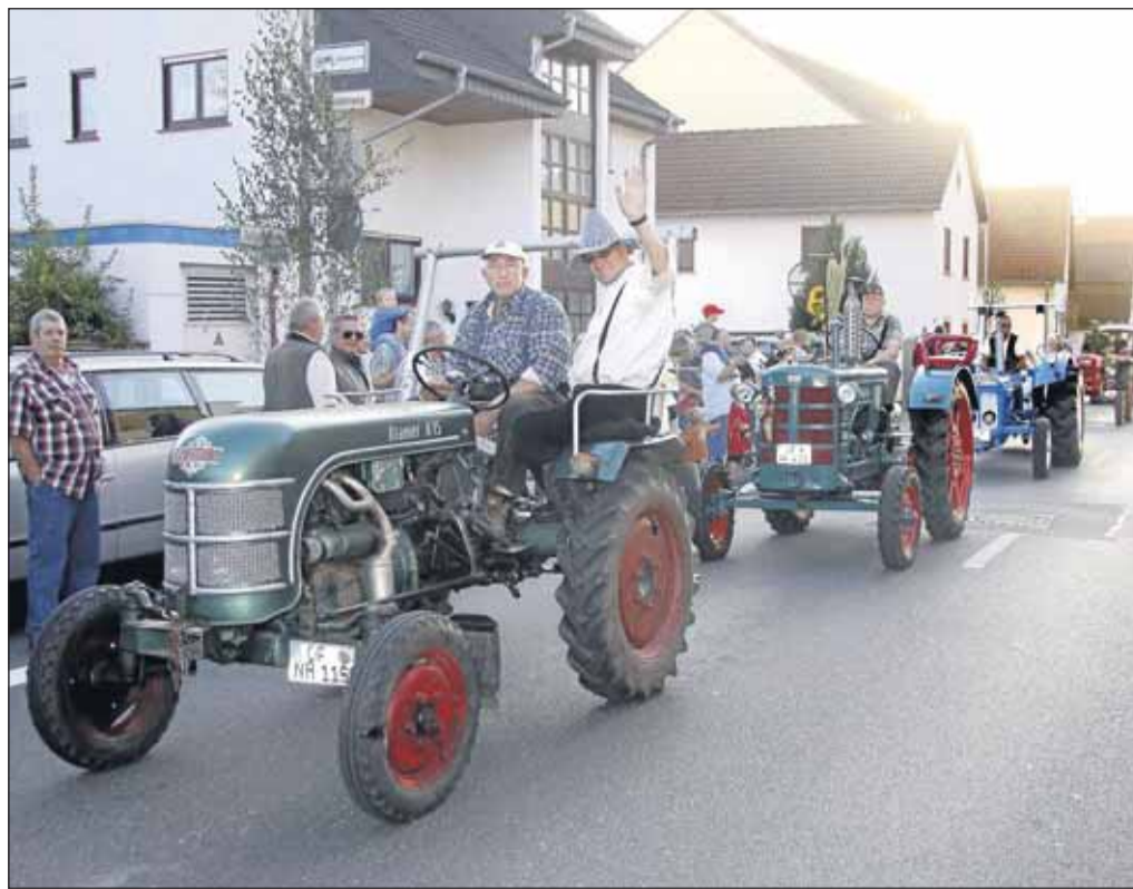
Auch beim Festzug durch Froschhausens Ortsstraßen hatten die Traktorenfreunde während des Geburtstags-Wochenendes viel Spaß.

DAMBRUCH ELEKTROINSTALLATIONEN ELEKTRO-GERÄTE-KUNDENDIENST Frankfurter Str. 11 63500 Seligenstadt Tel. 06182-3620 - Fax 1752