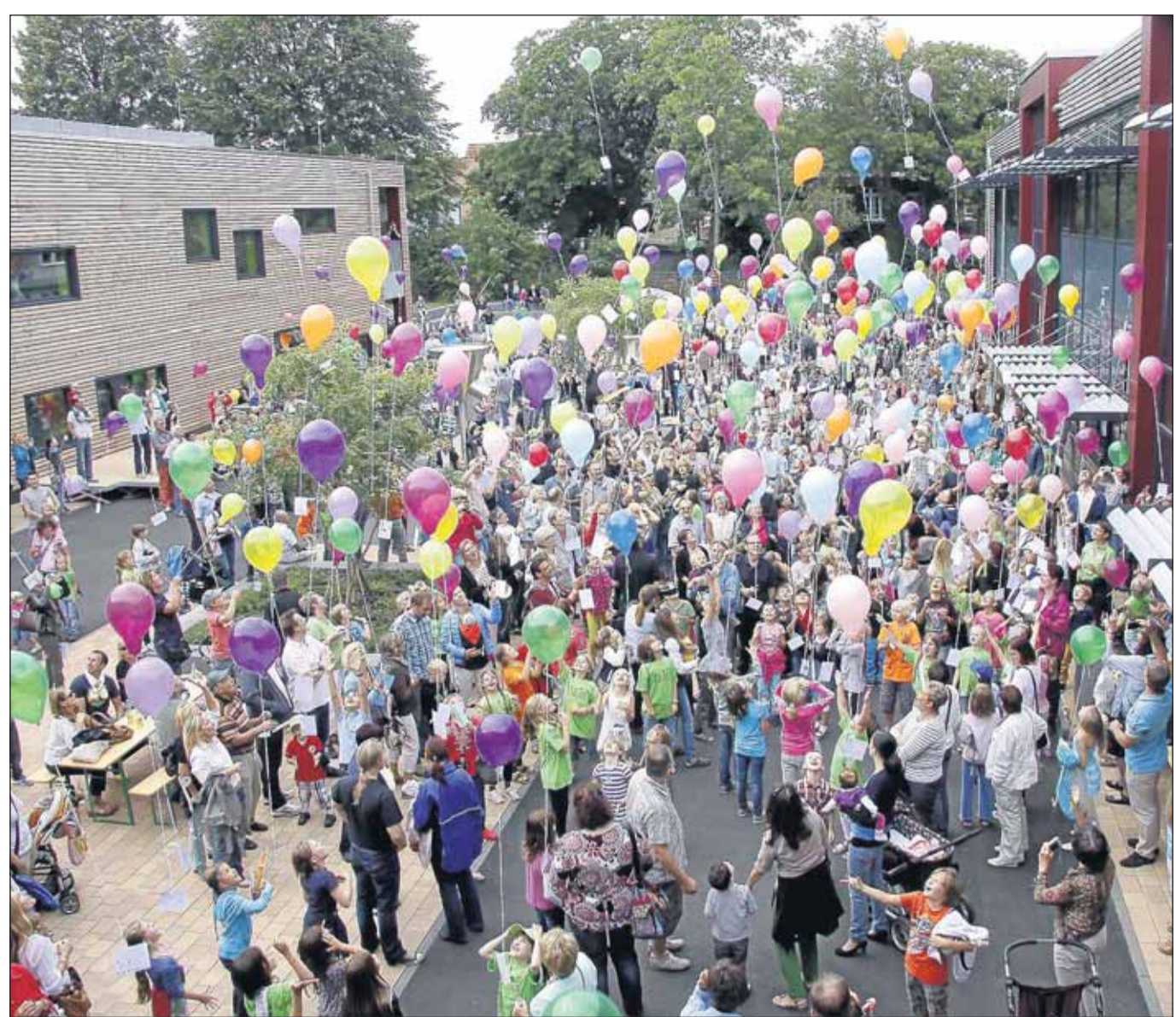
Die Einweihung des neuen Gebäudes der Seligenstädter Emma-Schule sowie das sich anschließende Schulfest standen im Blickpunkt am vergangenen Samstag in der Einhardstadt. Begeistert war der Nachwuchs natürlich auch von der Luftballonaktion, bei der sich die Besucher auf dem Innenhof versammelten. Das neue Gebäude stand dann im Blickpunkt von vielen Besichtigungen.

Seligenstadt (red) – Speziell für Menschen mit Bewegungseinschränkungen bietet die Namasté-Yogaschule Seligenstadt einen neuen Zehn-Wochen-Kurs an. Beginn von „Yoga mit dem Stuhl“ ist heute, 17 Uhr. Infos unter ☎ 0176 99630643.