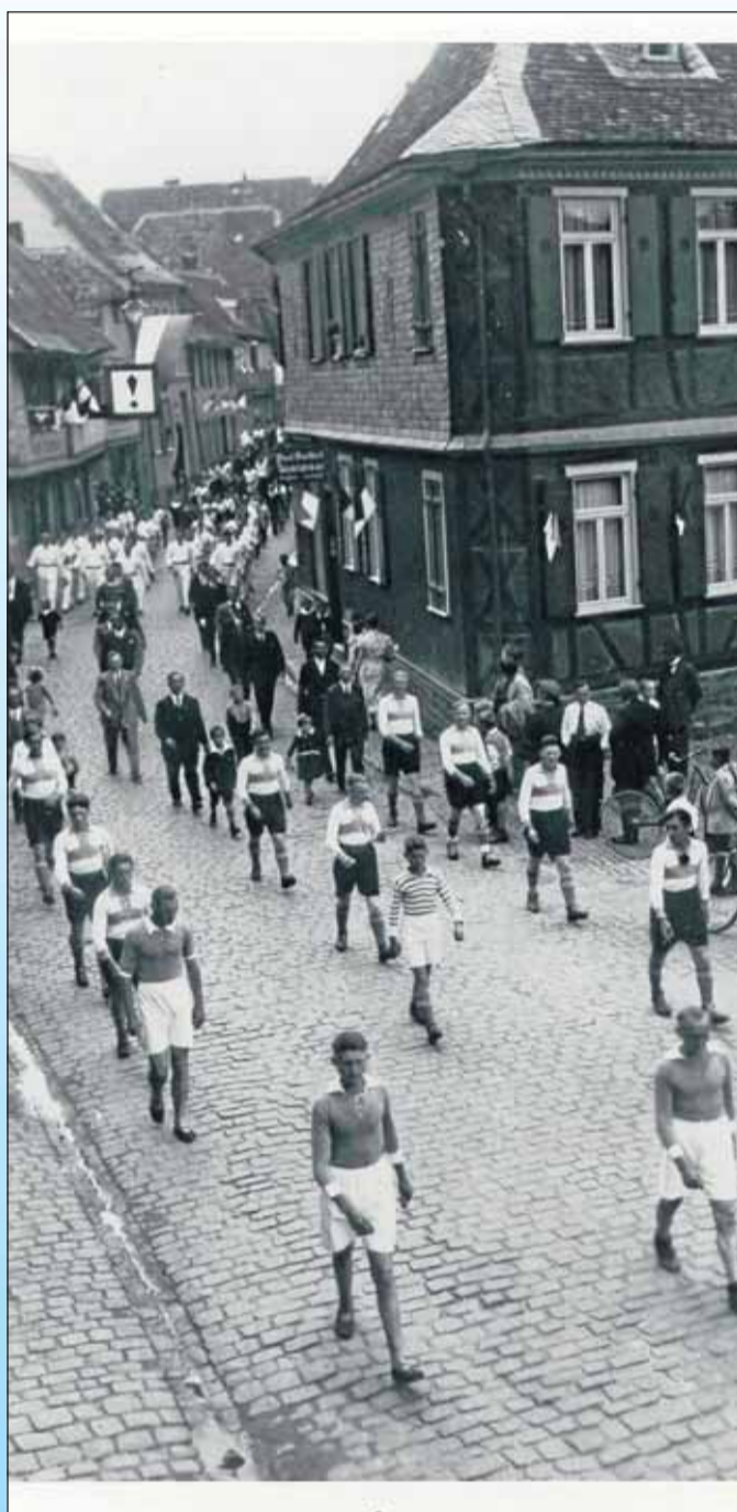
Ein Festzug anno 1931 bei der Spvgg. Seligenstadt.

In diesem Sinne wünsche ich uns allen eine schöne Jubiläumsfeier.