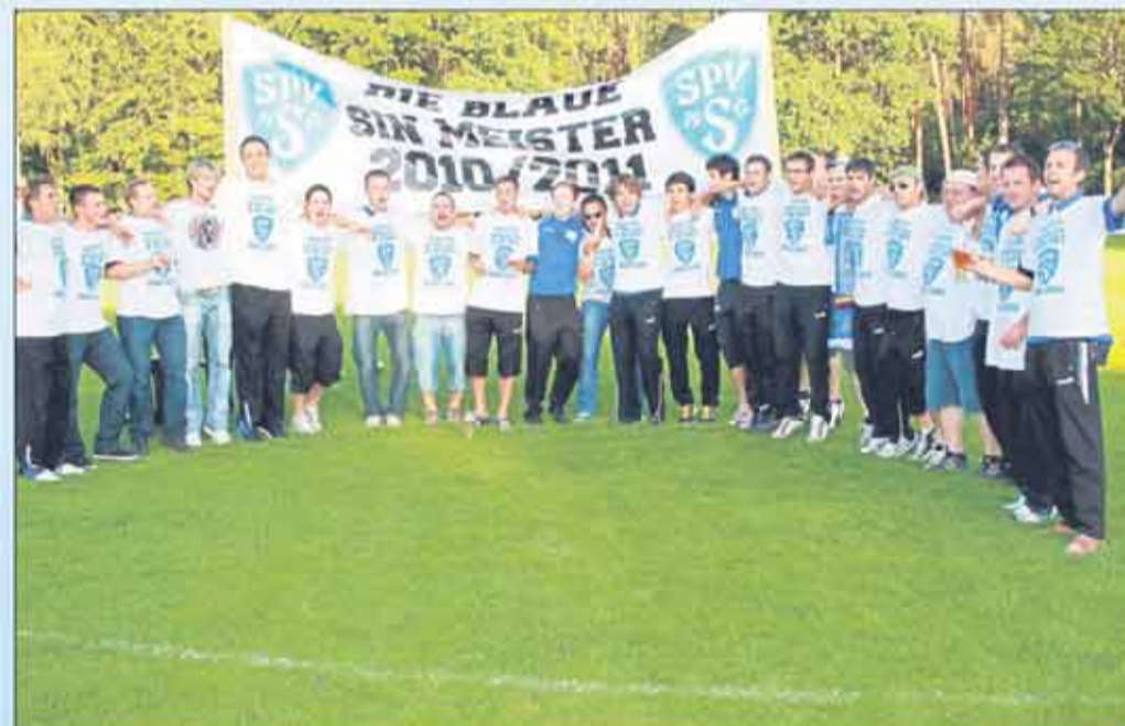
Die Spvgg.-Meisterteam beim jüngsten Aufstieg in die Kreisoberliga.

Vieles mehr lesen Interessierte auf der Homepage des Vereins unter www.spvgg-seligenstadt.de (beko-PR)