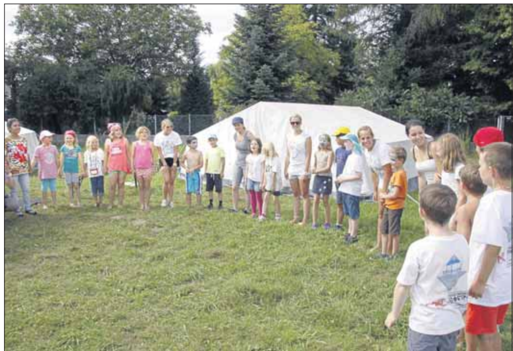
Bei den Seligenstädter Ferienspielen gab es drei „Dörfer“ und jede Gruppe gab bei der Abschlusfeier noch ein Lied zum Besten. Anschließend konnten sich die Eltern noch über die Ergebnisse der einzelnen Projekte, wie basteln, malen und bauen während der Ferienspiele, informieren und zeigen lassen. Kaffee und Kuchen versüßten den letzten der ereignisreichen Ferientage.