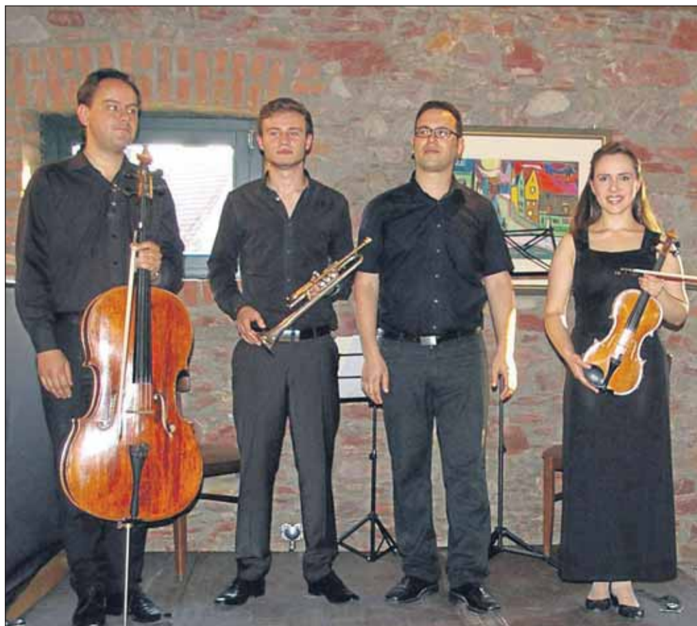
Der Ausnahmeharmonikist Roman Kuperschmidt war mit seinem Trio zu Gast bei den Klosterkonzerten im Hofgut Hörstein.

ke zusammengefasst, die derzeit bis zum 30. September 2012 im Klosterhof (Großplastiken) sowie in der Galerie Altes Haus in der Frankfurter Straße 13 in Seligenstadt (Kleinplastiken und Zeichnungen) ausgestellt und auch zum Kauf angeboten werden. Außer dem Katalog zur aktuellen Ausstellung finden interessierte Kunstfreunde in der Galerie eine große Zahl von Publikationen über die Arbeiten der sieben ausstellenden Künstlerinnen und Künstler. Die Freiluftausstellung im Klosterhof ist täglich von 8 bis 20 Uhr geöffnet, die Galerie freitags, samstags und sonntags sowie feiertags von 15 bis 18 Uhr.