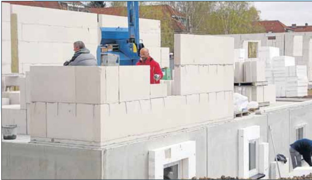
Ips/Cb. Vom Staat gefördert: Eigenheimbau

Der Vorteil liegt allerdings darin, Sonderzahlungen ohne die Berechnung von Vorfälligkeitsentschädigungen leisten zu können und außerdem die staatliche Wohnungsbauprämie zu erhalten, natürlich unter Beachtung bestimmter Einkommensgrenzen. Die Einzahlungsmöglichkeiten für die meist auf sieben Jahre angelegten Bausparverträge haben die Bausparkassen abgesenkt, um nicht zu hohe Zinsen für die Renditesparer ausreichen zu müssen, die nur sparen, aber nicht bauen wollen. Solche Zinsen schaden dem sogenannten Bauspar-