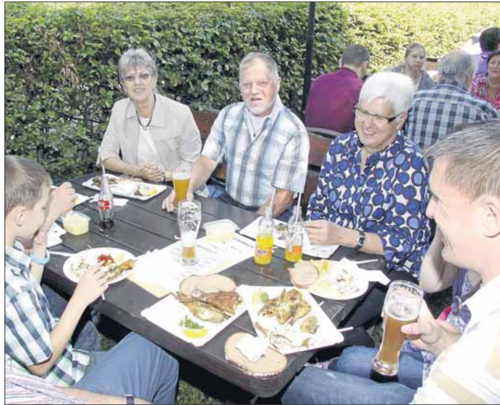
Gemütlich ging es beim traditionellen Sommerfest des ASV Mainfisch am Froschhausener Harressee zu. Sommerliche Temperaturen und leckere Spezialitäten aus der Vereinsküche luden zum Verweilen ein.

Sei herzlichst begrüßt Euer Turmmännche.