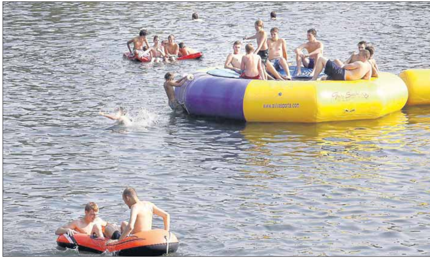
Endlich Badewetter! Obwohl kaum ein Parkplatz zu finden war, sah es am Mainflingener Badesee recht locker aus. Das kühle Nass ist an den Tagen um 30 Grad sehr begehrt.