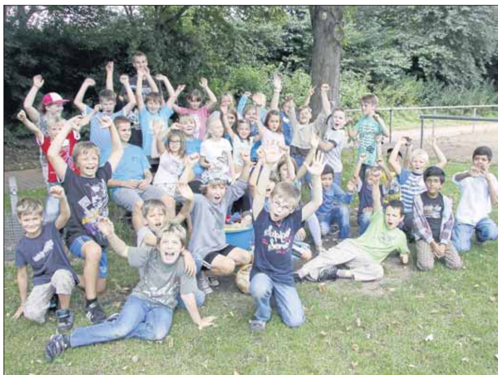
Ein gelungener Auftakt für die Ferienspiele in Klein-Krotzenburg fand unter dem Motto „Lasset die Spiele beginnen“ auf dem Gelände der SG Germania statt. Dort wird ein olympisches Programm absolviert. Die sportlichen Ferienspiele enden am 10. August um 10 Uhr mit einem ökumenischen Gottesdienst.

und der Frauenchor der Harmonie Hainstadt, die Gruppe Angelus Klein-Krotzenburg und Cross Voices vom Volkschor werden mit Liedern das Publikum erfreuen. Am Nachmittag stehen die Auftritte des Kinderchores unter der Leitung von Steffen Bodensohn und der Tanzgruppen Young Diamonds und Diamonds auf dem Programm. Für die Kinder ist ein großes Unterhaltungsprogramm mit tollen Aktionen zum Mitmachen geplant.