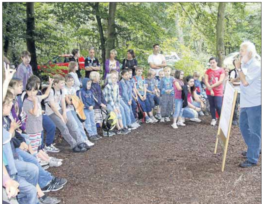
Die Hainstädter Sommerferienspiele gehen in diesen beiden letzten Ferienwochen am Hainstädter Waldrand auf dem Platz der „Freien Turner“ über die Bühne. Schulpflichtige Kinder sind zur Teilnahme eingeladen. Derzeit werden sie in Kleingruppen betreut. Entsprechend dem Ferienspielermotto bestimmen sie ihre Aktivitäten weitgehend selbst unter der Regie des Kinderhauses.