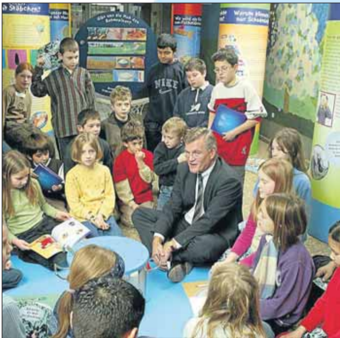
Ips/Cb. Lehrer können Kosten für Medien geltend machen.