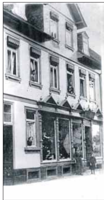
Alte Pracht: Das Haus Englmann in den 20er Jahren.

Engagement der Eigentümer, des Denkmalschutzes und des Architekten Bernhard Post.“ Das heute im Besitz der Famamilie Englmann befindliche Gebäude wurde in zeitgenössischem Stil um 1890 in Backsteinbauweise mit konstruktivem Weichholzfachwerk errichtet. Die Fassade war verputzt und mit Stuckelementen, als Gurte und Fenstereinfassungen versehen. Diesen bauzeitlichen Zustand zeigt auch beiliegende Fotografie aus den 20er Jahren des vorigen Jahrhunderts. (Foto 1) Augenfällig sind die kunstvollen kleingliedrigen Schaufenstereinfassungen und die Stuckelemente der Fassade.