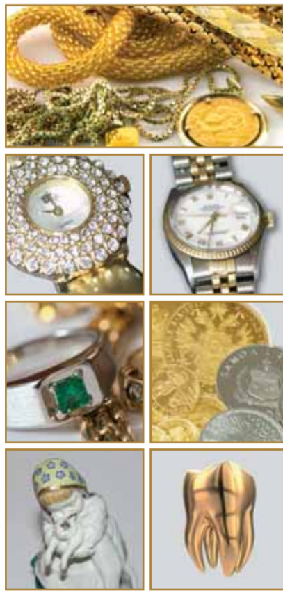
Meissen, Rosenthal, KPM usw.

Ab sofort auch Ankauf von Zinn und versilbertem Besteck!