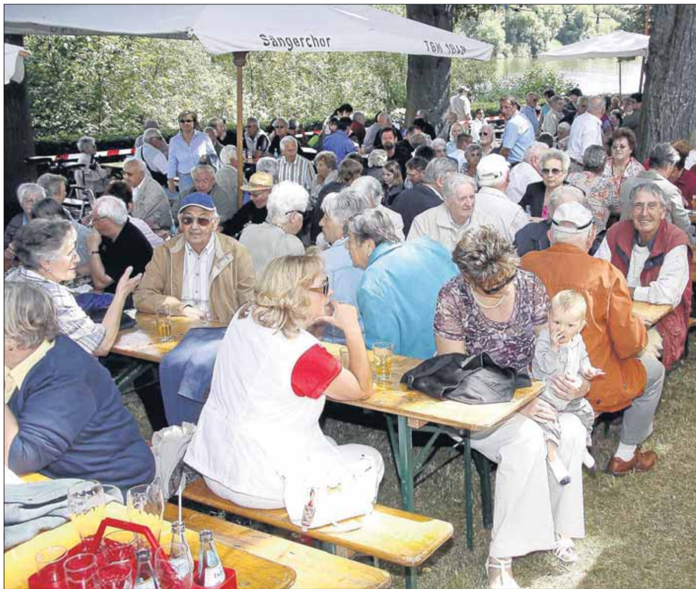
Endlich Sommer! Hunderte Gäste und die gastgebende Sängerkolonie freuten sich über das Kaiserwetter des vergangenen Wochenendes. Sie verbrachten gesellige Stunden in frohen Runden beim beliebten Maa-Allee-Fest des TGM-Sängerklosters.

malig schöne Klosteranlage, in der Obst, Gemüse und Kräuter angebaut werden. Im kürzlich erschienenen Kochbuch „Seligenstadt tischt auf“ werden die Köstlichkeiten unserer Region mit wunderschön ins Bild gesetzten Rezepten präsentiert. Dieses Buch war einer der Hauptgewinne bei dem auf der Messe veranstalteten Glücksspiel der Hessenagentur, bei dem ebenfalls eine Themenstadtführung verlost wurde. „Die Besucher werden unser schönes Seligenstadt nicht nur als geschichtsträchtige Stadt mit vielfältigem kulturellem Angebot, sondern auch als Ort des Genusses erleben“, ist sich Bürgermeisterin Dagmar B. Nonn-Adams sicher.