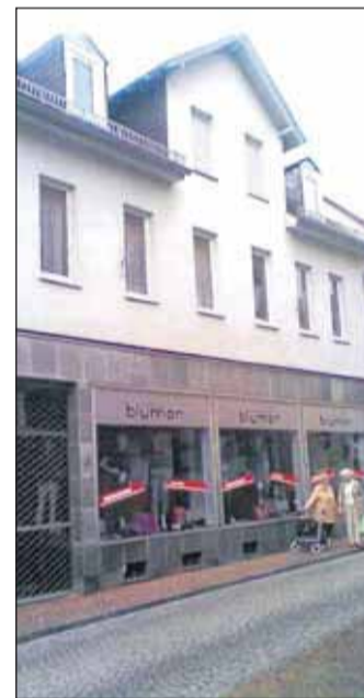
Stil der 70-iger: So sah das Haus vor der Sanierung aus.

Jahre wurden große Schaufenster und glatte Fensterflächen mit einer Sellenberger Muschelkalk Fassadenverkleidung im Erdgeschoss eingebaut. Eine dem Zeitgeist entsprechende Gestaltung (Foto 2). Nach Auszug des seitherigen Mieters Mitte des letzten Jahres fassten die Eigentümer die jetzt erfolgte grundlegende Sanierung, des in die Jahre gekommenen Hauses ins Auge. Gemäß Absprache mit der Unteren Denkmalschutzbehörde und dem Stadtplanungsamt sollte dem Gebäude seine ursprüngliche Gestaltung soweit wie möglich zurückzugeben werden.