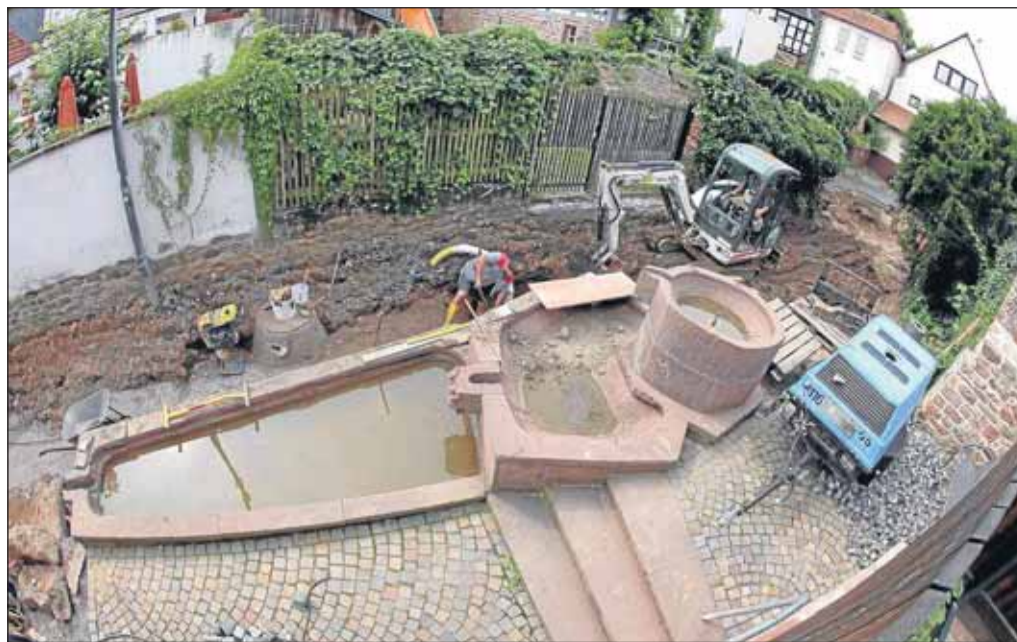
130 000 Euro lässt sich die Stadt Seligenstadt die Umgestaltung des Platzes am Roten Brunnen kosten. Der schmale Fußweg vom „Eis Kaiser“ zum Eiscafe „Main-tor“ erlaubt nur die Verwendung leichter Baumaschinen. Nach Abschluss der Kanalbauarbeiten werden die vorhandenen Waschbetonplatten durch Natursteinpflaster ersetzt. Eine Sandsteinrinne erinnert dann an den alten Bachlauf. Anfang September soll der beliebte Durchgang wieder freigegeben werden. In einem ersten Bauabschnitt wurde bereits im vergangenen Jahr der Stichweg zur Kleinen Maingasse saniert.

● Die Tennisabteilung der Sportfreunde Seligenstadt lädt zum Sommerfest mit Live-Musik am Samstag, 11. August, um 19.30 Uhr auf die Terrasse der Gaststätte „Kontrast“ ein. Reservierung wird erbeten bis zum 5. August bei Elke Nover, 0618223821 oder Andrea Böhm, 0618222427, E-Mail: enover@t-online.de oder boehm-seligenstadt@t-online.de .