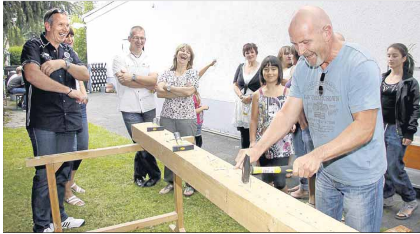
Ein abwechslungsreiches Sommerfest feierte die Radsportvereinigung Klein-Krotzenburg im idyllischen Biergarten an der Radsporthalle. Die Stimmungskapelle Blech & Co gestaltete den gut besuchten Frühschoppen, es folgten Vorführungen in den Sportarten Freestyle-Radfahren, Radball, Hip-Hop-Tanz und die asiatische Kampfsportart Aikido fand Bewunderer. Die Gaudiwettbewerbe fanden großen Zuspruch beim Büchsenwerfen und/oder beim Nageln. Die Showband Zweitakter“, sorgte am Abend für Musik und gute Unterhaltung.

Am Abend finden um 18 Uhr und 19 Uhr die Zumba-Kurse statt. Freitags startet um 15 Uhr das Klein-Kind-Turnen und um 16 Uhr das Eltern-Kind-Turnen in der Groß-Sporthalle, Königsberger Straße. Die Trainingszeiten der Tanzgruppen und weitere Infos auf der homepage. www.sportvereinigung-hainstadt.com .