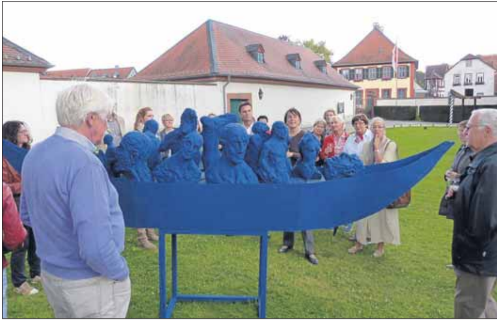
Auf großes Publikumsinteresse stoßen auch die Begleitveranstaltungen zur Ausstellung „Arche 2012“. Hier eine der Führungen zur Dämmerstunde mit Klosterschoppen.