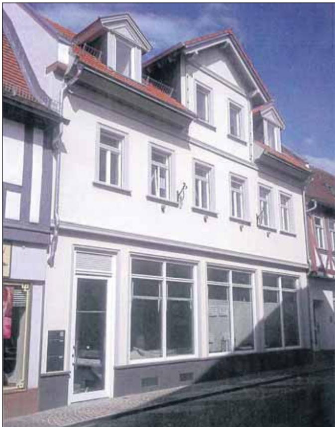
Zeittypische Fassade im historischem Altstadt-Ensemble - das Haus Englmann fügt sich mustergültig ein.

Fortsetzung von Seite 1: Vorzüglich wurden die Gäste auch wieder durch ein reichhaltiges Angebot an Speisen und vor allem durch die herrlichen selbstgebackenen Kuchen aus den TGM-Bäckereien. So konnte das Fest einmal wieder zu einer gelungenen Veranstaltung im Rahmen der vielen Feste in Seligenstadt werden. Wir freuen uns schon heute auf das nächste Maa-Allee-Fest, das ganz sicher im kommenden Jahr an gewohnter Stelle, dann am 20. und 21. Juli 2013, stattfinden wird. Wer noch mehr mit dem Sängerkorps der Turngemeinde feiern möchte, ist hiermit zur Kerb auf dem Vereinsplatz an der Zelhäuser Straße gegenüber den Sportplätzen am 26. August eingeladen.