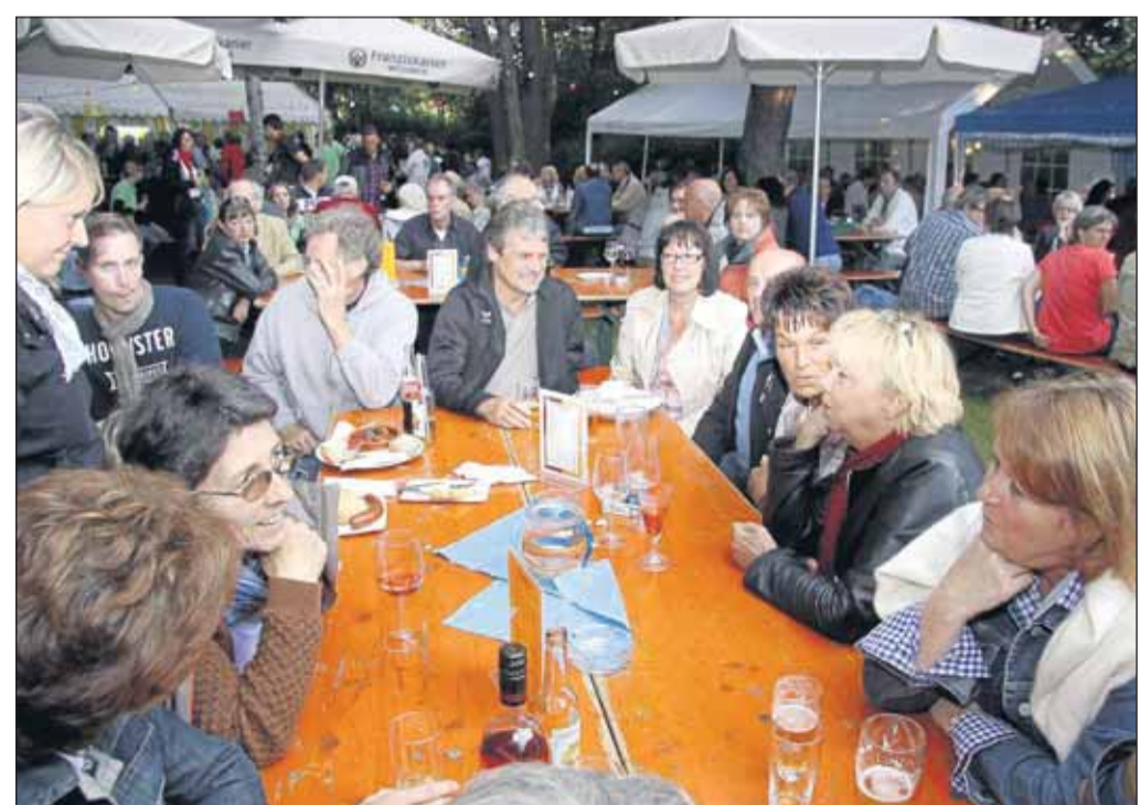
Riesenzuspruch hatte das Hüttenfest in Zellhausen. In gemütlicher Atmosphäre wurde Bier und Apfelwein vom Fass, Weine und Schmankerln des Küchenteams gereicht. Auch die Hütten-Bar hatte eine vielfältige Auswahl an leckeren Cocktails zu bieten. Nicht nur für den Gaumen wurde einiges geboten, auch akustisch. Am Freitagabend spielte die „Chicken-Jazzband“ und am Samstag lud „Ur-laubstreff“ zum Zuhören und Mitsingen ein. „Take 2 & Friends“ mit ihrem vielseitigen Repertoire bespielten unplugged das Hüttengelände.