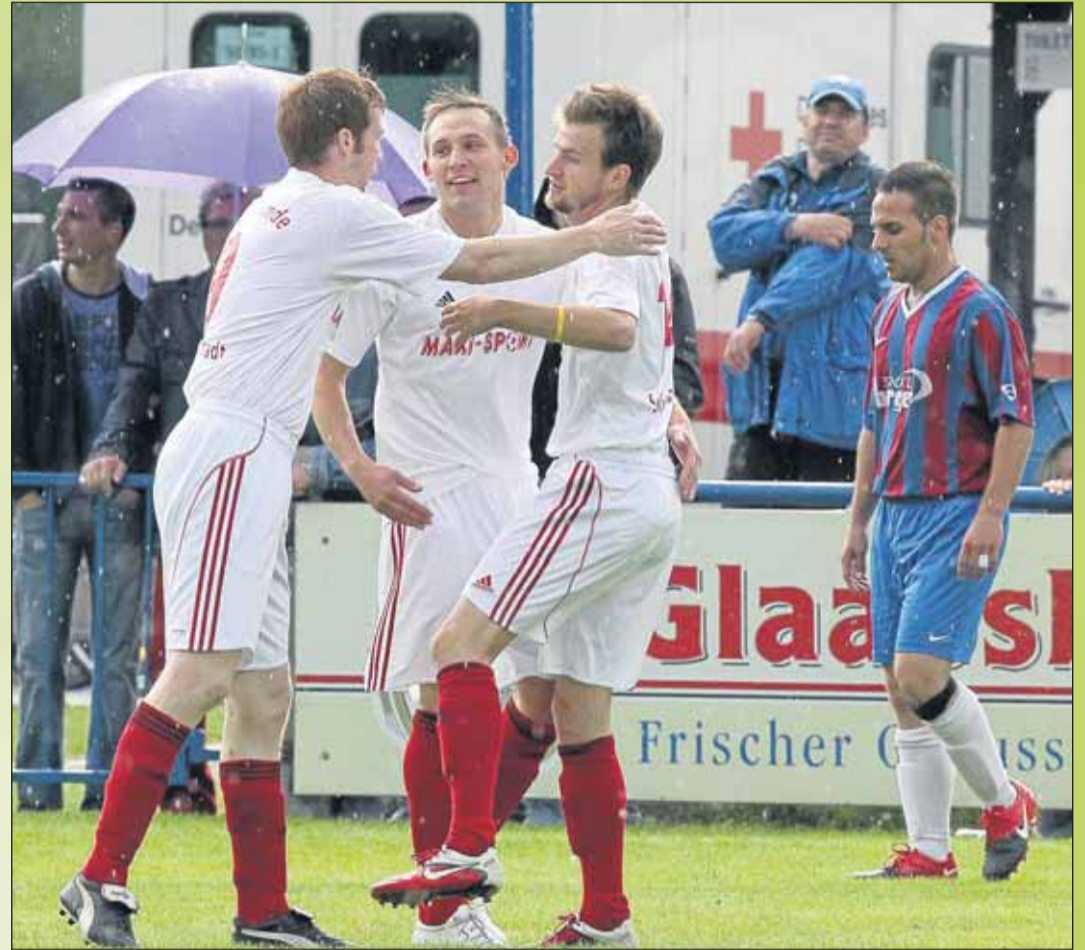
So war es im vergangenen Jahr im Finale: Die Sportfreunde Seligenstadt freuen sich, die Hainstädter sind enttäuscht. Der Verbandsligist gewann das Finale im Regen mit 3:1.

Der Spielplan, Freitag, 6. Juli: TuS Froschhausen - SV Zellhausen (18.15 Uhr), TuS Klein-Welzheim - Spvgg. Hainstadt (19.30 Uhr) - Samstag, 7. Juli: Sportfreunde Seligenstadt - Alemannia Klein-Auheim (17 Uhr), TSG Mainflingen - Spvgg. Seligenstadt (18.15 Uhr) - Montag, 9. Juli: Germania Klein-Krotzenburg - TuS Froschhausen (18.15 Uhr), Germania Großkrotzenburg - TuS Klein-Welzheim (19.30 Uhr) - Dienstag, 10. Juli: SV Zellhausen - Sportfreunde Seligenstadt (18.15 Uhr), Spvgg. Hainstadt - TSG Mainflingen (19.30 Uhr) - Mittwoch, 11. Juli: Alemannia Klein-Auheim - Germania Klein-Krotzenburg (18.15 Uhr), Spvgg. Seligenstadt - Germania Großkrotzenburg (19.30 Uhr) - Donnerstag, 12. Juli: TSG Mainflingen - TuS Klein-Welzheim (18.15 Uhr), Sportfreunde Seligenstadt - Alemannia Klein-Auheim (19.30 Uhr) - Freitag, 13. Juli: Spvgg. Seligenstadt - Spvgg. Hainstadt (18.15 Uhr), Alemannia Klein-Auheim - SV Zellhausen (19.30 Uhr) - Samstag, 14. Juli: Vorrunde Alte Herren (11.30 Uhr) - Montag, 16. Juli: Germania Großkrotzenburg - TSG Mainflingen (18.15 Uhr), Sportfreunde Seligenstadt - TuS Froschhausen (19.30 Uhr) - Dienstag, 17. Juli: Spvgg. Hainstadt - Germania Großkrotzenburg (18.15 Uhr), SV Zellhausen - Germania Klein-Krotzenburg (19.30 Uhr) - Mittwoch, 18. Juli: TuS Klein-Welzheim - Spvgg. Seligenstadt (18.15 Uhr), TuS Frosch-