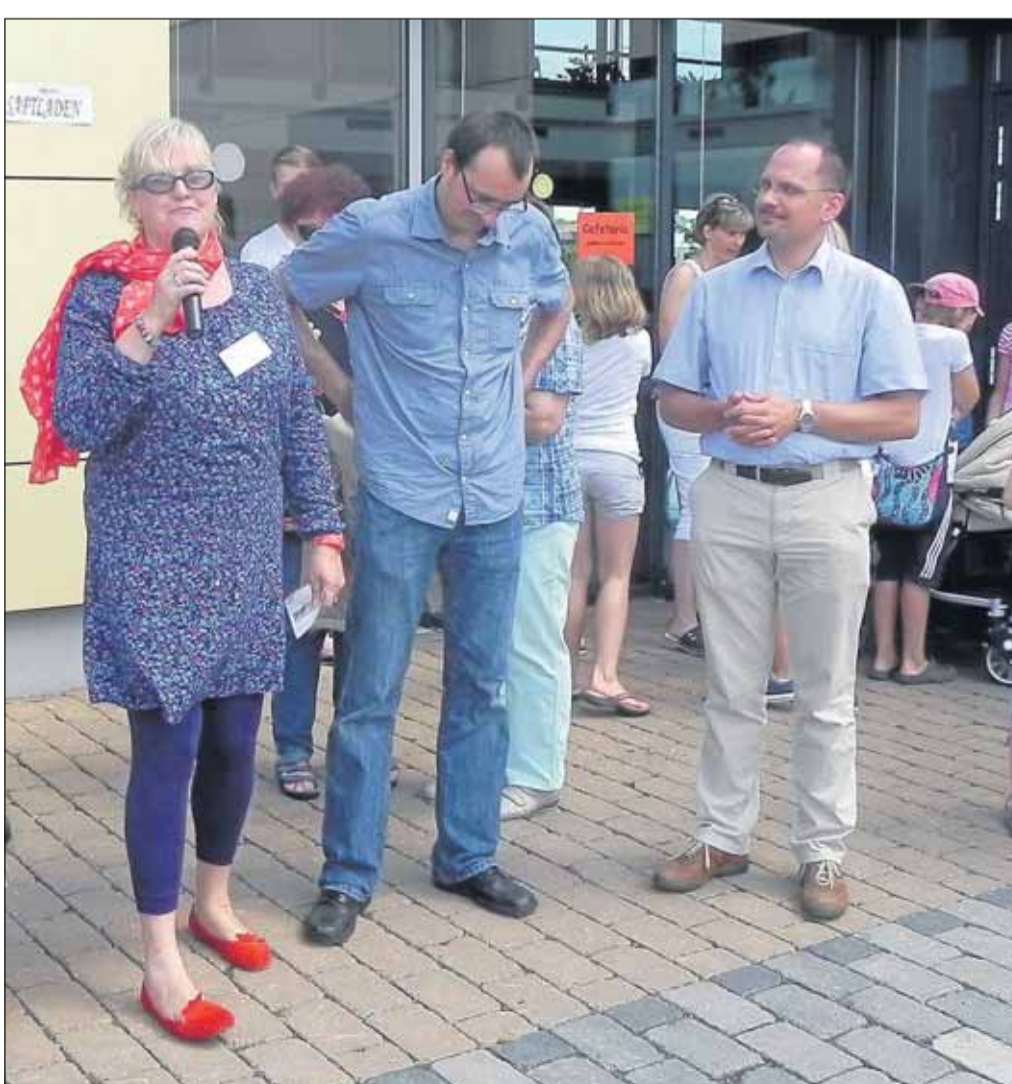
Große Freude an der Käthe-Paulus-Schule beim Verkünden des Ergebnisses: 60 Kinder liefen Runde um Runde, so dass durch Sponsoren stolze 3600 Euro zusammen kamen.

Landeskirche stellen die beiden evangelischen Kirchengemeinden Seligenstadt, Mainhausen und Hainburg das Singen und Musizieren in den Mittelpunkt der nächsten Gottesdienste. Pfarrerin Frauke Wagner predigt am Samstag, 7. Juli, um 9.15 Uhr in Hainstadt und um 10.30 Uhr in Klein-Krotzenburg über das berühmte Sommerlied von Paul Gerhardt „Geh aus mein Herz und suche Freud“. In Seligenstadt und Zellhausen feiern die Evangelischen am Samstag, 14. Juli, um 9.30 und 11 Uhr Singgottesdienste, in denen die Top Ten des Kirchengesangbuchs gesungen werden. Für diese Gottesdienste werden außerdem noch Wunschlieder entgegengenommen. Ansprechpartnerin ist Pfarrerin Leonie Krauß-Buck, 06182 21471. ● „Islam heute“ ist das Thema eines Filmabends, zu dem der ökumenische Gesprächskreis Mainhausen am Mittwoch, 8. August, um 19 Uhr, einlädt. Nachdem sich der ökumenische Gesprächskreis im Mai über das Verhältnis von Christentum und Islam ausgetauscht hat, wählt er diesmal den unterhaltsamen Ansatz eines Spielfilms über gläubige Muslime in der westlichen Welt. Im Anschluss an die Vorführung im evangelischen Gemeindehaus, Wiesenstraße 17 in Zellhausen besteht gegen 21 Uhr Gelegenheit zum Gespräch bei Wasser, Saft und Mainhäuser Kirchwein. Interessierte sind herzlich willkommen.