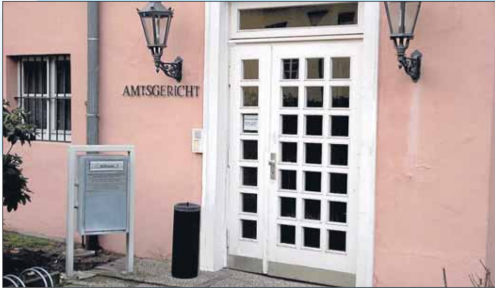
Erste Instanz Amtsgericht.

Berufung heißt das Rechtsmittel gegen Urteile erstinstanzlicher Gerichte. Ihre Voraussetzungen ergeben sich aus den jeweiligen Verfahrensordnungen der ordentlichen und der besonderen Gerichtsbarkeit. Die Revision eines Gerichtsurteils bietet nach der ersten bzw. zweiten Instanz die Möglichkeit, in einer weiteren Fallprüfung die Rechtssache noch einmal neu zu verhandeln und zu entscheiden. Zuständig für Revisionsverfahren sind in der Regel die obersten Bundesgerichte. In den meisten Strafsachen sind jedoch die Oberlandesgerichte (in Berlin Kammergericht) zuständig. Gegen im ersten Rechtszug erlassene Urteile kann Revision eingelegt und damit die Berufungsinstanz übergangen werden, wenn der Gegner einwilligt und das Revisionsgericht diese Sprungrevision zugelassen hat. Der notwendige Antrag auf Zulassung der Revision, der die Rechtskraft des