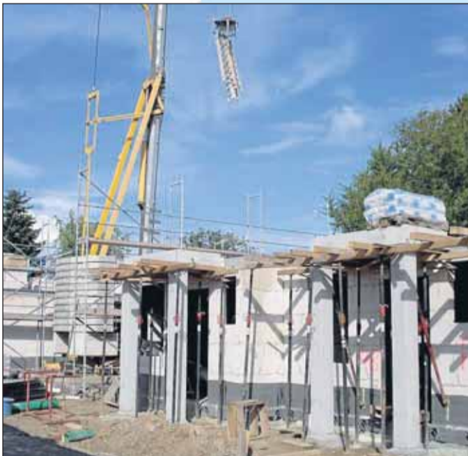
Die Beurkundung eines Immobilienerwerbs ist ein Fall für den Notar.

Die Notarkammern empfehlen eine strengere Befolgung von Richtlinien-Empfehlungen, wenn es um die Beurkundung von Verträgen geht, die in Angebot und Annahme aufgetrennt wurden. Solche Beurkundungen sind besonders in die Kritik geraten, seit sich immer mehr Erwerber von Wohnungseigentum über sogenannte Schrott-Immobilien beklagen. Beurkundende Notare wurden in diesem Zusammenhang als „Mitternachtsnotare“ kritisiert. Hintergrund ist der Vertrieb von überbewerteten Wohnungen und Häusern als „Steuersparmodelle“.