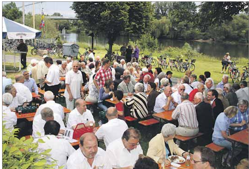
Mit einem Sängerfrühstücken in romantischer Umgebung unterhalb der Mainflinger Kilianus-Kirche startete das prächtige Pfingstfest des Sängerbundes. Der Klein-Welzheimer Liederkrans, der Frauenchor der Sängervereinigung Mainflingen und die Harmonie Zellhausen, sowie der Kinderchor vom Sängerbund traten auf. Sehr beliebt war wieder die Spielecke für Kinder.

Seligenstadt/Zellhausen - Am 7. Juni wird der Luftsportverein seine Tore für jedermann öffnen. Interessierte haben am Open Airport die Möglichkeit, sich über die Ausbildung zum Segelflugzeug- und Luftsportgeräteführer zu informieren. Die Mitglieder des Vereins stehen Interessierten mit Rat und Tat zur Verfügung. Natürlich können auch Rundflüge in den vereinseigenen Segel- und Motorflugzeugen unternommen werden. Wie jedes Jahr, wird es auch Vorführungen der Aschaffener Gleitschirmflieger geben. Für das leibliche Wohl wird ebenfalls bestens gesorgt sein.