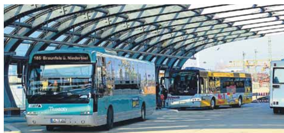
Die gewölbte Glas-Stahl-Konstruktion des neuen Busbahnhofs in Wetzlar ist ein echter Hingucker.

Bahn und dem neuen eTicket RheinMain, aber auch jede Menge Spiel, Spaß und Freizeittipps erwarten Sie am RMV-Stand auf der Landesausstellung in Halle 2, Stand-Nr. 228. Fahrplanauskünfte und weitere Informationen gibt's auch am RMV-Infobus in Wetzlar vor dem Bahnhof und in der RMV-Mobilitätszentrale am Karl-Kellner-Ring in Wetzlar.