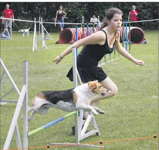
Der Hundesportverein Mainflingen zeigte am Pfingstweekende eine bemerkenswerte Ausstellung „Belgische Schäferhunde“ und veranstaltete ein spannendes Agilityturnier auf dem Vereinsgelände am Mainweg. Am kommenden Wochenende findet die Landesmeisterschaft Obedience, jeweils ab Uhr statt.