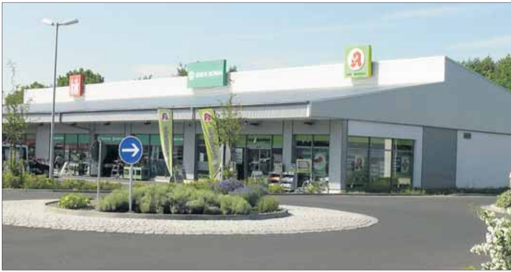
Gut beraten und preisbewusst einkaufen - das ist die easyApotheke in Hainburg.

Hainburg – Das Erfolgsrezept gegen teure Arzneimittel feiert in Hainburg Geburtstag. Vor zwei Jahren eröffnete die easyApotheke Hainburg und hat mit ihrem einmaligen Konzept schon viele Kunden überzeugt.