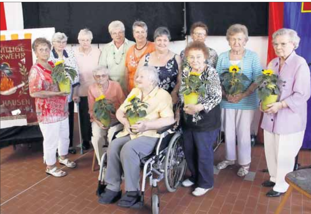
Der Tag der offenen Tür bei der Freiwilligen Feuerwehr Zellhausen lockte am vergangenen Wochenende bei herrlichem Sonnenscheinwetter zahlreiche Besucher an. Gewürdigt wurde der Frauentreff (Bild), welcher sich vor 50 Jahren gründete und auch heute noch Bestand hat. Auch einige Gründerinnen der Gruppe konnten begrüßt werden.