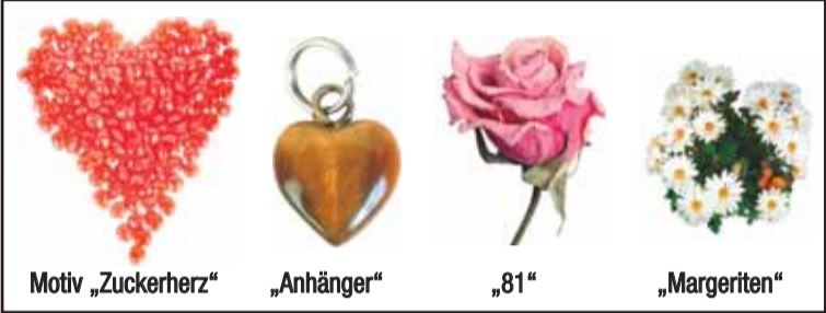
Mehr Motive auf www.op-online.de/marktplatz

Bei Anzeigenaufgabe über das Internet unter www.op-online.de/Marktplatz können selbstgezeichnete Kinderbilder in der Anzeige hochgeladen werden. Sonderpreis 10,- €