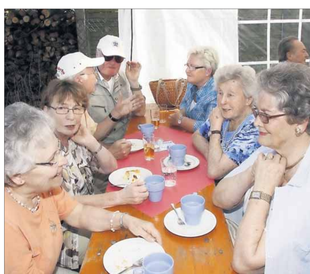
Ein gelungenes Maifest im Sonnenschein feierte der Gesangverein Liederkrantz 1903 Zellhausen am vergangenen Dienstag auf dem beschaulichen Gartengelände des Vereinslokals „Zum Schwanen“ an der Obergärtenstraße. Bei herrlichem Ausflugslokal standen neben Speisen und Getränken auch ein reichhaltiges Kuchenbuffet und Kaffee bereit. Das Festgelände an der Zellhausener Obergärtenstraße war bis in die Abendstunden sehr gut besucht.