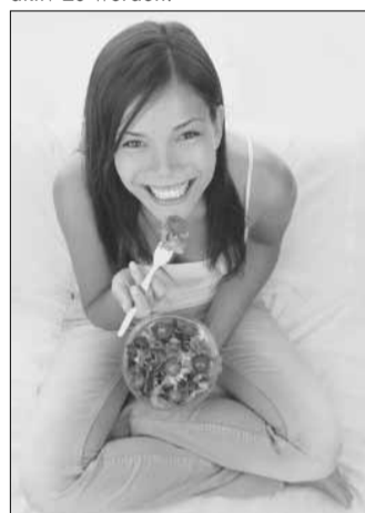
Durch eine ausgewogene Ernährung können wir unser Immunsystem unterstützen.

24 Stunden am Tag, 7 Tage in der Woche ist das Immunsystem für uns aktiv - ein Leben lang. Wie ein unsichtbarer Freund passt es auf uns auf und schützt uns vor Angriffen durch Viren, Bakterien, Parasiten und Pilze. Dringen Erreger in den menschlichen Körper ein, werden Immunzellen aktiviert, die den Angreifer erkennen und passende Antikörper produzieren. Doch unser Immunsystem kann noch mehr: Es verfügt über ein eigenes „Immungedächtnis“, in dem die Abwehrstrategien für bestimmte Angreifer gespeichert und bei Bedarf abgerufen und wieder eingesetzt werden. Eines der wichtigsten Immunzentren ist der Darm. Hier sitzen über 70 % der Immunzellen. Durch eine ausgewogene Ernährung können wir unser Immunsystem unterstützen: Neben der ausreichenden Zufuhr von Vitaminen und Mineralstoffen ist die Bedeutung von probiotischen Bakterien in zahlreichen Studien herausgestellt worden. Am 29. April 2012 findet der weltweite Tag der Immunologie statt, der auf die Bedeutung der immunologischen Forschung für die Gesundheit aufmerksam machen will. Ein Anlass für jeden, über die Unterstützung für sein Immunsystem nachzudenken und aktiv zu werden.