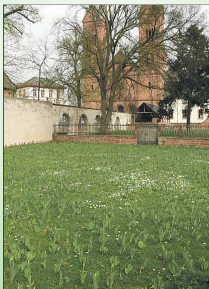
Der Frühling hat Einzug gehalten und das Städtchen erblüht, wie hier im Klostergarten nahe der Basilika.