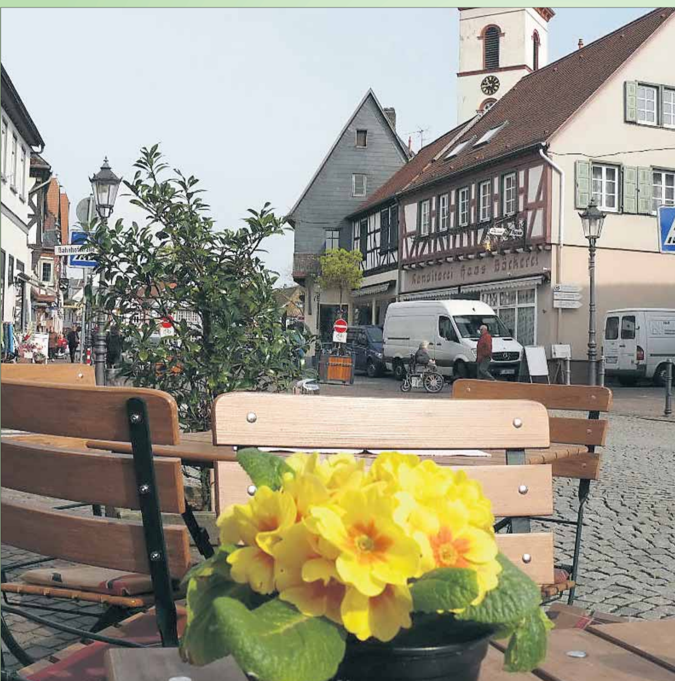
Fein herausgeputzt empfängt die Einkaufsstadt Seligenstadt ihre Gäste. Der Frühlingmarkt am kommenden Wochenende bietet reichlich Gelegenheit, Seligenstadt und seine Fachgeschäfte und Dienstleister einmal näher zu betrachten - es lohnt!

INNENSTADT: Metzger>METZGEREI FECHER | Geschenkartikel> W.W.WUNDERLAND | Parfümerie & Kosmetik>PHILIPPI | Mode>KAUFHAUS MITTL | Schuhe> SCHUHHAUS FRANZ Mode>STILECHT MODE & ACCESSOIRES | Mode> MODE FÜR SIE | Bücher> BÜCHERWURM | Telekommunikation> E-PLUS | Schuhe> STILECHT SCHUHE & TASCHEN Kaffee-Tee-Schokolade> GRUBER | Wohnaccessoires> ROSIGE ZEITEN | Uhren & Schmuck> CRAZY TIME | Kinderbekleidung> LILIPUT | Schmuck> SCHMUCKSTÜCK Blumen> BLUMENWERKSTATT Mode> JOSIE'S FASHION | Hörgeräte> BÖNSEL | Gaststätte> ZUM NEUEN SCHWAN | Sportartikel> INTERSPORT BEIKE Gaststätte> PIZZERIA DA CARLO Mode> ERNSTING'S FAMILY | Foto> FOTO EHRMANN | Gaststätte> KLEIN'S BRAUHAUS | Schmuck> SCHMUCK STEIN | Schmuck & Meer> STRANDGUT | Haushaltswaren & Deko> WILHELM LINK Spirituosen> DIE VITRINE | Bilder/Plakate/Galerie> PLAKAT AM MARKT | Schuhhaus> QUICK-SCHUH | Eiscafe> EIS-CAFÉ FELTRIN | Mode> NKD | Mode> MODEHAUS BLUMÖR | Gaststätte/Hotel> ZUM RIESEN Feinkost & Vinothek> BARLETTA | Wohn- und Modeaccessoires> DEKO-ARTS | Lederwaren & Accessoires> BAYER LEDERSTUDIO | Pelztextilien> PELZ SCHENKEL DESIGN | Berufsbekleidung> WALTER HOLZGREVE Schmuck> SCHMUCK-IT | Bäckerei> BÄCKEREI HAAS | Metzger> METZGEREI BECKER | Mode> STADDSON'S | AM STEINHEIMER TURM: Optik> OPTIK KLOSE | Schuhe> SCHUHHAUS RÖTTINGER