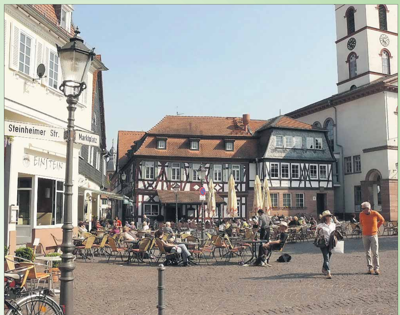
Gut gerüstet für die Freiluftsaison sind die Cafés und Restaurants, wie hier auf dem Marktplatz. Am kommenden Wochenende werden sich hier zahlreiche Aussteller hinzu gesellen und zeigen, was sie können. Text / Fotos: Rudi Rack-PR

Verlegung des Wochenmarktes auf den Freihofplatz: