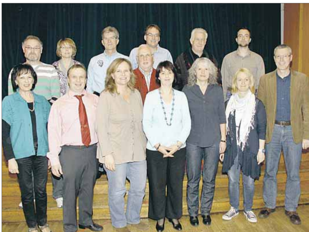
Mit diesem bewährten Vorstandsteam blickt die Mainflinger Sängervereinigung optimistisch in die Zukunft.