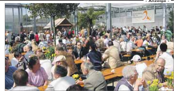
Wie in den vergangenen Jahren dürfte der Biergarten im Gewächshaus auch in diesem Jahr gut gefüllt sein.

Der Umgang mit Blumen, Pflanzen und der Natur hat in der Familie Fischer seit Generationen Tradition. Kein Wunder also, dass sich die Gärtnerei in den vergangenen Jahrzehnten zu einem Mekka für Hobbygärtner und Pflanzenliebhaber und einer der größten Gärtnereien in der Region entwickelt hat. Gartenfreunde und Pflanzenliebhaber können dort aus dem Vollen schöpfen. Von südländischen Kübelpflanzen und Palmen über Beet- und Balkonblumen bis hin zu Formschnittgehölzen und Kame-