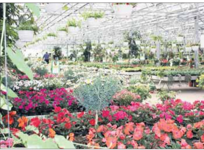
Die Gärtnerei Fischer bietet auf mehreren tausend Quadratmetern eines der vielfältigsten Pflanzenangebote der Region.

Abwechslungsreiches Programm in der Gärtnerei Fischer