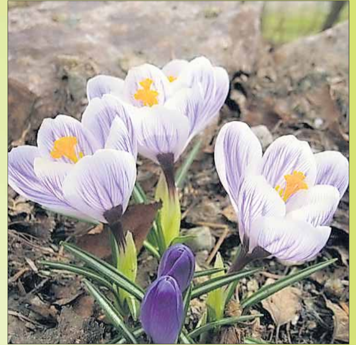
Der Frühling ist nicht mehr aufzuhalten und die Hainburger Fachgeschäfte sind bestens darauf eingestellt, Kunden und Gäste zum Frühlingsauftritt zu begrüßen. Texte / Foto: Rudi Rack-PR

ze Familie ist dort zum Shoppen und Bummeln eingeladen. Kinder sind zur lustigen Ostereiersuche herzlich willkommen. Ein Sonntagnachmittag der es in Hainburg ermöglicht, in aller Ruhe zu bummeln, Genießen und viel Neues wie Osterdekoration, Schuhe, Taschen, Bekleidung oder Uhren und Schmuck dabei zu entdecken. Weitere Infos unter: www.gv-hainburg.de