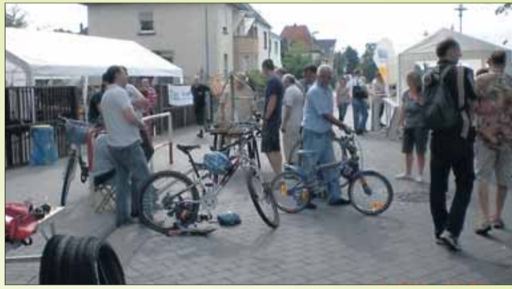
Erlebnissontag beim RFC Mövia - Radlerherz, was willst Du mehr?

Wald- und Wirtschaftswegen. Die Geschwindigkeit wird flott sein, aber garantiert nicht Radrennverdächtig. Mountainbike oder Trekkingrad und möglichst auch ein Sturzhelm