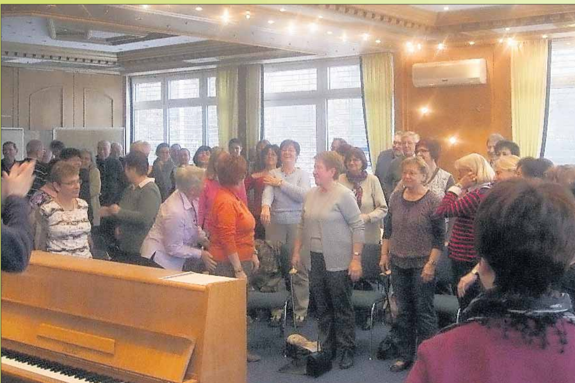
Mit mehr als 70 Sängerinnen und Sängern startete der Projektchor „Oper & Musical“ vom Gesangverein Harmonie ins erste Chorwochenende.

he „Geschichte und Geschichten aus Hainburg“ zum Preis von 3,00 Euro erworben werden. Es ist auch ein Gesamtinhaltsverzeichnis aller bisher erschienenen Hefte beigelegt.