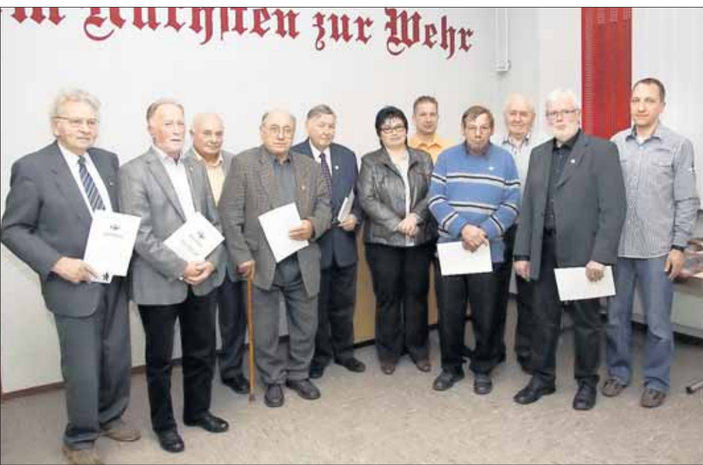
Urkunden wurden diesen verdienten Mitgliedern der Feuerwehr überreicht.