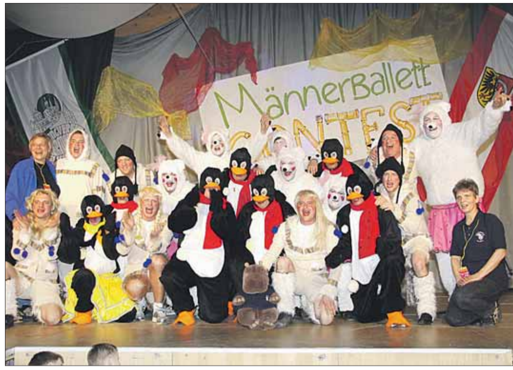
Großer Jubel für die siegreichen Bayern: Die Miltenberger „Dabbefänger“ feierten!