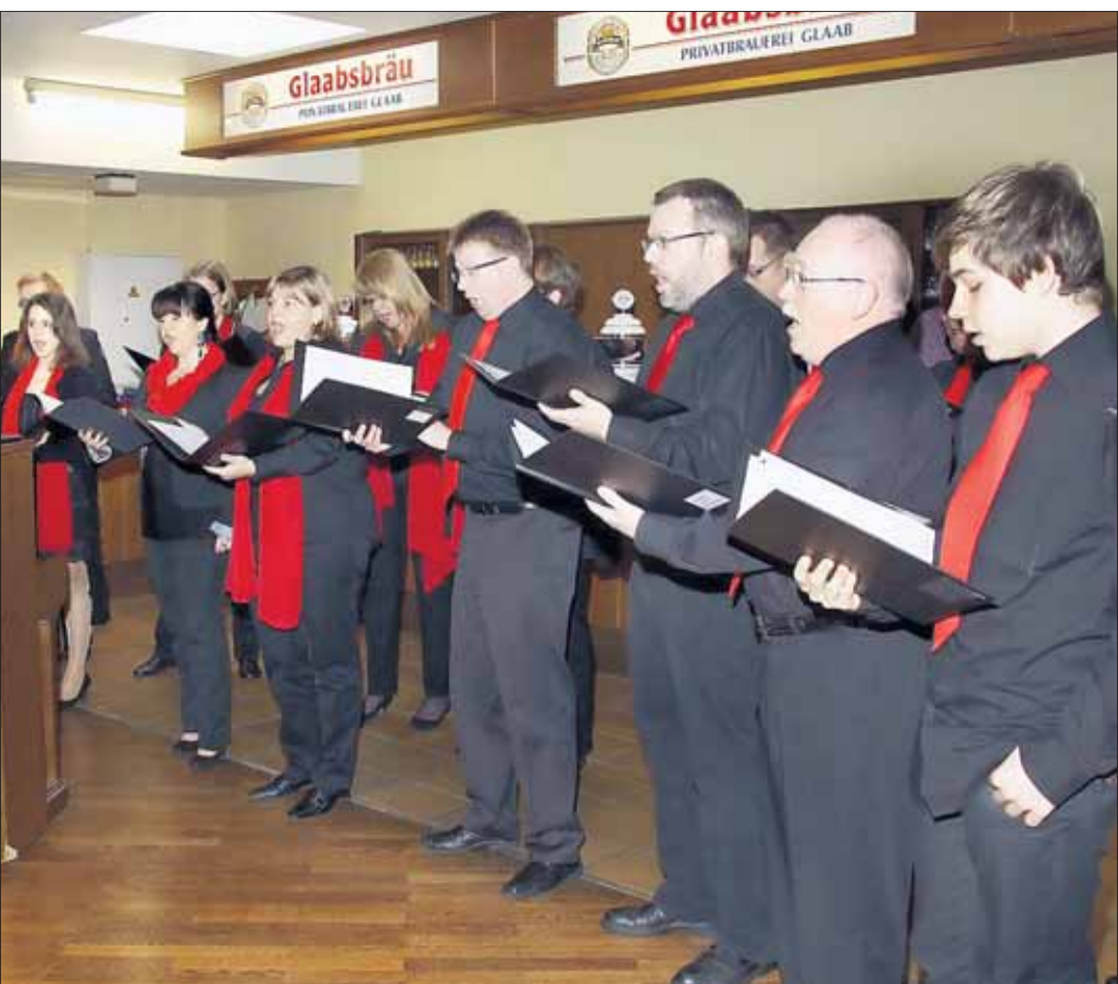
Den Auftakt zu den Feierlichkeiten des 725-jährigen Bestehens von Froschhausen bildete eine Akademische Feier am vergangenen Sonntag im Bürgerhaus. Zum Programm trugen der Musikverein Weiskirchen sowie die beiden Froschhausener Gesangvereine Liederfreund (Bild) und Harmonie bei.