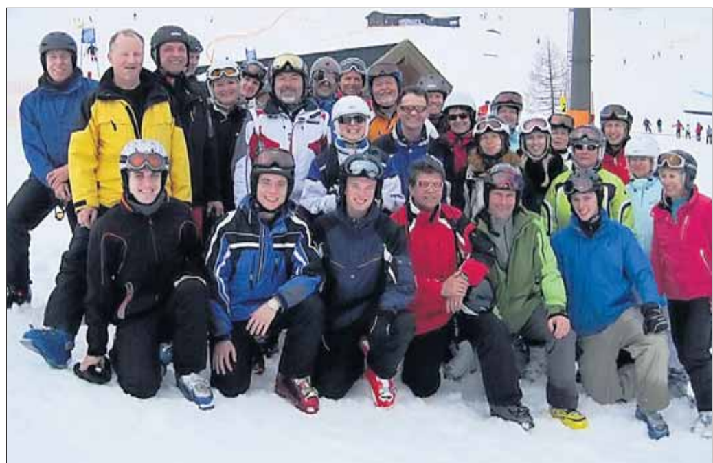
Spannende und freudige Tage im hohen Schnee erlebten diese Mitglieder des Seligenstädter Skiclubs während ihrer Clubmeisterschaften.

E-Mail: rudi.rack@stadtpost.de Fax: 0 61 82 / 92 98 39