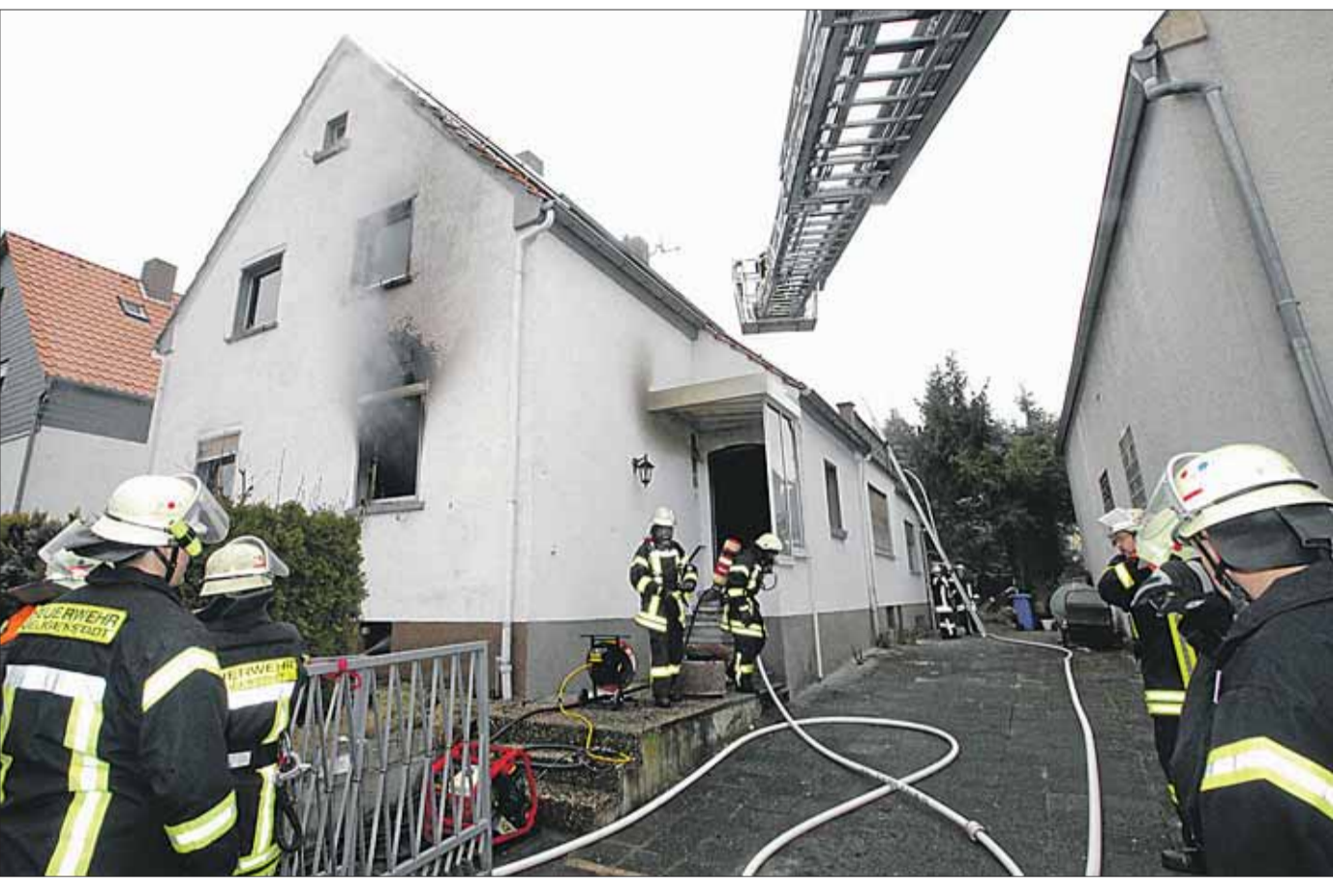
Mit dem Rettungshubschrauber musste am vergangenen Dienstagmittag eine Bewohnerin nach einem Brand in Seligenstadt in der Ellenseestraße in eine Klinik geflogen werden. Gegen 12.20 Uhr rückten die Feuerwehr und Polizei zu dem Wohnhausbrand aus. Bei Ankunft hatte sich bereits eine große Rauchwolke über dem Gebäude gebildet. Die Löscharbeiten der Feuerwehr dauern derzeit an. Die 73-jährige Seniorin war zum Unglückszeitpunkt offenbar alleine im Haus. Die Kriminalpolizei hat die Ermittlungen zur Brandursache übernommen.

Eine Knochenqualitätsmessung von Montag, 26. bis Freitag, 30. März, bietet die Sonnen-Apotheke, Königsberger Straße 75, an. Das Apotheken-Team engagiert sich für eine aktive Gesundheitsvorsorge. Die Sonnen-Apotheke, Hainburg lädt alle Bürger im Rahmen einer Aktionswoche zur Knochenqualitätsmessung sowie zur umfassenden Beratung und Information ein.