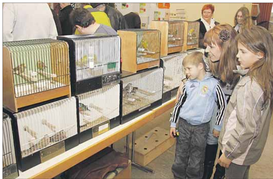
Am vergangenen Sonntag konnte jeder, ohne Voranmeldung, Vögel kaufen oder verkaufen. So kam ein vielfältiger und bunter Markt zustande. Auch Anbieter für Futter und Heimtierbedarf waren im Vereinsheim an der Steinheimer Straße anwesend bei der großen Vogelbörse der Seligenstädter Vogelfreunde.

ben“ bestimmt. Wer kennt sie nicht, die Bilder von Kindern, die auf Müllhalden nach Essbarem suchen um sich und ihre Familien zu ernähren, oder die Bilder von Kindern, die in den Slums aufwachsen, ohne Schulbildung und Perspektive auf eine berufliche Zukunft?