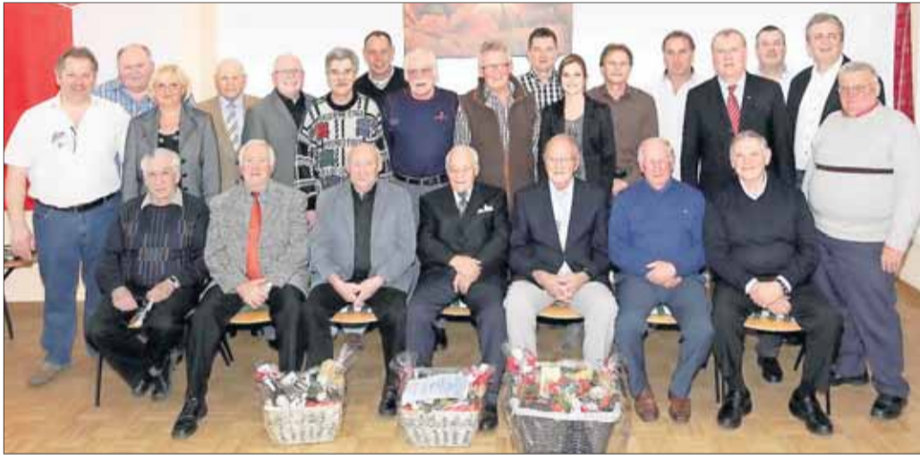
Zahlreiche verdiente Mitglieder und Jubilare der TuS kamen während der gut besuchten Hauptversammlung zu besonderen Ehren.

Froschhausen – Die Generalversammlung der Turn- und Sportgemeinschaft Froschhausen fand im Vereinsheim an der Lache statt. Zunächst berichtete der Erste Vorsitzende