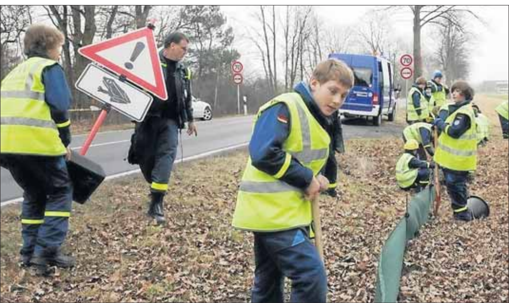
Mit Hilfe der Jugendgruppe des THW Seligenstadt und weiteren Helfern wurde am vergangenen Wochenende ein rund 450 Meter langer Krötenschutzzaun an der Landstraße zwischen Seligenstadt und Zellhausen errichtet. Im vergangenen Jahr seien an dem erstmals an dieser Stelle errichteten Zaun über 450 Erdkröten gesammelt und in Eimern über die Straße zum See gebracht worden.