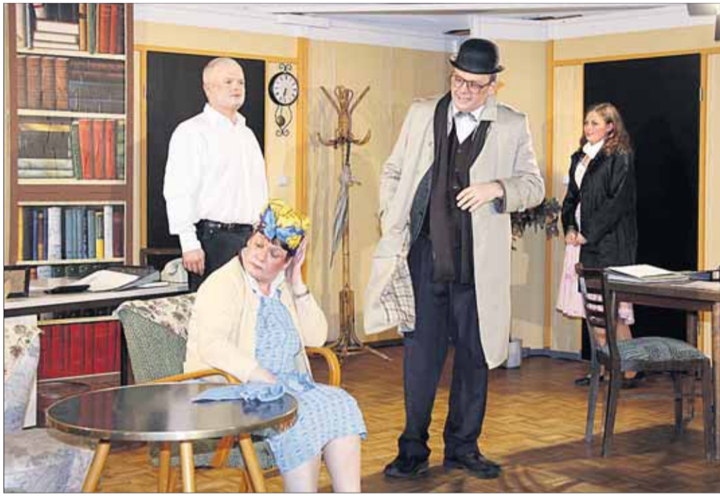
Die Komödie „Keine Leiche ohne Lily“ führte die Theatergruppe des Frohsinn am vergangenen Wochenende im Pfarrsaal von Klein-Krotzenburg auf. Das turbulente englische Kriminalstück von Jack Popplewell in drei Akten bot spannende Unterhaltung der besten Art. Mit viel Liebe zum Detail hatte Regisseur Bernhard Stehr das Stück mit den Aktiven der Frohsinn-Theatergruppe einstudiert. Das bekannte Frohsinn-Theaterensemble überraschte auch dieses Mal mit neuen Gesichtern auf der Bühne und erntete begeisterten Beifall.

HolzLand Becker Der größte Holzfachmarkt Deutschlands! www.holzlandbecker.de