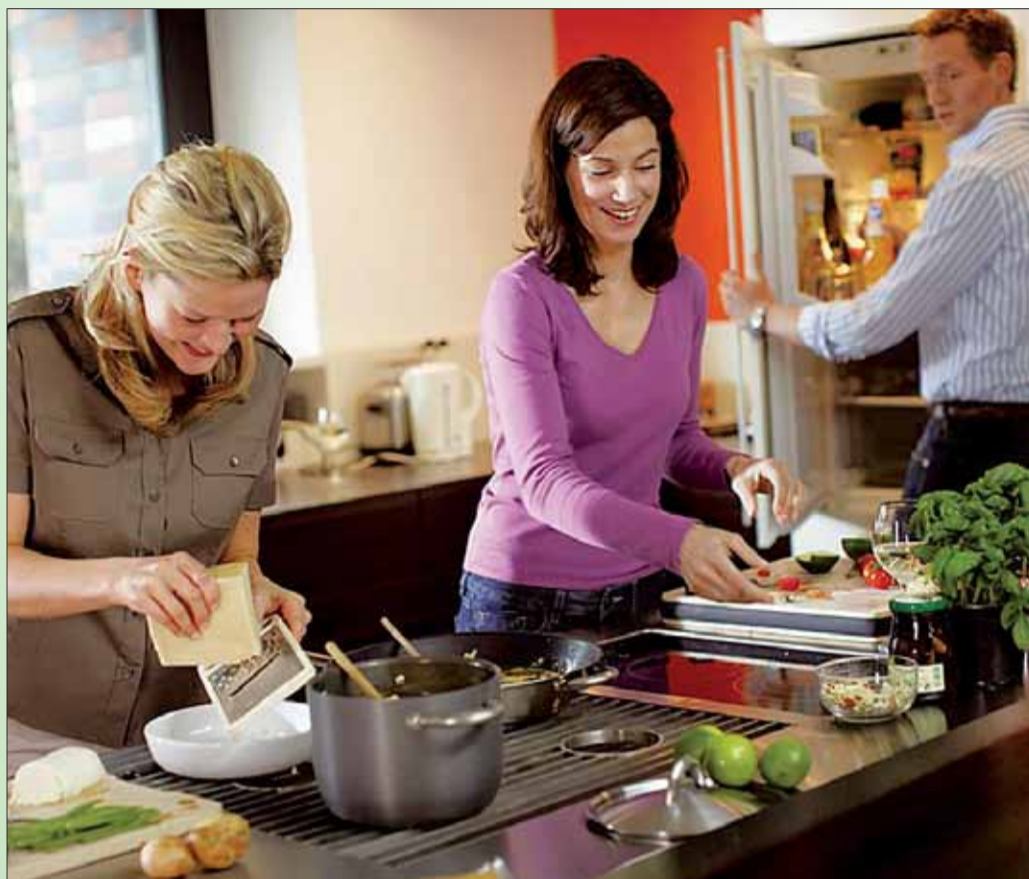
Ips/Pb. Die Erlebnisküche liegt ganz im Trend. Hier kann gemeinsam gekocht und kommuniziert werden.