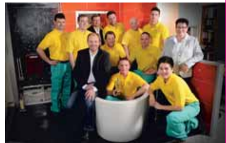
Das gesamte Team der W. Hillenbrand GmbH freut sich auf Ihren Besuch. Wir werden Sie mit all Ihren Anliegen rund um die Bad- und Heizungsmodernisierung kompetent beraten.