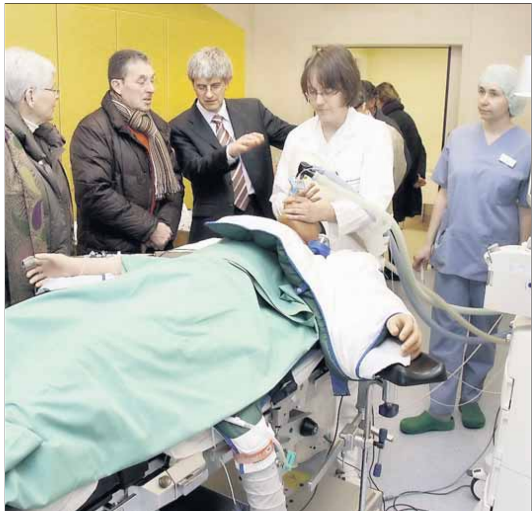
Zur Eröffnung des dritten Zentral-OP gab es vor einer Woche einen Tag der offenen Tür in der Asklepios Klinik. Besichtigt wurden der neue OP-Saal mit modernster Operations- und Anästhesietechnik, der neue Anästhesie-Einleitungsraum, der neue fünf-Betten-Aufwachraum sowie die Ausstattung der Räumlichkeiten mit aufwändiger Klimatisierungs- und Belüftungstechnik. Es wurden Führungen und Demonstrationen angeboten. Das kompetente Team stand für Fragen zur Verfügung.

Seligenstadt – Einhard, Eginhard, Beseleel, Kanzler und Biograph von Kaiser Karl dem Großen = verschiedene Namen für einen großen Mann unserer Geschichte. Wer mehr über diese erstaunliche Persönlichkeit aus dem 8./9. Jahrhundert erfahren möchte, begibt sich mit Uschi Lüft auf eine Führung auf Einhard's Spuren. Freuen Sie sich auf einen spannenden Rundgang durch die Jahrhunderte und unsere schöne Stadt. Interessenten treffen sich am Samstag, 3. März, um 14 Uhr an der Marktplatzlinde. Eine Anmeldung ist nicht erforderlich. Erwachsene zahlen 3 Euro, Kinder sind frei. Nähere Informationen zu dieser Führung, die jederzeit auch nach Wunschtermin buchbar ist, erhalten Sie unter Telefon: 06182 - 25524.