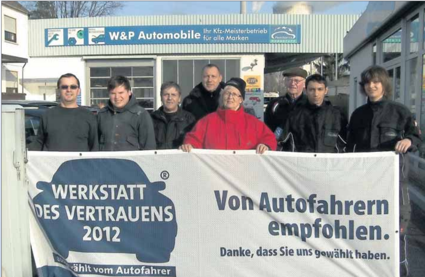
Mit dem Gütesiegel „Werkstatt des Vertrauens 2012“ wurde das Hainburger Autohaus W&P Automobile GmbH dieser Tage ausgezeichnet. Geschäftsleitung und Mitarbeiter freuen sich über das erneut erreichte Zertifikat.

Wahl der Fachjury fiel auf Hainburger Autohaus W&P Automobile GmbH: