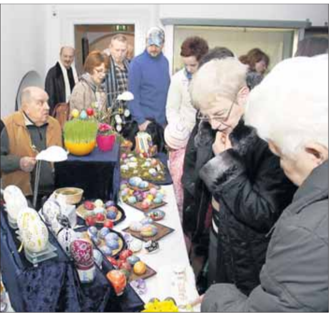
Dicht umlagert sind die farnefrohen Stände des internationalen Ostereiermarktes im Landschaftsmuseum.

5 000 filigrane Kunstwerke im Landschaftsmuseum: