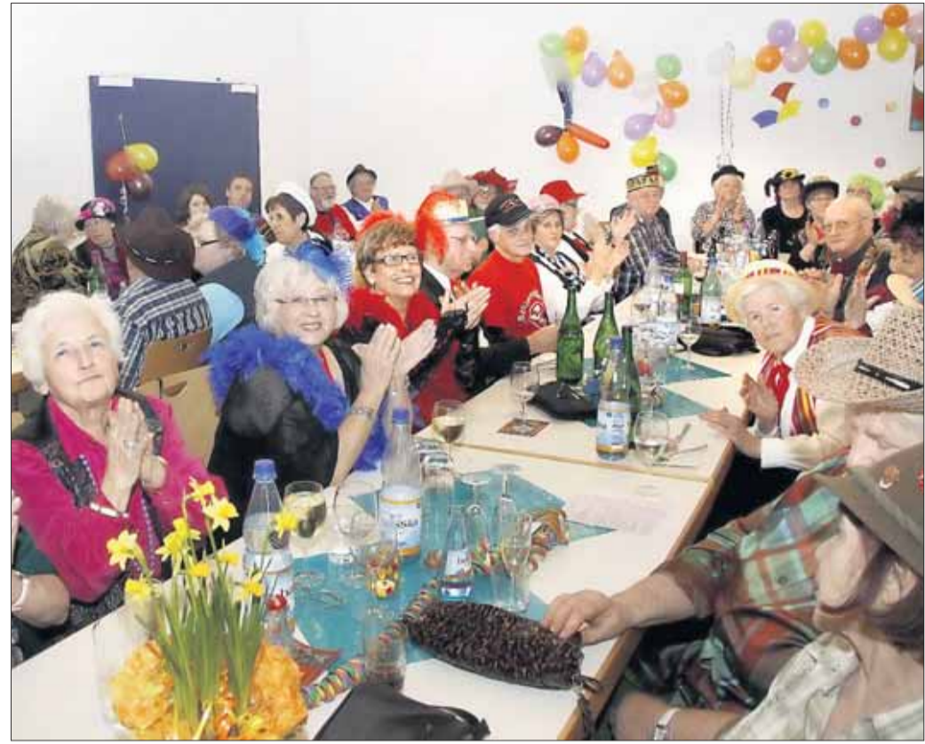
Hoch schlugen die Wellen der Begeisterung bei der Fastnacht des Kilianuschores.

Die Vorsitzende dankte allen Aktiven für ihr En- gagement sowie allen Gästen für ihren Besuch. So war die Kerschchor- fassenacht „St. Kilianus“ auch in diesem Jahr wie- der ein voller Erfolg.