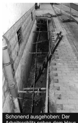
Schonend ausgehoben: Der Arbeitsschlitz neben dem Haus

Kelleraußenwände müssen zum Abdichten freigelegt werden. Was früher mit grossem Aufwand verbunden war, geht mit Hilfe eines Saugbaggers jetzt schnell und vor allem schonend für Hof und Garten! Ein Arbeitsschlitz zum Anbringen der Außenbeschichtung wird in diesem neuen Verfahren bis zur Grundplatte abgesaugt. Zum Beispiel mit einer Bitumenschicht werden die Außenwände und die Hohlkehle dann gegen andrückendes Wasser abgedichtet und somit dauerhaft geschützt. Ein Wärmeschutz zum Einsparen von Energie wird zusätzlich angebracht. Bautenschutz Zieger, ein Odenwälder Unternehmen mit jahrzehntelanger Erfahrung, gibt Garantie auf die Dichtigkeit. Das Verfahren hat viele Vorteile: es gibt keine große Baustelle, die Arbeiten gehen sehr zügig und vor allem schonend für Hof und Garten vorstatten. Das ausgehobene Erdreich kann auf Wunsch erneuert werden. Schon viele Hausbesitzer haben sich für das neue Verfahren entschieden und sind begeistert.