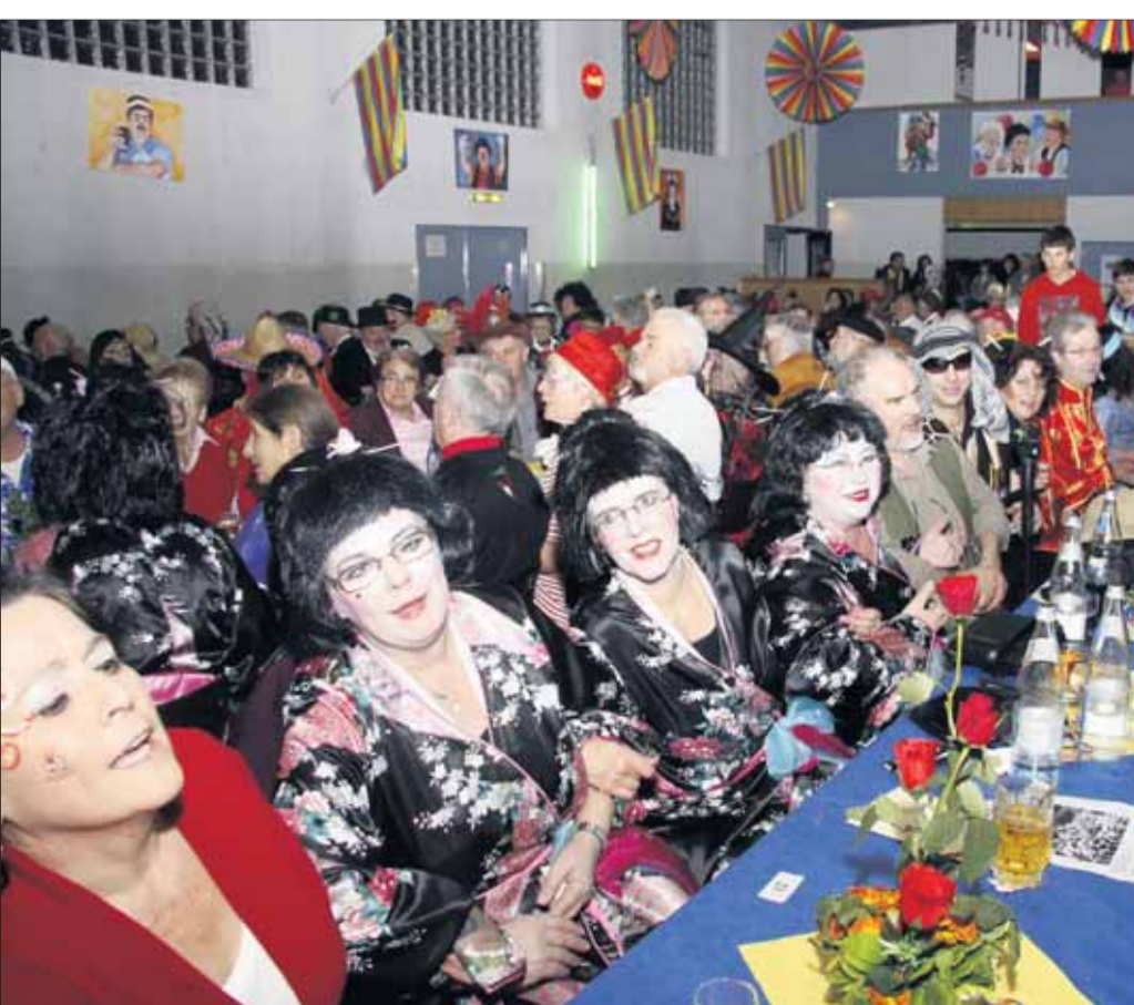
Viel Spass an der Freud' hatten die Mitglieder und Freunde der Harmonie-Sänger.