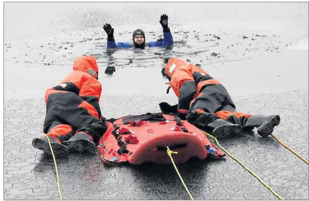
Die Seen im Ostkreis sind teilweise noch mit einer dicken Eisschicht bedeckt. Mit dem einsetzenden Tauwetter steigt aber Risiko das beim leichtfertigen Betreten. Menschen aus dieser bedrohlichen Lage zu retten, übten 30 Helfer der DLRG Stationen Seligenstadt, Mainhausen Hainburg, Mühlheim und Dreieich auf dem „Knochensee“ in Klein-Krotzenburg. Oberstes Ziel der Retter ist der Eigenschutz. Eingepackt in dicker Kälteschutzkleidung und Sicherungseilen arbeiteten sie sich zu dem „Opfer“ vor. Dabei kamen nicht nur technisch aufwendige, schwimmfähigen Rettungsschlitzen, sondern auch einfachen Steckleitern zum Einsatz, um das Opfer an Land zu bringen.