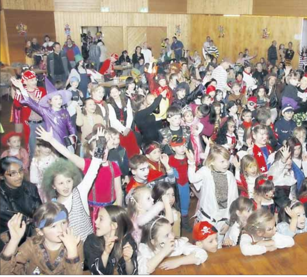
Hoch her ging es beim Kindermaskenball der TuS Froshhausen im Bürgerhaus. Freilich hatten sich auch das Prinzenpaar und das Kinderprinzenpaar angesagt und sie wurden von den kleinen „Fröschen“ mit viel Jubel begrüßt.