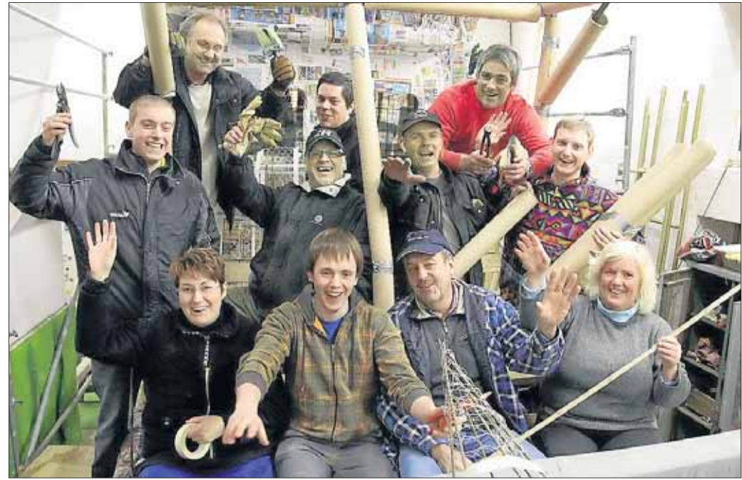
Feuerwehrleute legten den Grundstein für die erfolgreichen Gaudianer.