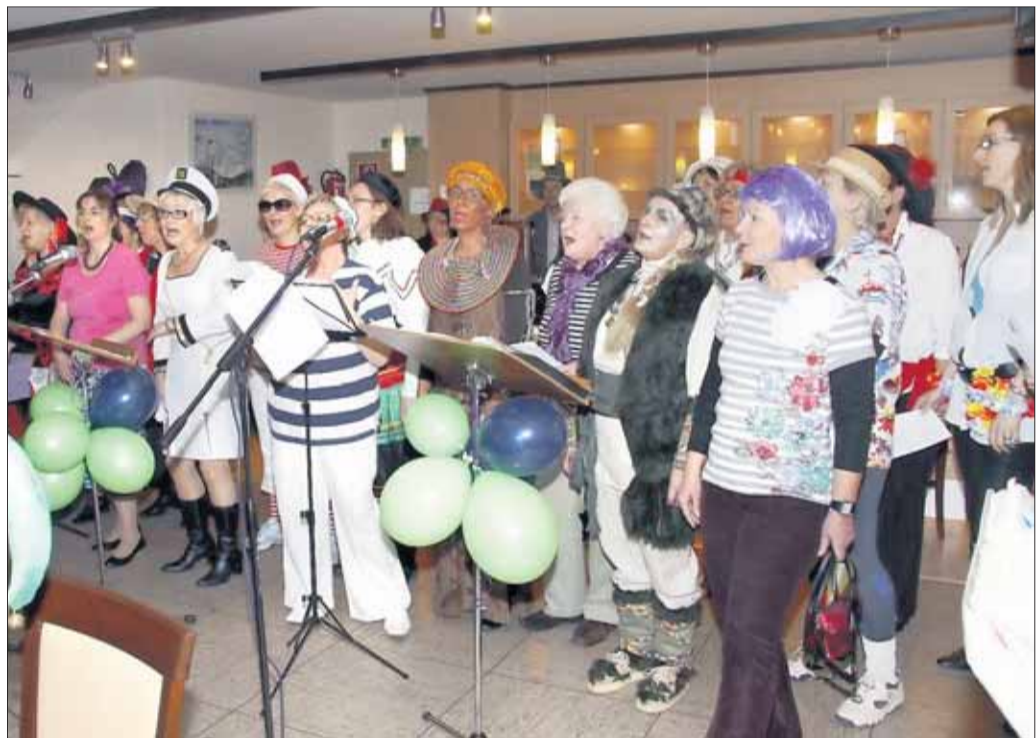
Ein mitreissendes Potpourri präsentierten die Sängerinnen des Liederkranz Klein-Welzheim bei ihrer Fastnacht im Bürgerhaus.