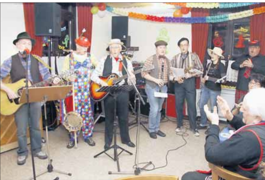
Stimmung, das es kracht bei der Klaa-Krotzebojer Sängerfastnacht.

Festival des Frohsinns bei der Frauensitzung des Tennisclubs Hainstadt: