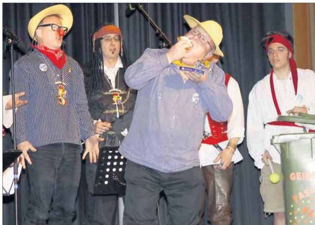
Nicht den Fluch der Karibik, aber den der Lügenbank besangen die Germania 03-Sänger.