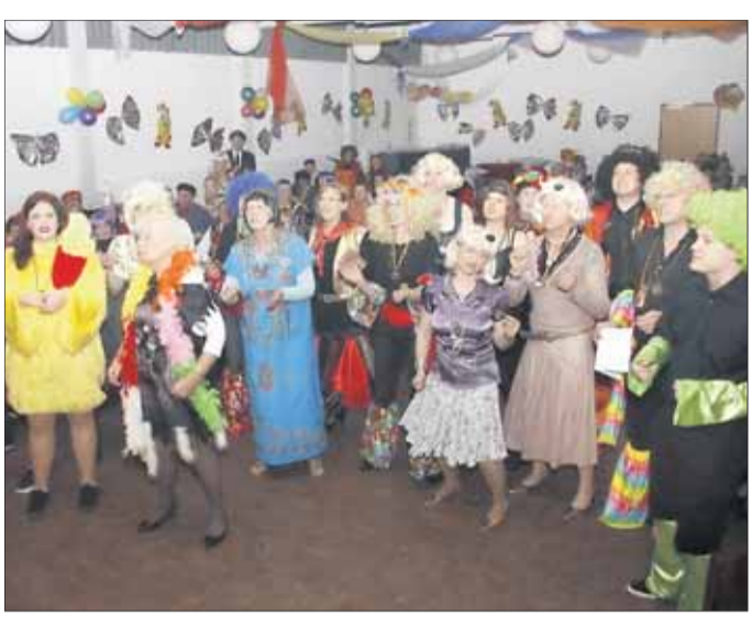
Donnernder Applaus für die Prinzenpaarhuldigung.

Schlumberland – Urwüchsige Fastnacht erlebten die Besucher der traditionellen Chorfastnacht des Chores an der Basilika am vergangenen Samstag im Saal des Pfarrzentrums an der Jakobstraße. Ob Büttenspre-chen, Zwiegespräche oder Gesangsbeiträge, sie zeichneten sich alle durch viel Kreativität aus, waren also Eigenprodukte der Akteure. „Mord im Hühnerstall“ umschrieb Conny Korb ihren Vortrag und die Persiflage auf die Zustände im Hühnerstall machte es den Zuhörern leicht, „Parallelen“ zum wirklichen Leben zu ziehen. Als „Fahrschülerin“, die sich mit den Tücken des Verkehrs auseinandersetzen musste, zeigte einmal mehr Christa Nessel ihr Vortragsgeschick. Julia Aulbach und Maria Nunez begeisterten als „Küken des Chores“ musikalisch das Publikum, schwärmten von ihrem Chorleiter und Lehrer, womit niemand anders als Regionalkantor Thomas Gabriel gemeint war und durch ihre gekonnt vorge-tragenen Gesangsbeiträge eroberten sie die Herzen ihrer Zuhörer in Nu. Eine „Rakete“ war der verdiente Lohn für ihr erfolgreiches Debut. „Nesselfieber“ nannte eine „Troika“, bestehend aus den Altistinnen Uta Borkowska und Conny Korb sowie dem Tenor Heinz Wenzel ihre Darbietung. Die Begeisterung für eine Sangeskollegin animierten die Drei derart, dass sie sich kurzerhand zum Klonen der Dame entschlossen, was ihnen in „Outfit“, Gestik und Mimik hervor-ragend gelang. Als sie das „Original“ dann auf die Bühne gelockt hatten,