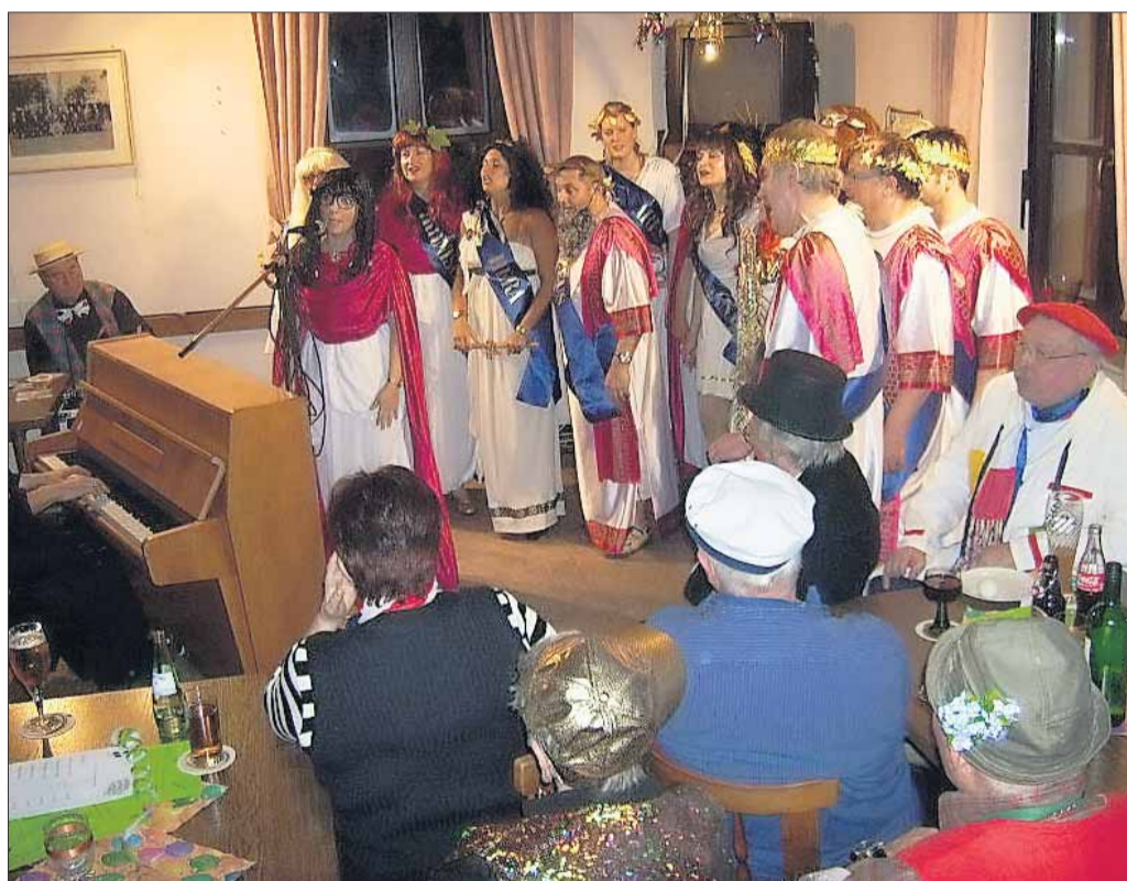
Die Götter vom Olymp begeisterte die Narrenschar des Volkschors bei ihrer närrischen Singstunde im prall gefüllten Sängerheim. Die Gruppe Cross Voices unter Leitung von Stefan Weih riss das närrische Auditorium mit und wurde mit dankbarem Applaus gefeiert.