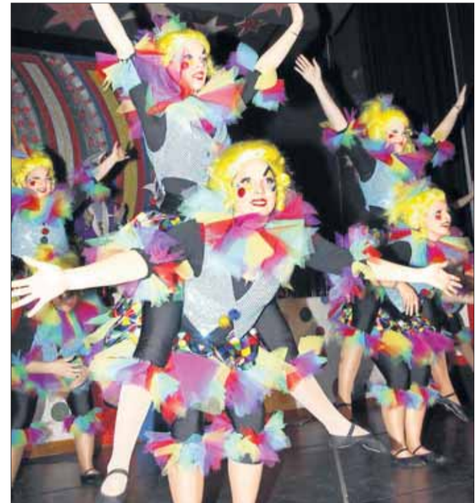
„Sellestadt steht Kopp“ mit Ballettgruppen der SFF.

Sechs Stunden voller Tanz, Musik und Witz - Fastnachtsfreunde besicherten furioses Sitzungsfinale: