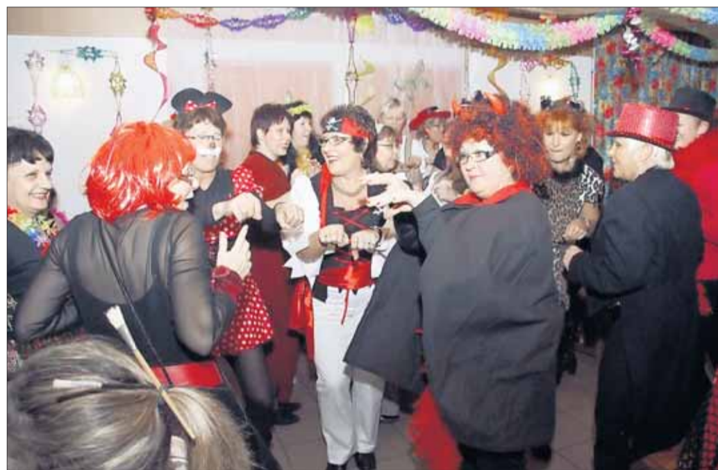
Teuflich gut am Narrenhimmel - die Damen des Tennisclubs Hainstadt wissen zu feiern.