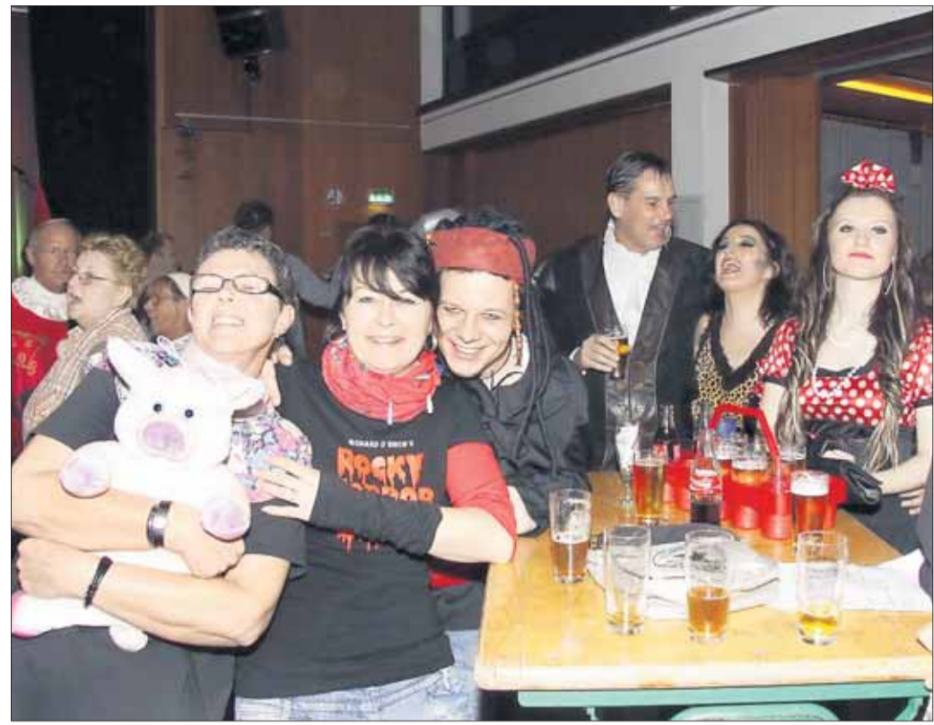
Einen gelungenen Kappenabend feierte die Freiwillige Feuerwehr Mainflingen am vergangenen Samstag im Bürgerhaus. Neben viel Live-Musik und Narretei gab es den spektakulären Auftritt des Männerballetts.

Hainstadt – Am Samstag, 11. Februar, findet im kath.Pfarrzentrum Hainstadt, Kirchplatz, wieder der beliebte Flohmarkt „Rund um das Kind“ statt. In der Zeit von 14 bis 16.30 Uhr kommen Schnäppchenjäger voll auf ihre Kosten. Angebote werden gut erhaltene Kinderbekleidung, Schuhe, Spielsachen, Kinderwagen, Fahrzeuge uvm. Der Flohmarkt wurde sonst immer in der Sporthalle ausgerichtet und wurde jetzt umgeleitet. Der Erlöß von der Standgebühr geht an das Hospiz in Hanau. Am Verkaufstag liegen wieder Listen für den nächsten Flohmarkt aus.