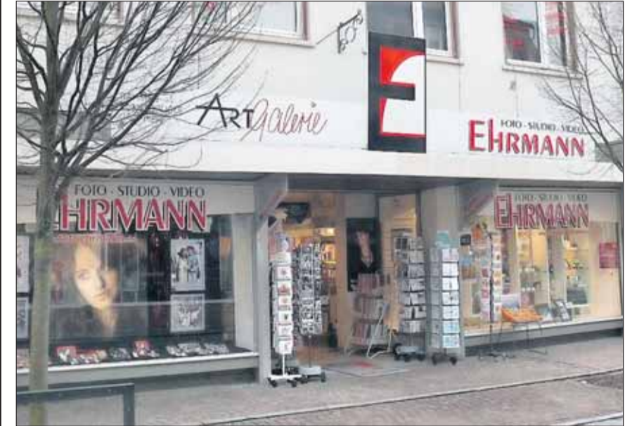
Ehrmann Fotografie und zahlreiche Aussteller freuen sich auf Ihren Besuch

ren Sie zusätzlich an diesem Tag. Die Blumenwerkstatt, Bahnhofstraße 13, präsentiert anspruchsvolle Hochzeitsfloristik. Coiffeur und Cosmetic Schreiber, Bahnhofstr. 5, zeigt Modernes Haardesign, Styling, Coloration und Wellen, Hautpflege, Make up, Haarverlängerung und -verdichtung, spezielles Event-Styling so für Hochzeiten mit professioneller Typ- und Imageberatung. Süße und verführerische Kostproben gibt es von Cafe und Coniserie Rapp, Bahnhofstraße 18. Anspruchsvollen und individuellen Schmuck zeigt das Atelier Schmuckstück aus der Aschaffener Straße 39. Das Hotel „Mainterrasse“, Kleine Maingasse 16-18, bietet unvergessliche Arrangements im historischen Ambiente und mit kulinarisch Genüssen. Für die individuelle Nagelgestaltung für den schönsten Tag sorgt Maria Leibundgut aus der Bahnhofstraße 3 in Seligenstadt. Die Romantic Brautgalerie, Offenbacher Straße 39 aus Mühlheim präsentiert aktuelle Kollektionen traumhafter Braut- und Abendmoden. Passend zum Brautkleid gibt es schöne Accessoires, wie Schleier, Schuhe, Dessous und Schmuck. Patricia hesbacher aus Sulzbach informiert Sie über das perfekte Make up und gibt perfekte Stylingtipps. Und last but not least wird das DERPART REISEBÜRO AZZURRO, Bahnhofstrasse 25, Reiseziele für eine unvergessliche Hochzeitsreise präsentieren.