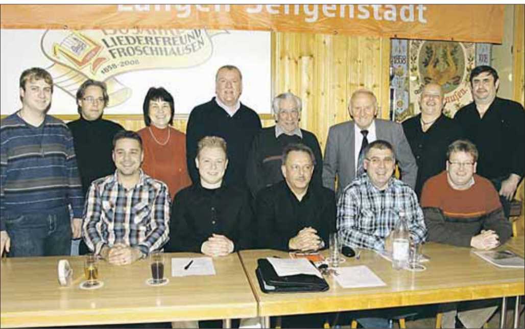
Wahlen zum neuen Vorstand (Bild) standen im Mittelpunkt der harmonisch verlaufenen Jahresversammlung im Vereinsheim des Gesangsvereins Liederfreund 1858 Froschhausen.

Ausleihegeschäft. Dazu kommt noch eine viel größere Zahl der Arbeitsstunden für die Beschaffung, Erfassung und Katalogisierung der Medien, und schließlich die Säuberung der Einrichtung und Dekoration des Raumes im Obergeschoss des Maximilian-Kolbe-Haus, sowie Teamsitzungen und Besprechungen. All dieses geschieht völlig unentgeltlich, also ehrenamtlich. Außerdem finden in regelmäßigen Abständen Veranstaltungen statt. Im letzten Jahr 2011 waren dies ein Autorenabend mit Ines Thorn, Schul- und Kindergartenführungen.