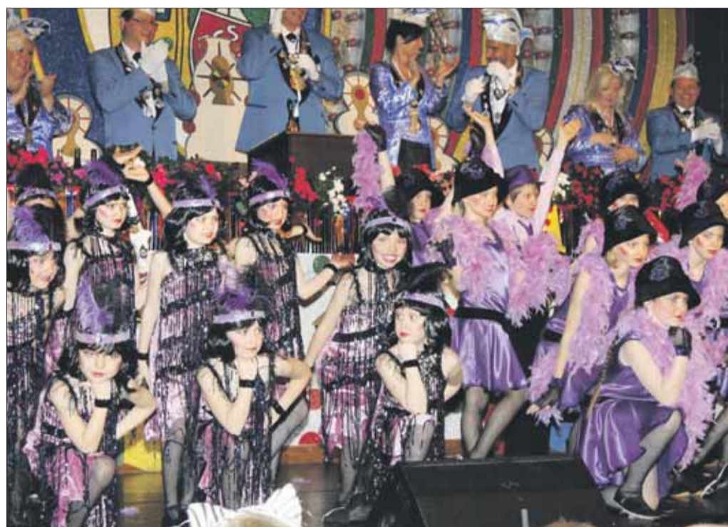
Entzückend! Enthusiastischer Applaus für das TGS-Miniballett mit stilechtem „Charlston“.

TGS-Traum paar Prinz Daniel I. (Zöller) und Prinzessin Jil (Veits) regieren die kleinen Schlumber: