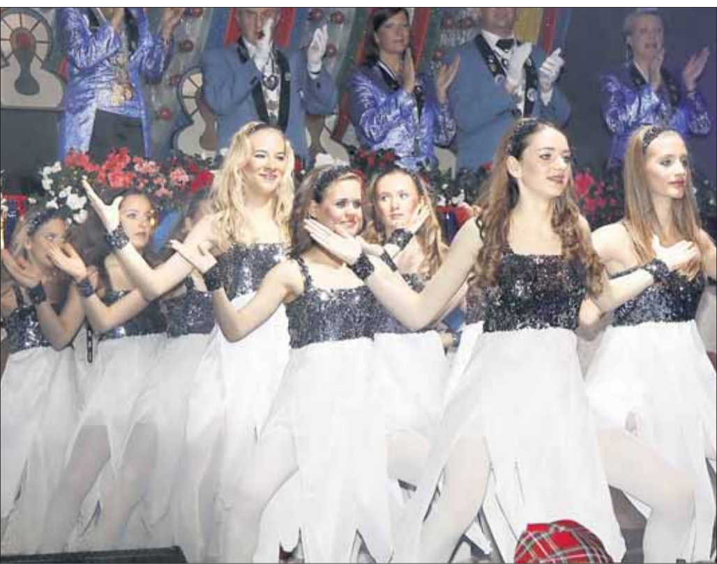
Engel sind in Seligenstadt nie weit - die TGS-Tanzgruppe Showtime mit „Engelstanz“.