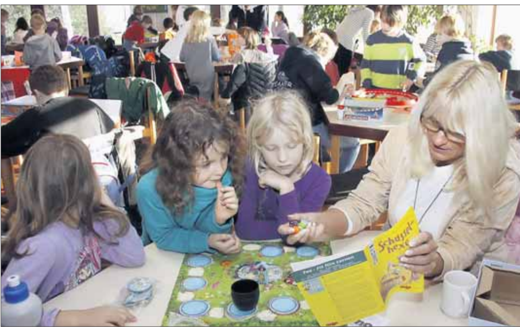
Großes Interesse am Spielen - das Gemeindezentrum platzte aus allen Nähten.