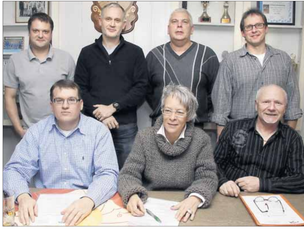
Seine gut besuchte Jahresversammlung mit Wahlen zum Vorstand (Bild) hatte der ASV „Einigkeit“ Klein-Krotzenburg am vergangenen Freitag in der Gaststätte „19 Hundert“ in Klein-Krotzenburg.

Stimmung sind, wünschen sich die Verantwortlichen, dass alle kostümiert kommen. Beginn des närrischen Treibens im großen Mövia-Saal des Vereinsheims an der Einbahnstraße ist um 19.01 Uhr, der Einlass erfolgt bereits um 18.31 Uhr. Nachdem erfolgreich in diesem Jahr eingeführten Kartenvorverkauf, gibt es nur noch ganz wenige Karten im Vorverkauf. Erhältlich sind diese bei Lotto Griehl und Nails and Hands (G. Speicher-Fischer) in Hainstadt sowie bei allen Mitgliedern des GV Germania und dem Kleinen Rat.