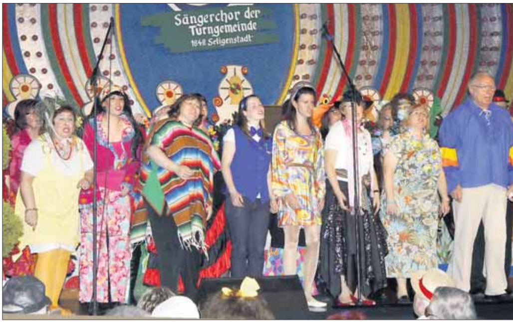
TGMix mit Tanz und Gesang vom Feinsten.