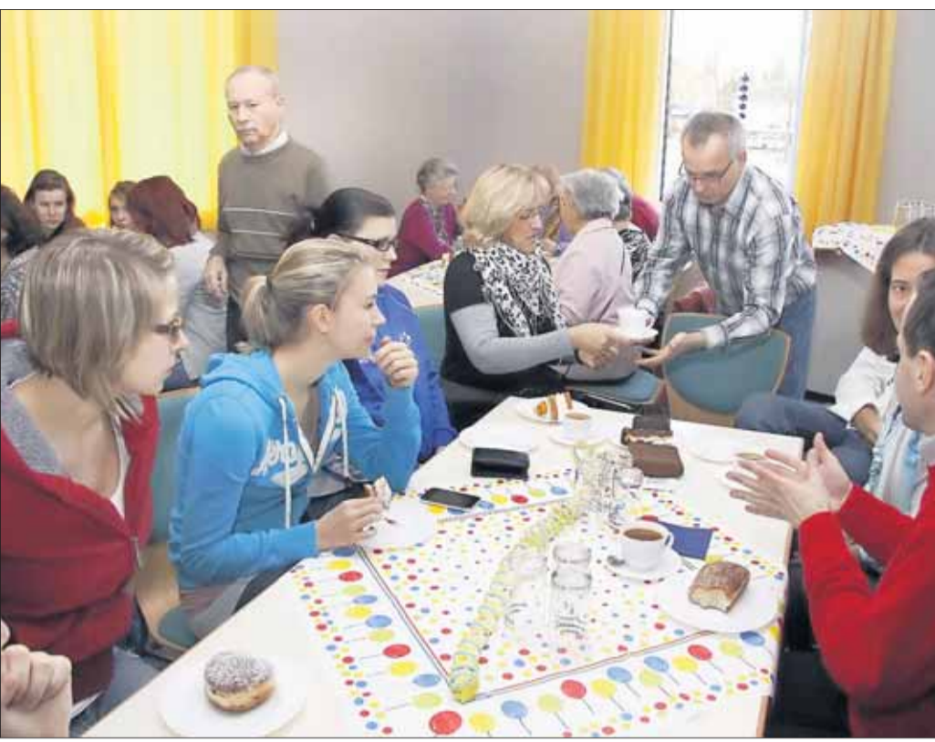
Den ersten Kreppekaffee der Mövia im renovierten Raum der Germania Hainstadt feierte der Verein in närrischer Runde. Über den sehr guten Besuch, schon kurz nach Beginn kaum noch ein Platz frei, freuten sich Vorstand und Akteure. Geboten wurde ein kleines, feines Programm mit zwei Vorträgen und Sketchen der Vereinskinder.