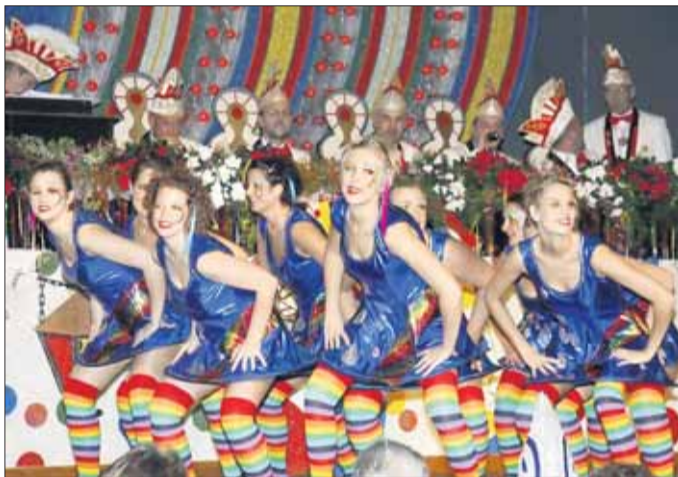
Hinreißend närrisch und bunt - das Heimatbund-Midi-Ballett.