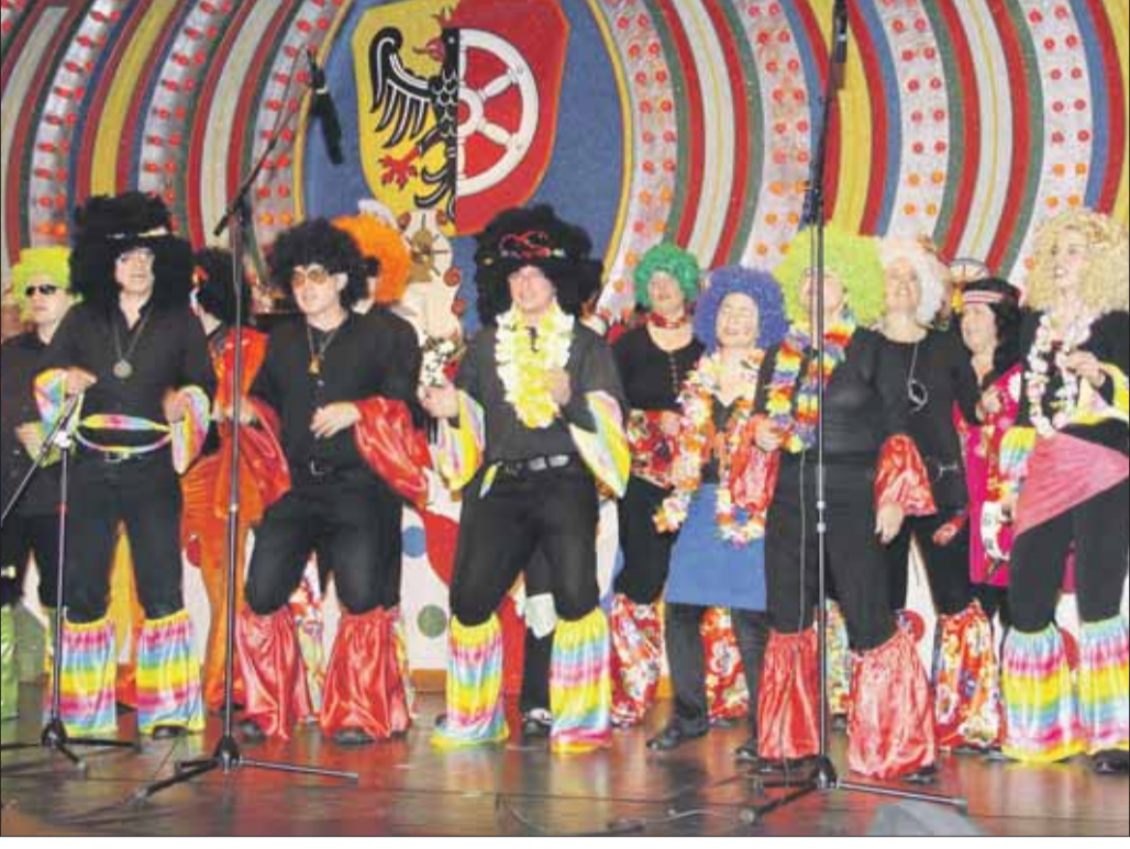
Ein Highlight der Heimatbund-Gala ist die „Prinzenhuldigung“ des Chores an der Basilika.