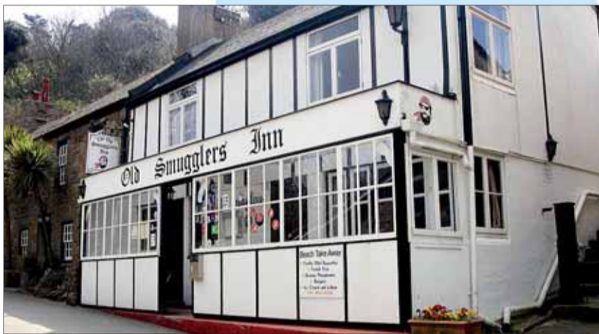
Ips/Cb. Keine Steueroase mehr: Kanalinsel Jersey, traditionelles Lokal

die Kanalinseln oder Man führen Steuern anonym ab. Was fällt überhaupt unter den Begriff ausländische Kapitalerträge? Die wichtigsten Beispiele sind hier genannt: – Dividenden und andere Ausschüttungen aus Geschäftsanteilen. – Rückvergütungen und Gewinnanteile aus Erwerbs- und Wirtschaftsgenossenschaften. – Bezüge aus Genussrechten und Beteiligungskapital. – Sparzinsen und sonstige Zinserträge aus Geldanlagen bei Kreditinstituten im Ausland. – Kapitalerträge aus Forderungswertpapieren ohne inländische Kuponanzahlende Stelle. – Ausschüttungsgleiche Erträge ausländischer Kapitalanlagefonds einschließlich bestimmter Substanzgewinne (also Gewinne aus der Veräußerung von Vermögenswerten eines Fonds).