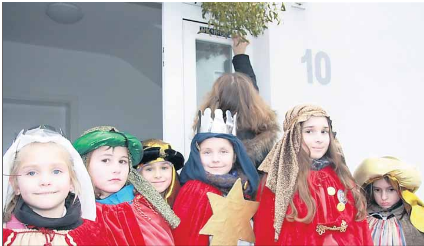
38 Mädchen und Buben waren bei der Sternsingeraktion in Zellhausen unterwegs.

■ Große närrische Sitzung der Harmonie Zellhausen am 4. Februar ab 19.31 Uhr im Bürgerhaus. Anschließend Party-Tanz und Barbetrieb.