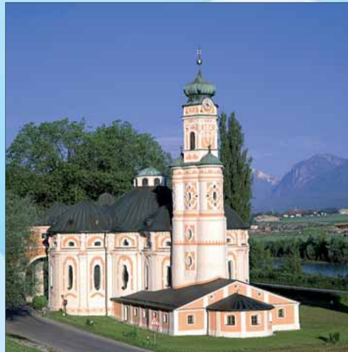
Ips/Cb. Ohne Freistellungsauftrag ggf. auch Kirchensteuerabzug

getrennte Konten erteilen. Einzel-Freistellungsaufträge sind grundsätzlich möglich.