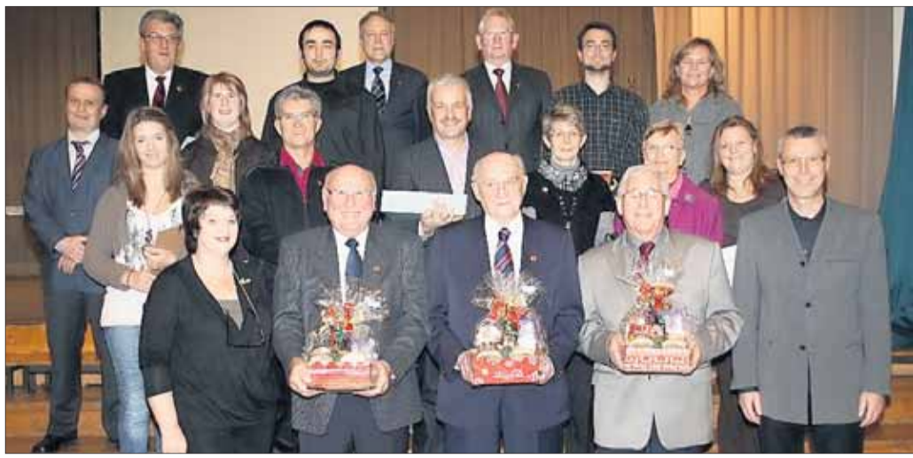
Bei der Jahresabschlussfeier der Sängervereinigung Mainflingen wurden aktive und passive Mitglieder geehrt, sie erhielten Ehrennadeln, Urkunde und ein Präsent.

Mainflingen (tku) Eine Anzahl von Geehrten konnte dieser Tage anlässlich eines vorweihnachtlichen Ehrenabends der Erwachsenenchöre der Sängervereinigung im Bürgerhaussaal ihre Auszeichnungen für