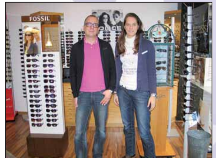
Schwind Sehen + Hören, Frankfurter Str. 19, 63500 Seligenstadt, Tel. 06182 / 82 94 30