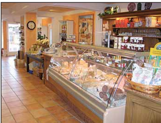
Barletta Feinkost & Vinothek, Marktplatz 763500 Seligenstadt · Telefon 0 61 82 / 78 24 62