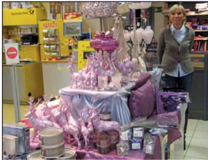
Der Papierladen Seligenstadt, Bahnhofstr. 40 63500 Seligenstadt, Tel. 06182 / 35 73