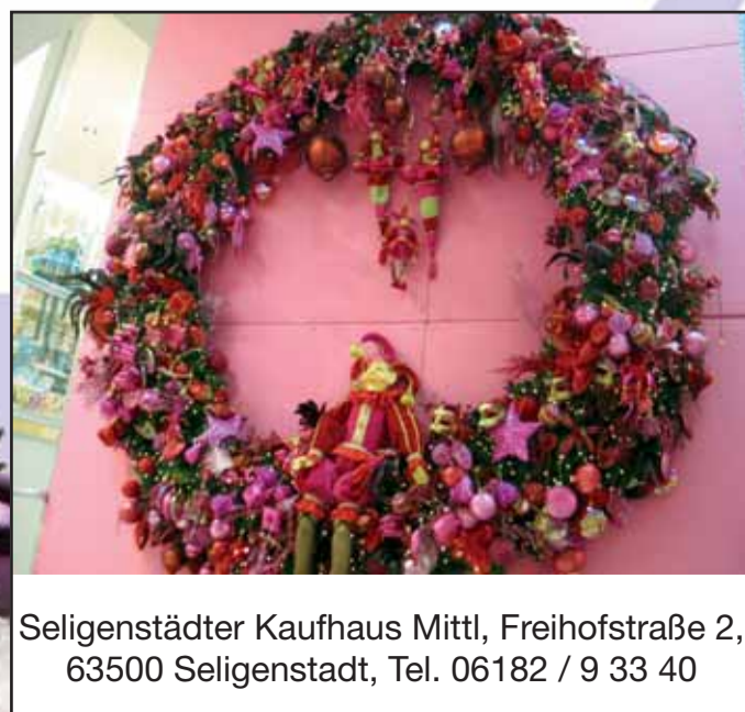
Seligenstädter Kaufhaus Mittl, Freihofstraße 2, 63500 Seligenstadt, Tel. 06182 / 9 33 40