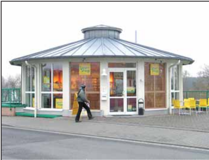
Weber Smart Shop Frankfurter Str./Ecke Steinweg Tel. 06182 / 9 60 79 72 Steinheimer Straße 69, Tel. 06182 / 7 82 88 64