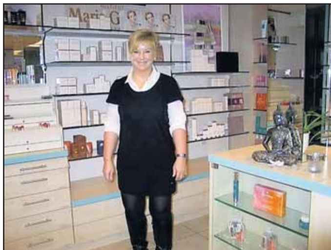
Body & Care Kosmetik, Frankfurter Str. 17 63500 Seligenstadt, Tel. 06182 / 20 06 22