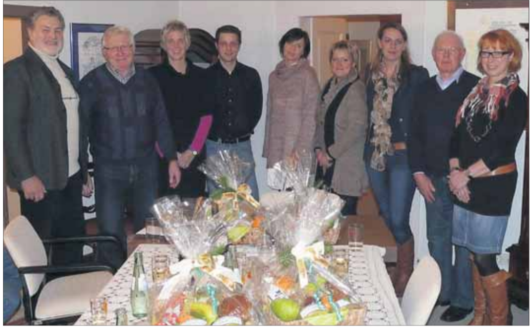
Freude bei den Gastgebern für die Ehrung durch den Heimatbund von „Klaa Frankreich“, Förderverein des Kindergartens „Regenbogen“, Gruppe „Schwesternhaus“ und dem Pfarrhaus.

Seligenstadt (rra) – Das zurückliegende Geleitsfest wurde von Heimatbund mit einem Wettbewerb zur Ausschmückung des Festes am 18. und 19. Juni 2011 begleitet. Insgesamt erklärten sich 17 Vereine dazu bereit, anlässlich des Geleitsfestes als Gastgeber zu fungieren. Dabei konzentrierte sich die Bewirtung von zehn Vereinen auf kleine bis größere Privathöfe und -grundstücke, während sieben Ver-