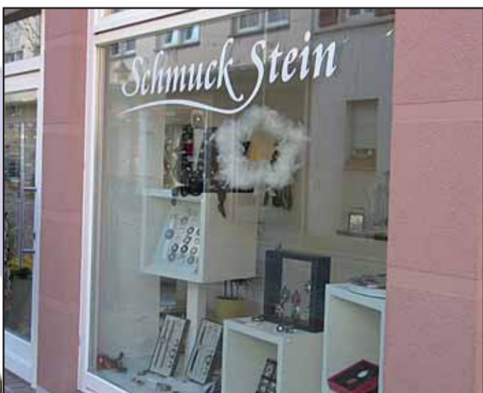
Schmuck Stein, Bahnhofstraße 6 63500 Seligenstadt, Tel. 06182 / 6 40 83 00