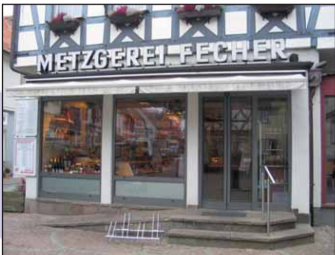
Metzgerei Fecher, Aschaffener Str. 31 63500 Seligenstadt, Tel. 06182 / 33 22