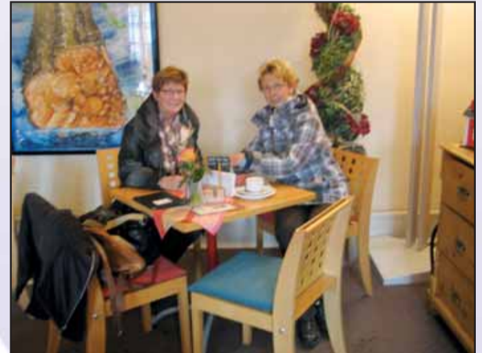
Förderkreis Lichtblick Klostercafé, Klosterhof 2, 63500 Seligenstadt, Tel. 06182 / 89 83 60