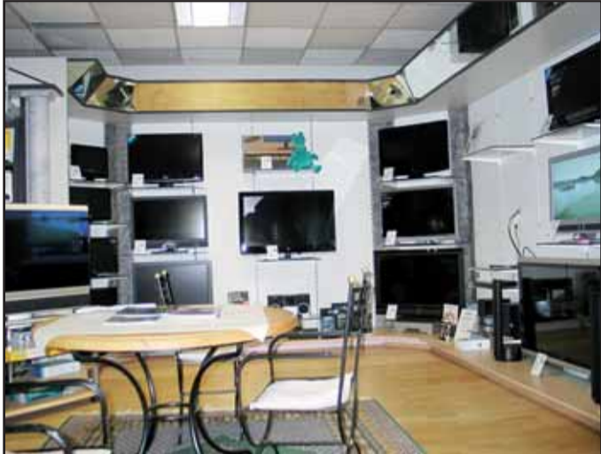
Elektrohaus Baier, Walinusstr. 27 63500 Seligenstadt, Tel. 06182 / 34 70