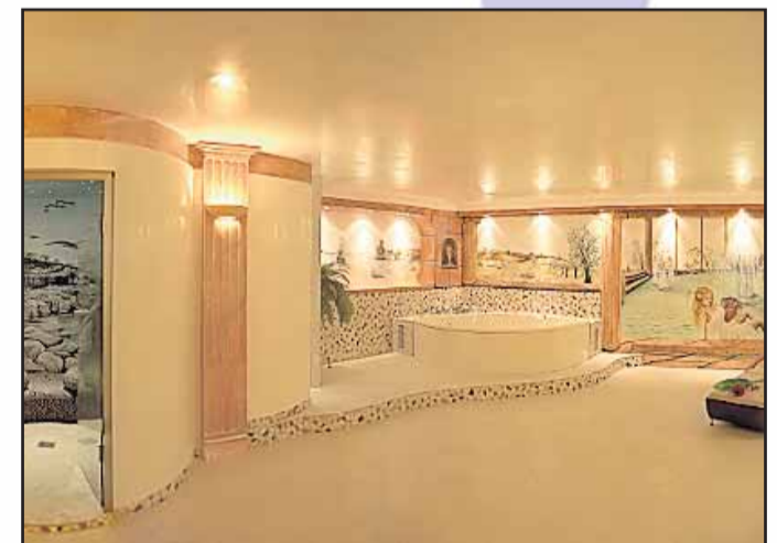
Relaxed Beauty, Giselastr. 17 63500 Seligenstadt, Tel. 06182 / 82 68 22