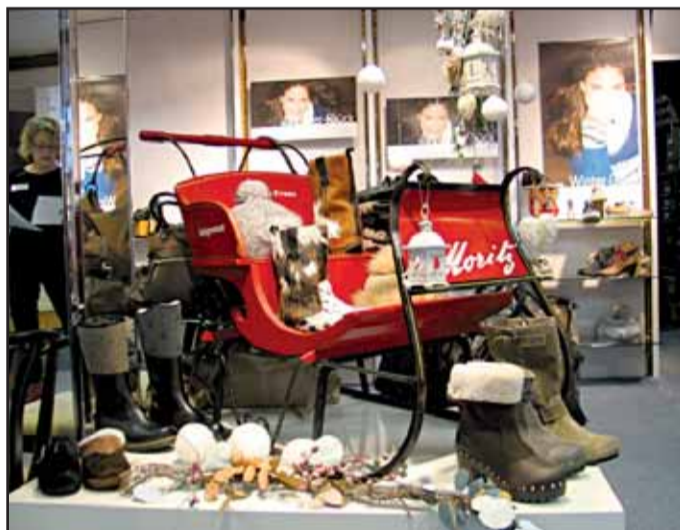
Schuhhaus Franz, Aschaffener Str. 17 63500 Seligenstadt, Tel. 06182 / 2 24 11