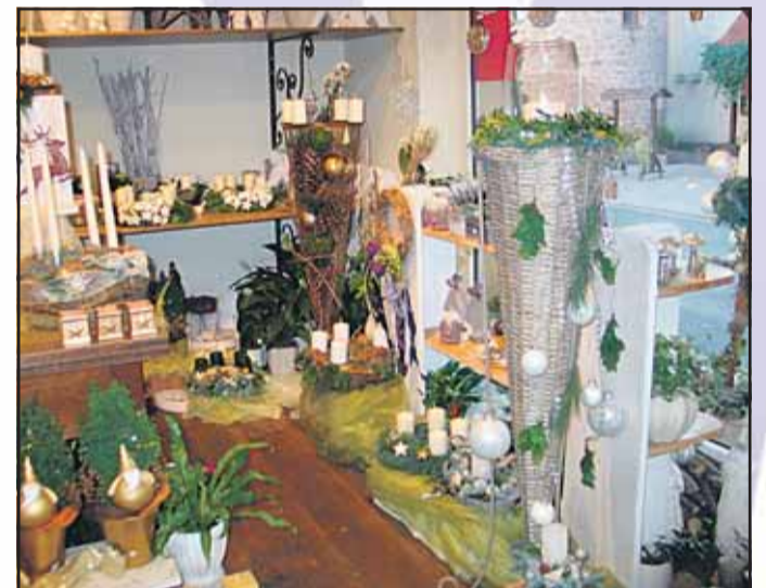
Die Blumenwerkstatt, Bahnhofstraße 13, 63500 Seligenstadt, Tel. 06182 / 82 68 40