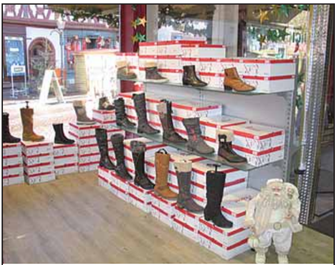
Quick-Schuhe, Aschaffener Str. 2 63500 Seligenstadt, Tel. 06182 / 2 22 67