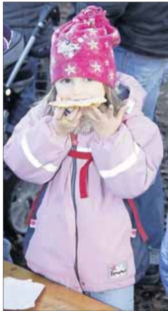
Frische Waldluft sorgt für guten Appetit.

dieses Mal fehlte: das große Lagerfeuer, an dem man sich gerne versammelte, wärmte, die Flammen beobachtete und in der Glut stocherte. „Für die Kinder zu gefährlich“, begründete die Bürgermeisterin. Stattdessen