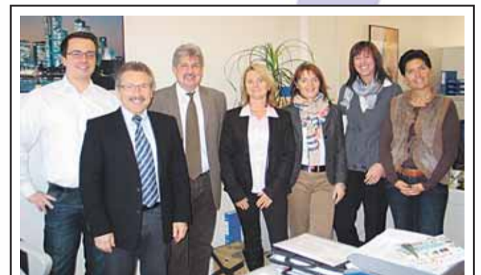
Versicherungsbüro Friedrich Bahnhofstraße 40, 63500 Seligenstadt Telefon 06182 / 89 59 40