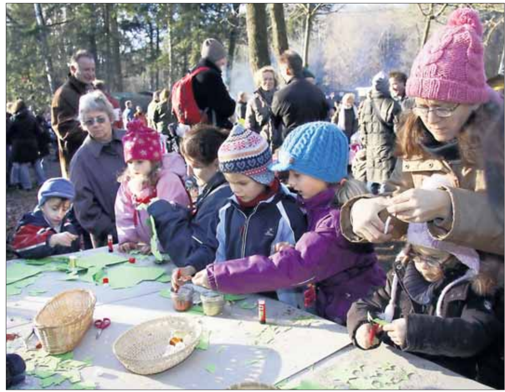
Basteln für's Christkind - da ließen sich die Gäste nicht lange bitten ...

qualmten drei große Schwedenfeuer. Außerdem vermisste man die Betreuungsgruppe der Konrad-Adenauer-Schule, die neben dem TGS Musikcorps, dem Frauenchor Germania und dem Refreshed Orchestra einen musikalischen Beitrag angekündigt hatte. „Reihenweise erkrankt“, lautete die Erklärung. Dann war Mittag und das Publikum blies zum Hallali auf einen leckeren Imbiss. Doch was zuerst probieren? - Yogi-Tee und Spundkäs-Brote vom Kinderclub, Cre^pes von der Don-Bosco-Schule, feuriges Chili von der Kita „Die wilde 13“, Tote Tante (Kakao, Rum, Sahne) von der IG Niederfeld, Gulaschsuppe von der Kolpingfamilie oder warmer Apfelwein mit Zimtler von den Traktorenfreunden? Viele hatten den Braten gerochen: Beim