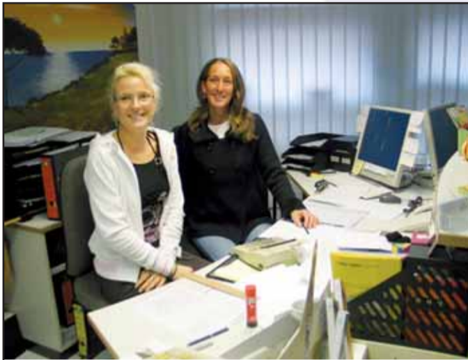
Offenbach Post, Aschaffener Str. 8 63500 Seligenstadt, Tel. 06182 / 92 98 31