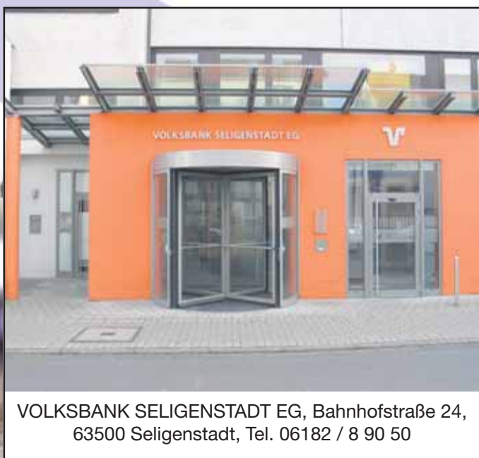
VOLKSBANK SELIGENSTADT EG, Bahnhofstraße 24, 63500 Seligenstadt, Tel. 06182 / 8 90 50