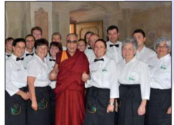
Metzgerei Kuhn, Dieselstraße 7, 63500 Seligenstadt, Tel. 06182 / 2 51 34