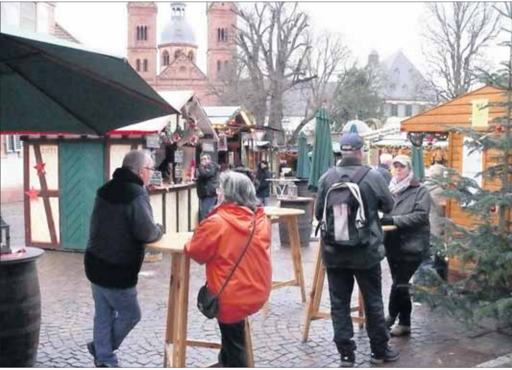
Die malerische Altstadtkulisse des Freihofs bietet wieder einmal den Hintergrund für den traditionellen kleinen Budenzauber des Gewerbevereins Seligenstadt. Noch bis zum 22. Dezember findet auf dem Freihofsplatz ein kleiner Budenzauber statt. Stöbern Sie nach Geschenken und genießen sie bei Glühwein und deftigen Schmankerl den grandiosen Blick auf die Fachwerkhäuser und die Einhard-Basilika. Auch an die Kinder ist gedacht: leckere Crepes, ein Karussell warten auf Euch. Geöffnet ist täglich von 15 bis 20 Uhr, samstags von 10 bis 20 Uhr und sonntags von 12 bis 20 Uhr.