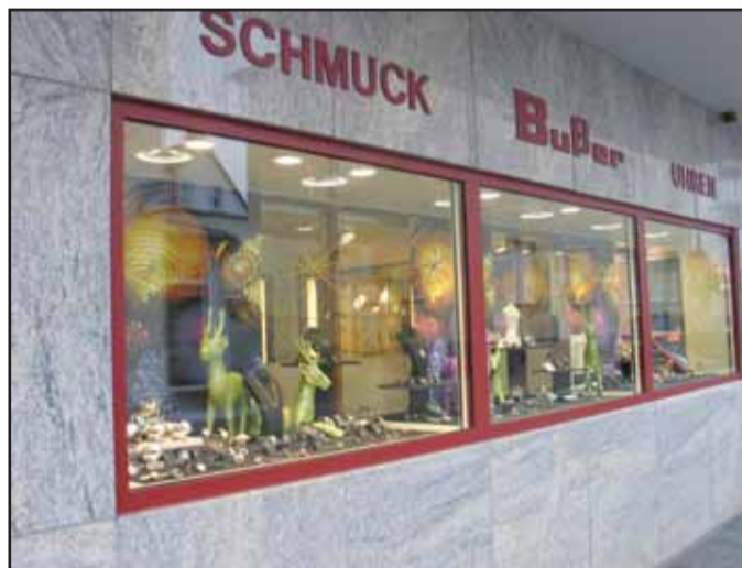
Busser Uhren Schmuck, Bahnhofstr. 16, 63500 Seligenstadt, Tel. 06182 / 34 25