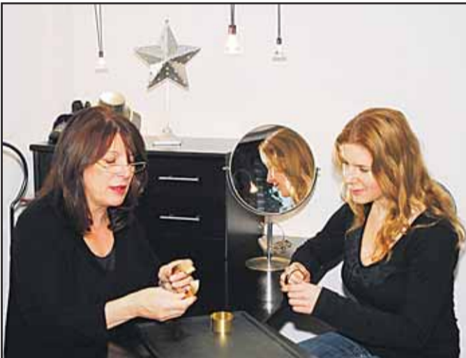
Schmuckatelier Irina Esser, Palatiumstraße 14, 63500 Seligenstadt, Tel. 06182 / 2 86 38