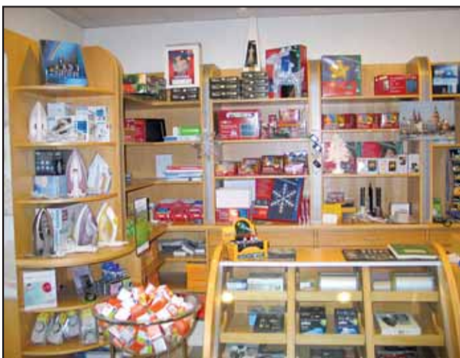
Elektro Dambruch, Frankfurter Straße 11, 63500 Seligenstadt, Tel. 06182 / 36 20