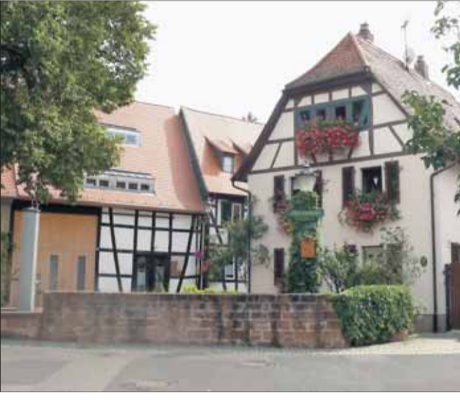
Idylle pur: „Klaa Frankreich“ führt die Liste der Preisträger an.

der Aschaffenburger Straße als das „am schönsten geschmückte Haus“. Die Preisträger dankten herzlich und freuten sich, dass ihre Dienste im Sinne der Stadt und des Brauchtums soviel Anklang gefunden haben.