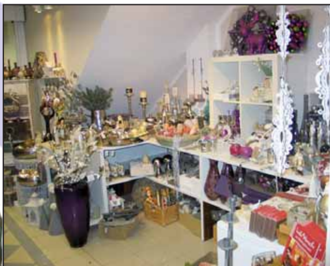
Link Ihr Treffpunkt Zuhause, Freihofstraße 1, 63500 Seligenstadt, Tel. 06182 / 33 01