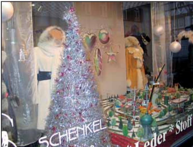
Schenkel MANUFAKTUR, Steinheimer Str. 10 63500 Seligenstadt, Tel. 06182 / 2 38 30