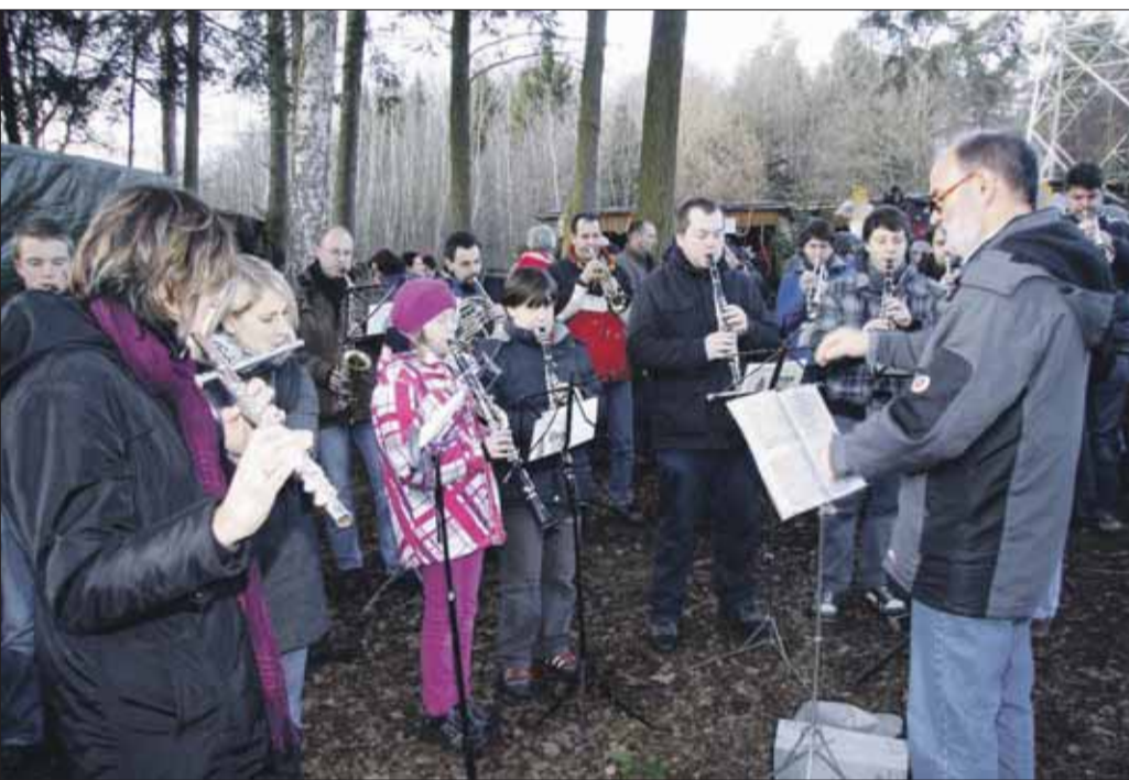
Ein abwechslungsreiches Weihnachtskonzert im Stadtwald präsentiert das TGS-Musikcorps.