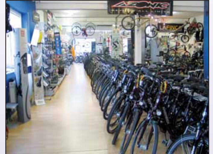
Radsport König, Ferdinand-Porsche-Str. 16a 63500 Seligenstadt, Tel. 06182 / 89 94 94