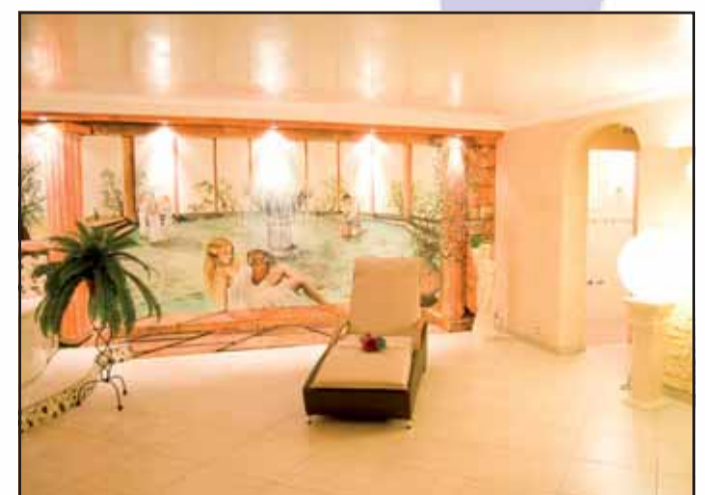
Relaxed Beauty, Giselastr. 17 63500 Seligenstadt, Tel. 06182 / 82 68 22