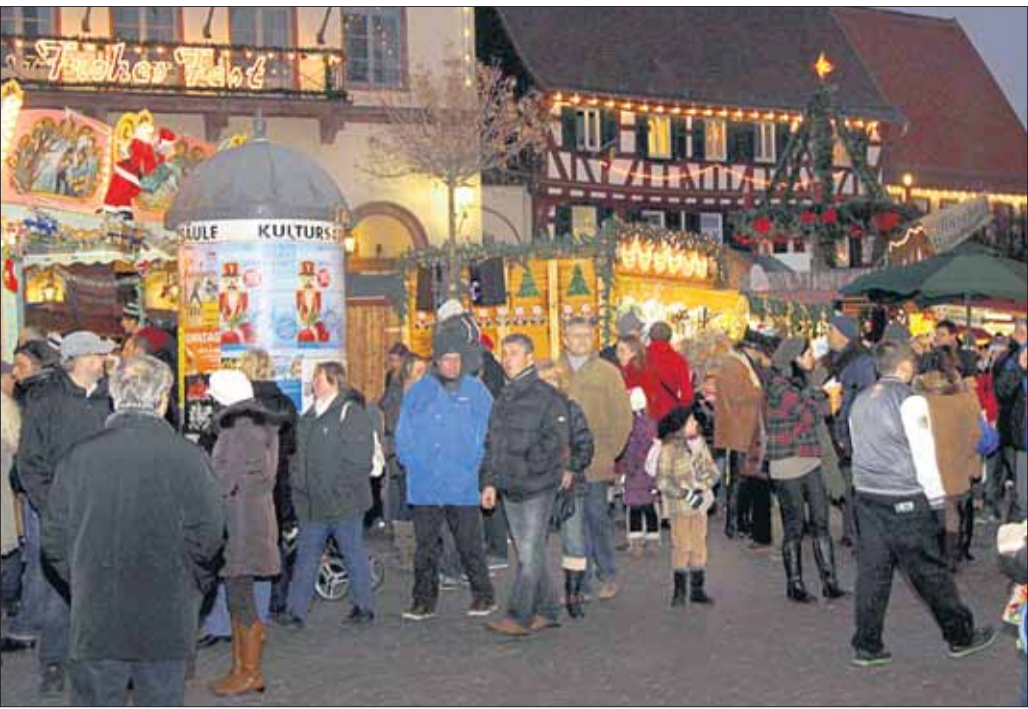
Ein Publikumsmagnet in der weiten Region: Der Budenzauber auf dem Marktplatz.