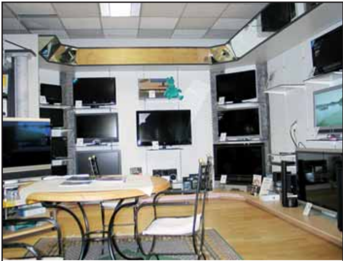
Elektrohaus Baier, Walinusstr. 27 63500 Seligenstadt, Tel. 06182 / 34 70