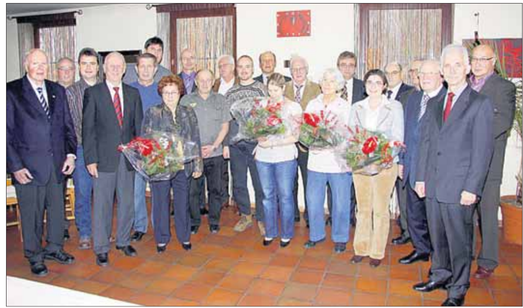
Zu hohen Ehren kamen diese treuen Mitglieder der Sportfreunde.