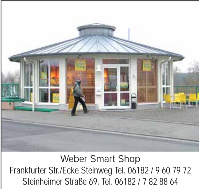
Weber Smart Shop Frankfurter Str./Ecke Steinweg Tel. 06182 / 9 60 79 72 Steinheimer Straße 69, Tel. 06182 / 7 82 88 64