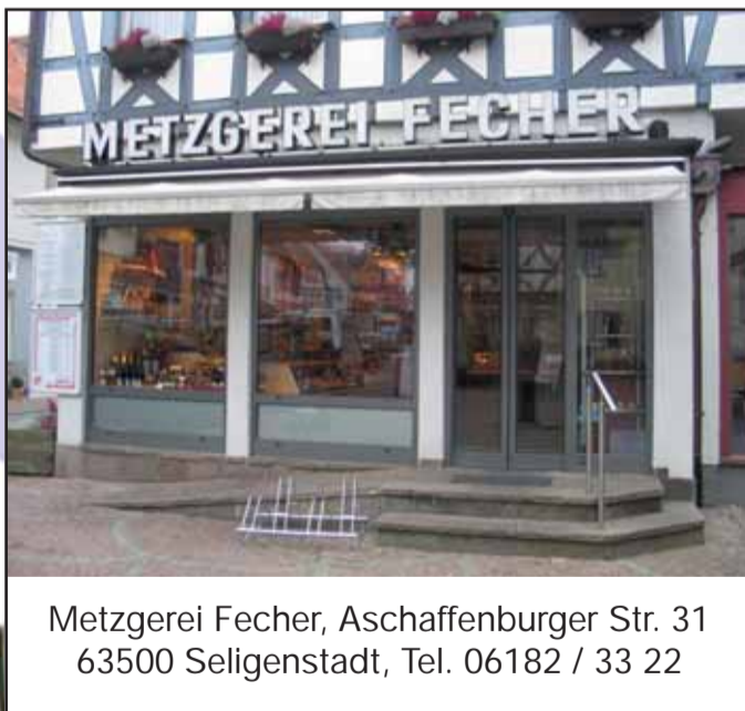
Metzgerei Fecher, Aschaffener Str. 31 63500 Seligenstadt, Tel. 06182 / 33 22