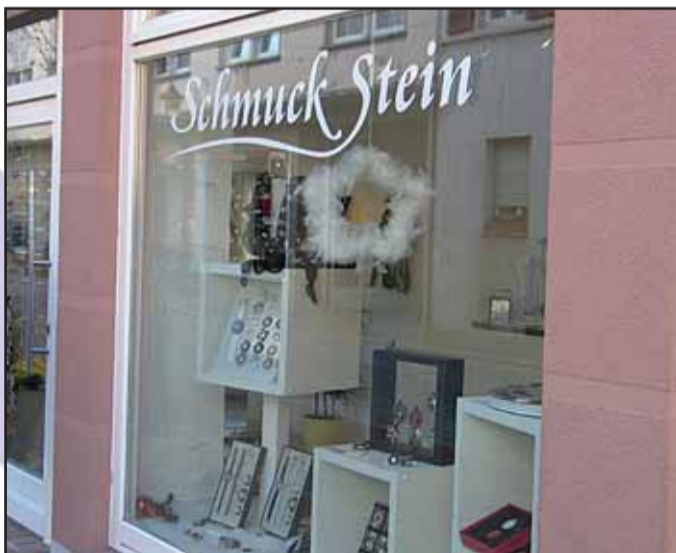
Schmuck Stein, Bahnhofstraße 6 63500 Seligenstadt, Tel. 06182 / 6 40 83 00