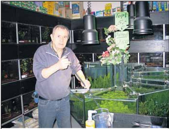
Zoo Twarden, Einhardstr. 3 63500 Seligenstadt, Tel. 06182 / 2 40 44