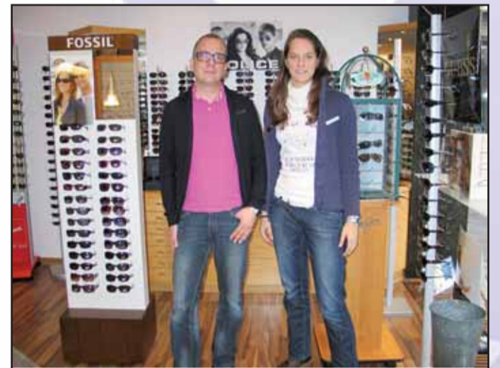
Schwind Sehen + Hören, Frankfurter Str. 19, 63500 Seligenstadt, Tel. 06182 / 82 94 30