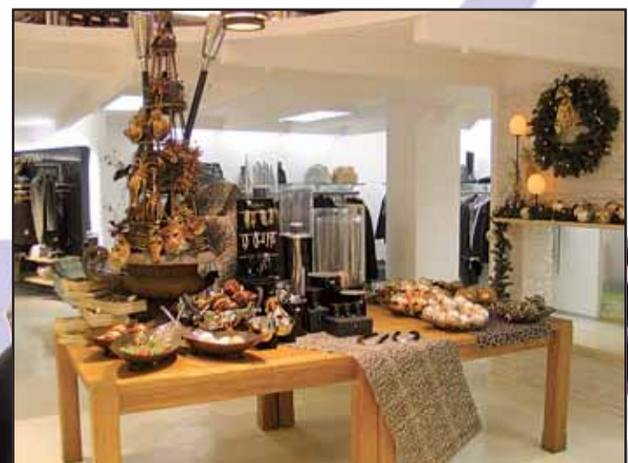
Seligenstädter Kaufhaus Mittl, Freihofstraße 2, 63500 Seligenstadt, Tel. 06182 / 9 33 40