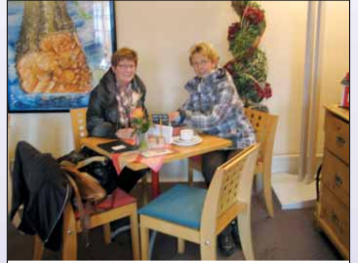
Förderkreis Lichtblick Klostercafé, Klosterhof 2, 63500 Seligenstadt, Tel. 06182 / 89 83 60