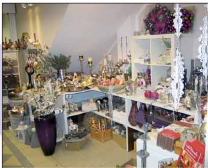
Link Ihr Treffpunkt Zuhause, Freihofstraße 1, 63500 Seligenstadt, Tel. 06182 / 33 01