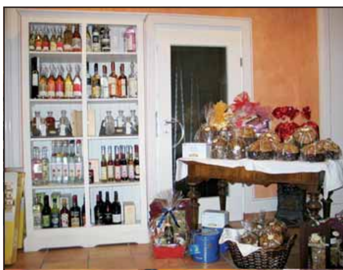
Barletta Feinkost & Vinothek, Marktplatz 763500 Seligenstadt · Telefon 0 61 82 / 78 24 62