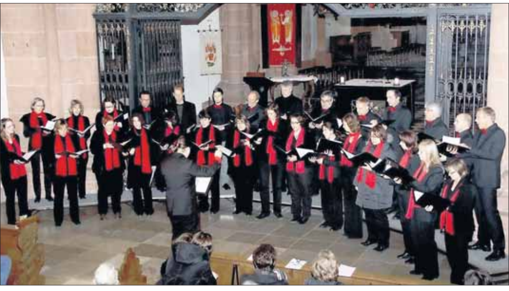
An den Adventssamstagen ist in der Basilika die „Musik zum Advent“. Jeden Samstag um 11.30 erklingt eine halbe Stunde lang adventliche Musik, die Gelegenheit bieten will, sich auf den Gedanken und Sinn des Advents zu besinnen: die Vorbereitung auf die Geburt Jesu Christi. Am vergangenen Samstag präsentierte LaCapella vom Liederkranz Zellhausen weihnachtliche Lieder.