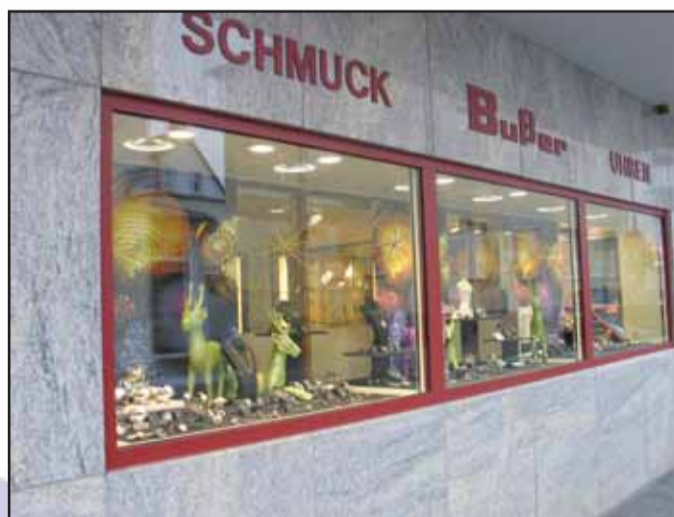
Busser Uhren Schmuck, Bahnhofstr. 16, 63500 Seligenstadt, Tel. 06182 / 34 25