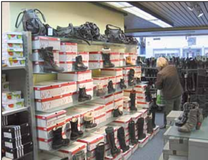
Quick-Schuhe, Aschaffener Str. 2 63500 Seligenstadt, Tel. 06182 / 2 22 67