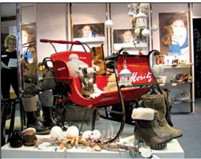
Schuhhaus Franz, Aschaffener Str. 17 63500 Seligenstadt, Tel. 06182 / 2 24 11