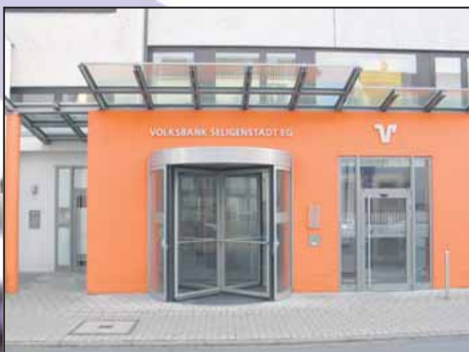
VOLKSBANK SELIGENSTADT EG, Bahnhofstraße 24, 63500 Seligenstadt, Tel. 06182 / 8 90 50