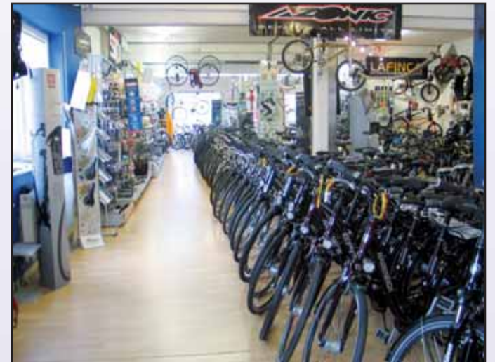
Radsport König, Ferdinand-Porsche-Str. 16a 63500 Seligenstadt, Tel. 06182 / 89 94 94