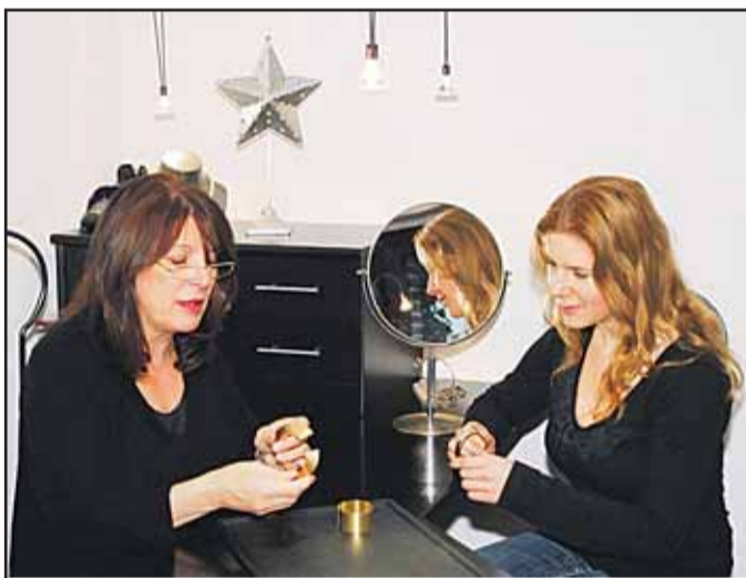
Schmuckatelier Irina Esser, Palatiumstraße 14, 63500 Seligenstadt, Tel. 06182 / 2 86 38