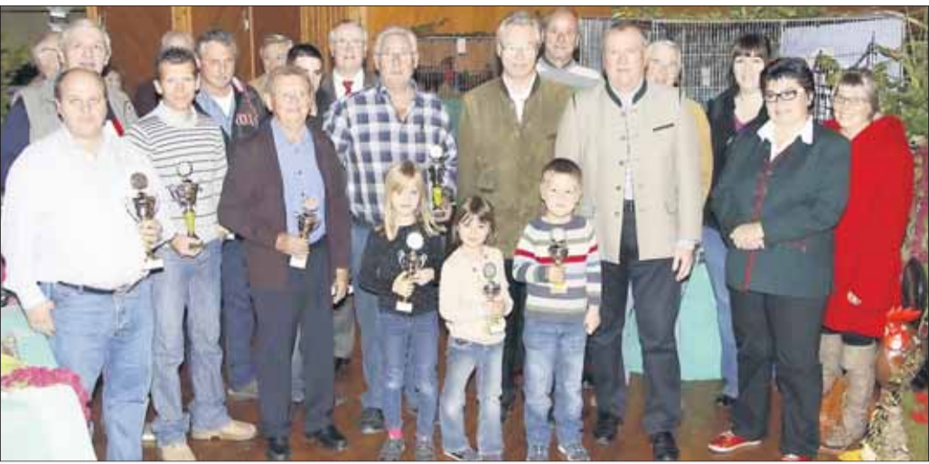
Gratulation für diese Pokalgewinner unter den Froschhausener Geflügelzüchtern.