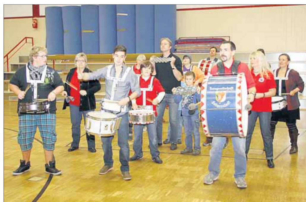
Das Musikcorps der TGS freute sich über Musikinteressierte jeden Alters beim Tag der offenen Tür am vergangenen Sonntag in der TGS-Halle. Vier verschiedene Ensembles des Seligenstädter Musikcorps stellten die gesamte Palette der Musikstile vor: Das Blasorchester die konzertante Bläsermusik, das Jugendorchester das Einsteigerrepertoire, die neue Bigband Rock, Jazz und Swing und die Percussionsgruppe schwungvolle Sambarhythmen. Bei einer umfangreichen Instrumentenausstellung verschiedener Hersteller und eines Musikhauses gab es Gelegenheit, ausgewählte Modelle nebst Unterrichtsmaterial in Augenschein zu nehmen und sich fachkundig beraten zu lassen. Die Musikwerkstatt Seligenstadt, Kooperationspartner des Musikcorps, gewährte Einblicke in alle Aspekte der zeitgemäßen Musikpädagogik.

stark und überlegen bewundert, andererseits unterschiedlichste Ängste auf es projiziert. Gring, der bereits zahlreiche Stücke für Märchenfestspiele geschrieben und inszeniert hat, wird zur Illustration seines Vortrages im Pfarrsaal Filmsequenzen aus Hanauer Produktionen von „Der Wolf und die sieben Geißlein“ sowie „Rotkäppchen“ zeigen. Die Vernissage wird von den Spielern „Auf der Schanz“ mit mittelalterlicher Musik begleitet. Der Eintritt ist frei. Die Buchschau mit Neuausgaben und einem reichhaltigen Angebot an religiöser Literatur ist am Samstag, 5. November, von 15 bis 18 Uhr zu sehen. Am Sonntag, 6. November, hat die Ausstellung im Pfarrsaal von 11 bis 18 Uhr geöffnet.