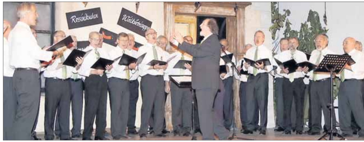
Sie brechen die Herzen der stolzesten Frauen, die stimmstarken, charmanten Germania-Sänger.