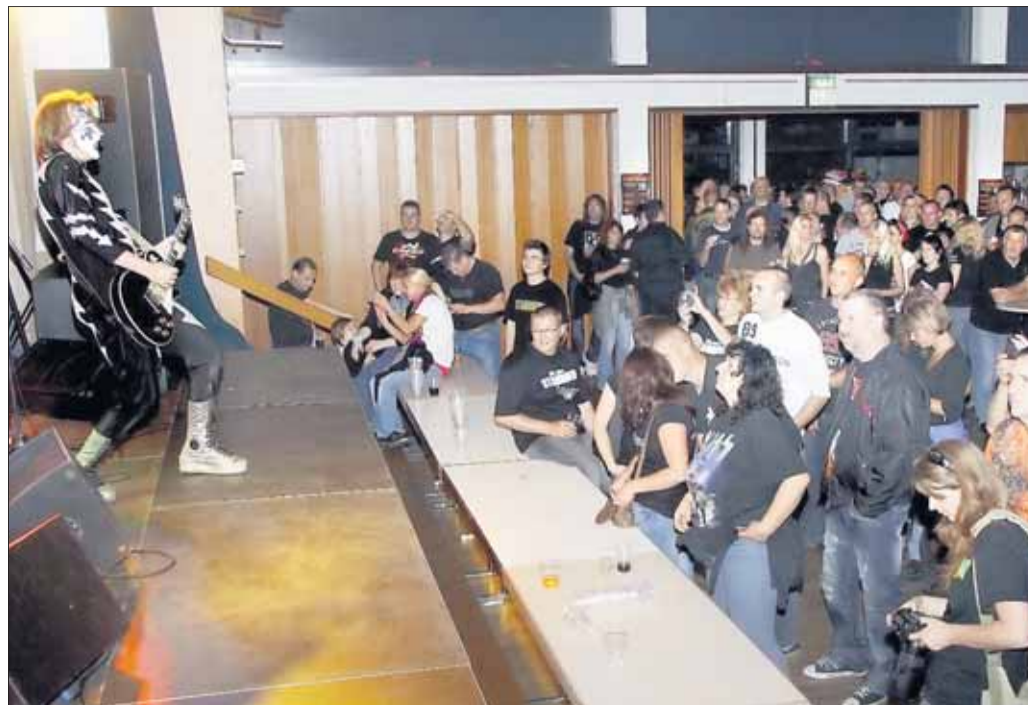
Eine Rocknacht bot die Kapelle der FFW am vergangenen Samstag im Bürgerhaus Mainflingen. Gefeiert wurde „250 Jahre Stammheim“. Als Gäste waren dabei die Böhse-Onkelz Coverband „Live Tioz“ und „Kissing-Time“, die der Gruppe „KISS“ Tribut zollten. Mittlerweile gehört „Live Tioz“ zu einer der besten Onkelz-Coverbands und sind fast ein Muss für echte Onkelz-Fans. „Kissing-Time“ sehen aus wie Kiss, klingen wie Kiss und machen eine Mega-Show, die vom Original kaum zu unterscheiden ist, staunten die begeisterten Fans.