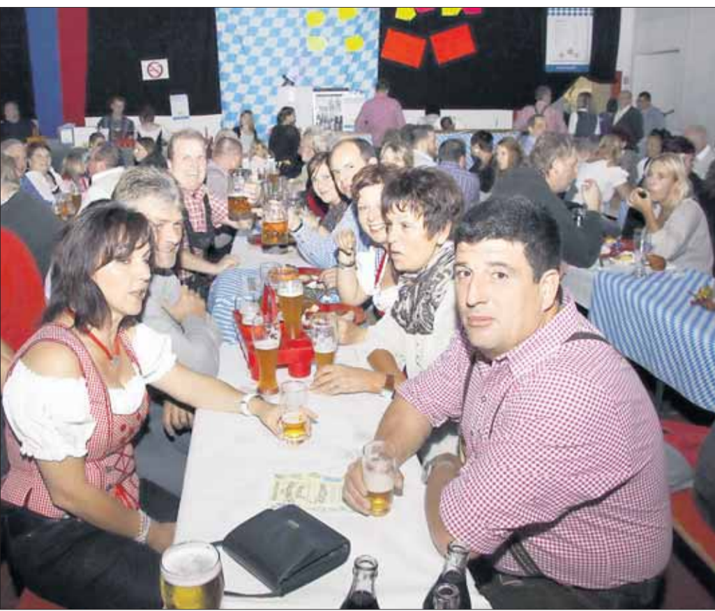
Ein rauschendes Oktoberfest feierte die Feuerwehr in Zellhausen mit Musik der Neuberger Buam und rustikalen Schmankerln aus der Vereinsküche. So gab es vom Obazda, über Haxen und Weißwurst noch weitere typisch bayrische Spezialitäten. Als Höhepunkt boten die Brandschützer wieder das Spanferkel vom Holzkohlengrill an, welches reissenden Absatz fand.