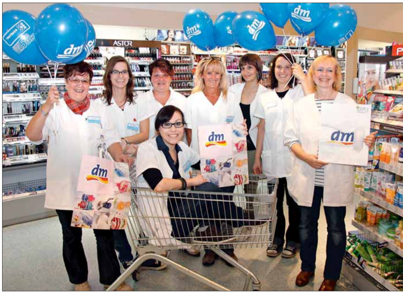
Das dm-Team in Seligenstadt freut sich auf zahlreiche Gäste zum fünften Geburtstag des Marktes in der Willi-Brehm-Straße.

ratung und vielfältigen Service – das bietet der dm-Markt in der Willi-Brehm-Straße 5. Kunden finden hier ein breites Sortiment mit insgesamt 12.500 Drogerieartikeln aus den Bereichen Baby, Düfte, Foto, Gesundheit, Gesicht- und Körperpflege, Kosmetik, Haushalt und Hygiene sowie Tiernahrung und Bio-Lebensmittel. Neben bekannten Markenartikeln gibt es in den dm-Regalen 22 dm-eigene Marken wie babylove, Balea oder alverde NATURKOSMETIK, die nicht nur qualitativ hochwertig sind, sondern auch rund 30 Prozent günstiger als die parallel angebotenen Markenprodukte. Blaue Winker an den Regalen weisen auf die Qua-