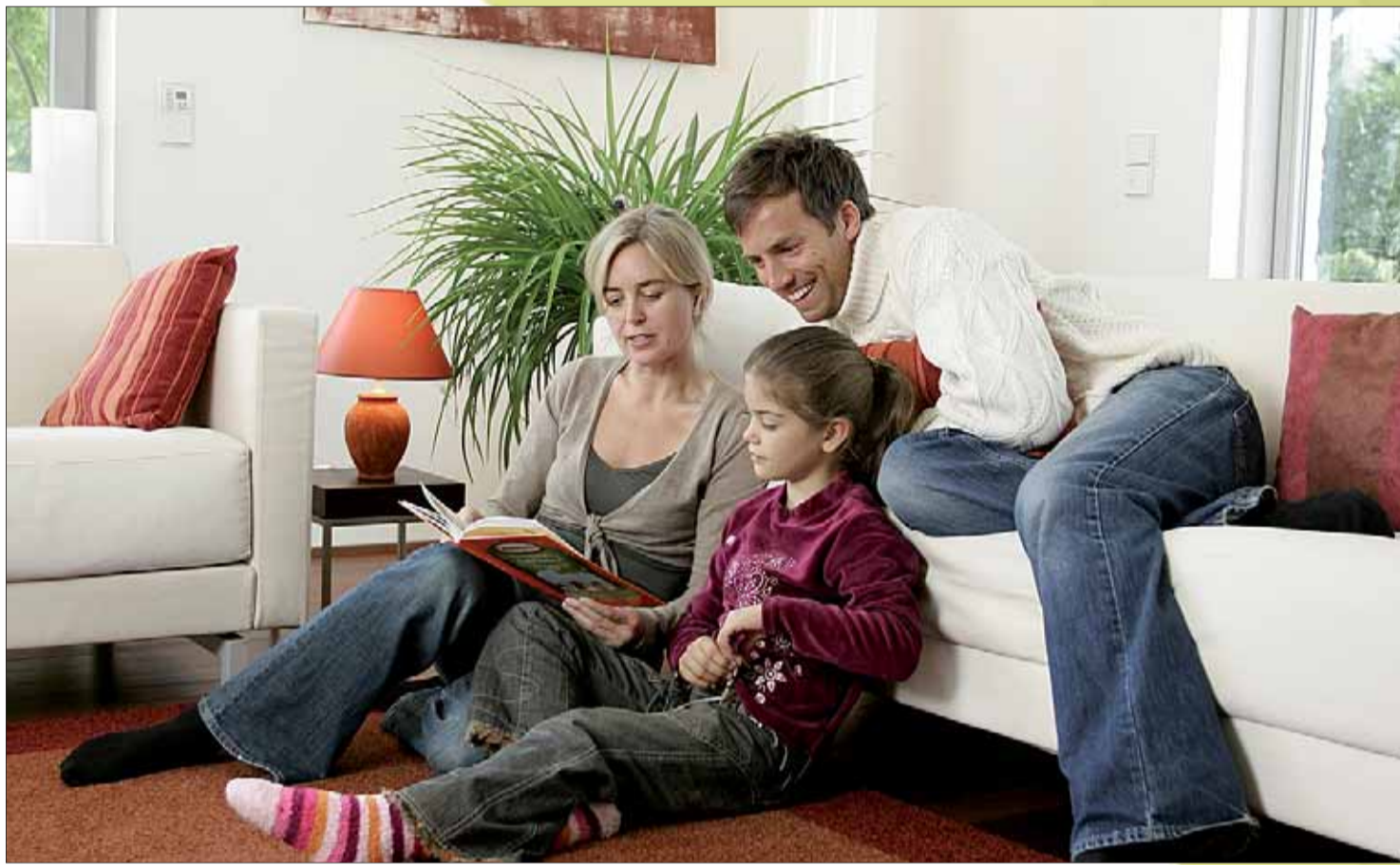
ips/Bo. Ein Teppichboden bringt Behaglichkeit ins Wohnzimmer.

genehmes Raumklima wichtig. Beim Wohnzimmerteppich entscheiden sich daher viele für Naturfasern wie Jute, Kokos oder Sisal. Diese Beläge bestehen zu 100 Prozent aus natürlichen Rohstoffen, sind schadstoffgeprüft und regulieren zudem die Luftfeuchtigkeit. Bei der Teppichverlegung ist die lose Verlegung besonders einfach. Dabei wird der Teppich auf dem Boden ausgerollt und an den Rändern mit doppelseitigem Klebeband fixiert. Bei der vollflächigen Verlegung werden Teppich und Boden mit Estrich fest miteinander verbunden.