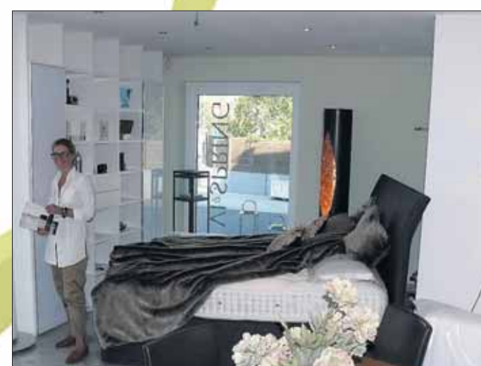
Individuelle Beratung und maßgeschneiderter Service rund um Schrank-Ideen und „BoxSpring Betten“ der Firma VI-SPRING.

In den Ausstellungsräumen auf drei Etagen werden verschiedene Gleittüren und Einbauschränke der Firma CABINET, exklusive Boxspring Betten der Firma Vi Spring, diverse Beleuchtungslösungen namhafter Hersteller und diverse Wohnraum-möbel präsentiert.