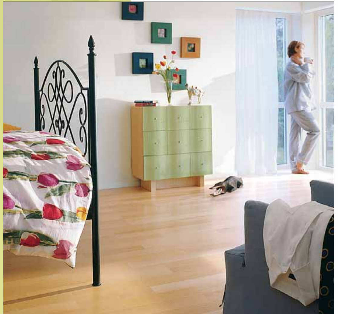
Ips/Bo. Farben und Accessoires verändern Räume.

Ips/Bo. Außergewöhnliche Stile prägen die aktuellen Einrichtungstrends. Opulente Sofas mit Kissensbergen, kräftigen saften Farben und aufwändig restauriertem Mobiliar stehen beispielsweise für den Hang zu einer neuen Üppigkeit. Liebhaber exotischer Motive und sanfter Naturtöne finden sich hingegen eher im Ethno-Stil wieder. Trendfarben wie Terra und Gelb schaffen wiederum eine mediterrane Atmosphäre. Allen gemein ist: Meist reichen schon kleine Veränderungen aus, um dem eigenen Zuhause ein trendiges Outfit zu verleihen. Dezentle Möbel in Naturtönen sind die Basis für ein mediterranes Flair. Durch zusätzliche Accessoires wie Bilder, Schalen, Vasen, Leuchten und die Fensterdekoration erhält ein Raum seinen unverwechselbaren Charakter. Ein schöner Teppich in warmen Farben, passende Kissen und stimmungsvolle Leuchten setzen im Wohnzimmer neue Akzente. Zimmerpalmen, dekorative Kräuter wie Lavendel und Rosmarin in rustikalen Töpfen sowie Schalen, Zapfen und Figuren aus Terrakotta unterstreichen das Mittelmeerfeeling. Figuren, Masken und Bilder mit afrikanischen Motiven sind dagegen typisch für den Ethno-Stil. Kissens in Naturtönen und Gold so-