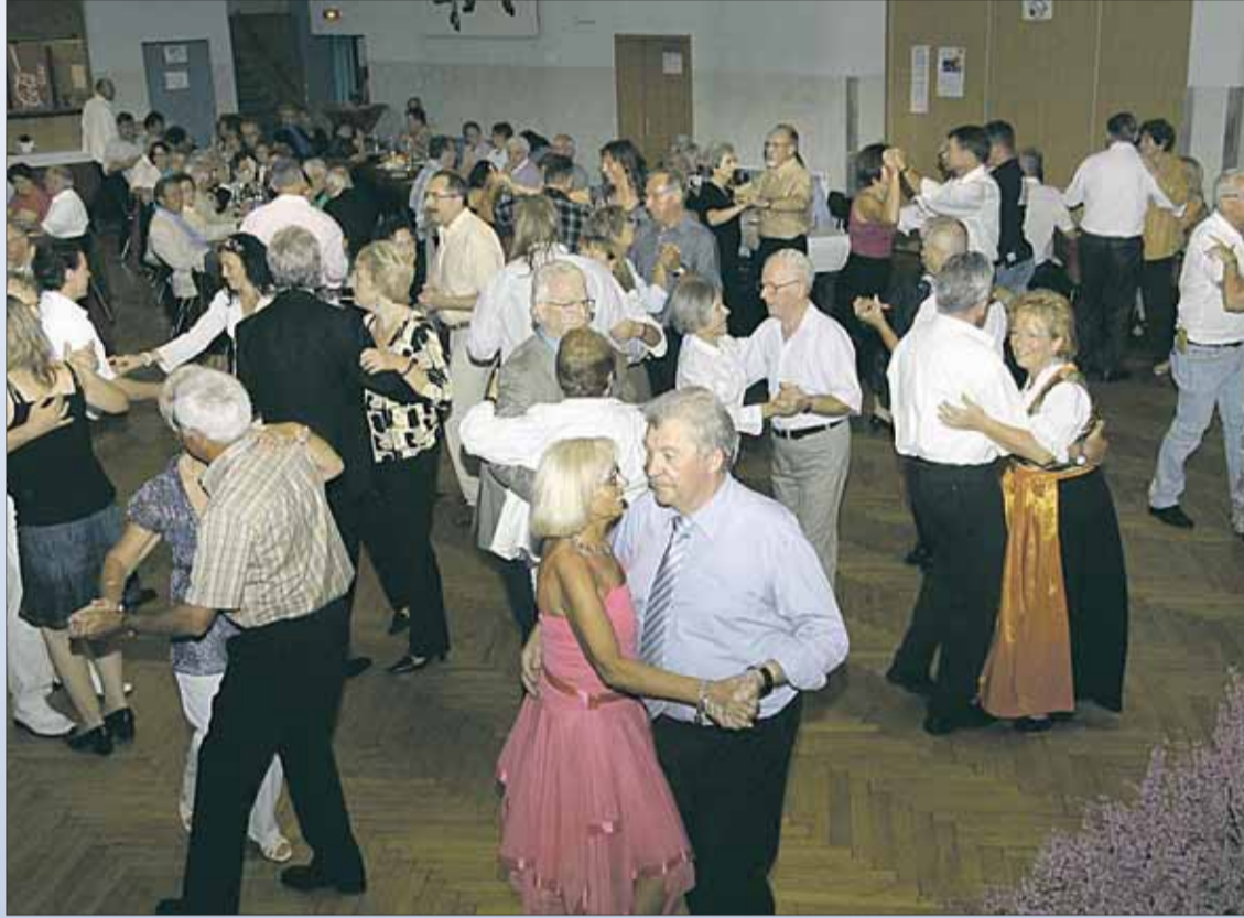
Mit ihrem Tanzabend füllt die Hainstädter Harmonie eine „Veranstaltungslücke“.

Hainstadt – Von Fred Astaire stammt das Zitat: „Tanz ist ein Telegramm an die Erde mit der Bitte um Aufhebung der Schwerkraft“. Bei der Veranstaltung am vergangenen Wochenende in der Sporthalle Hainstadt wurden Hunderte solcher Telegramme abgeschickt, denn die Tanzfläche hätte die Belastung nicht ausgehalten ohne die Schwerkraft aufzuheben. Der Gesangverein Harmonie Hainstadt traf mit dieser Veranstaltung direkt „ins Schwarze“. Viele Besucher waren der Einladung gefolgt und ließen sich mit der Kapelle „Sunshine“