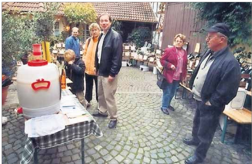
Der herbstliche Wein- und Federweiser-Markt im Rebenhof Rack in der Ortsmitte von Alzenau-Albstadt (15 Autominuten von Seligenstadt) hat mittlerweile gute Tradition. Im Zuge der alljährlichen Lagerräumung der gutseigenen Vinothek gibt es einen viel- und gern besuchten Wein-flohmarkt, zu dem das Rebenhof-Zelt geöffnet ist. Bei schönem Wetter kann man Federweiser von weißen und roten Trauben, Gutsweine und Sekt im Hof verkosten oder mit den zahlreichen Schnäppchen mit nach Hause nehmen. Dazu werden leckere Spezialitäten serviert. Von heute bis einschließlich kommenden Sonntag sind Zelt und Weinstube täglich ab 14 Uhr geöffnet.