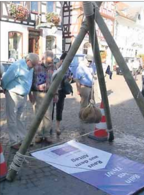
Mit Dreibock und Sandsack, hier auf dem Seligenstädter Marktplatz, finden sich Elemente in der neuen THW-Wetterstation, die im oft zum Einsatz kommen.