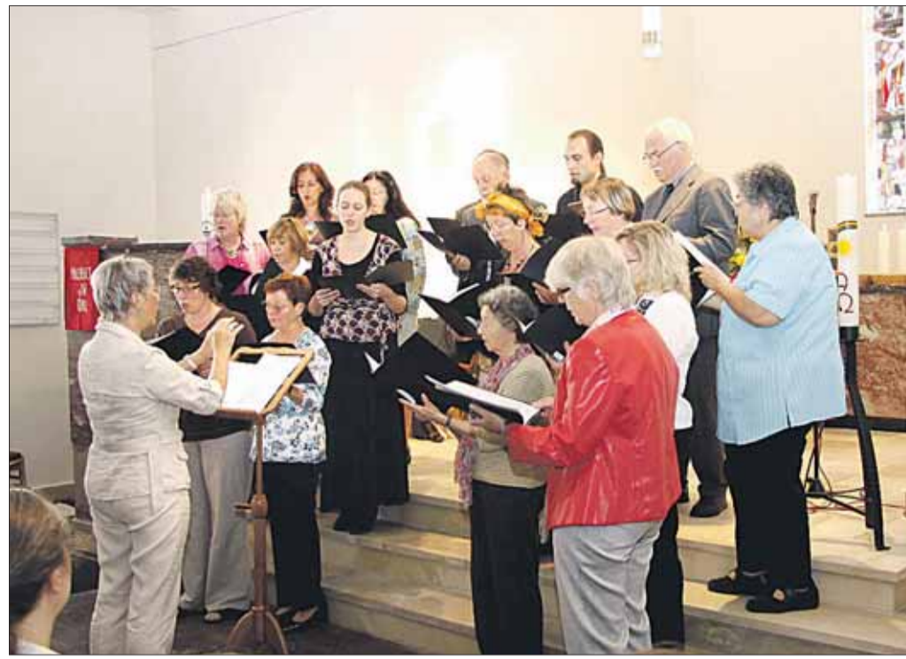
Der feierliche Gottesdienst zur Wiedereinweihung der evangelischen Kirche in Klein-Krotzenburg wurde mit der Aktion „eins mehr“ für die Haltestelle Seligenstadt begangen. Die gelungene Renovierung des Gotteshauses wurde anschließend im Kirchgarten gefeiert. Eine Aufführung der Kita-Kinder fand begeisterten Applaus und für alle Kinder gab es noch weiteres Programm.

zum Einsatz, welche einen lauten und aufregenden Beitrag garantierten. Die Veranstalter waren gar nicht sicher, ob dieses Stück aufgrund der Lautstärke und aufregenden Musik überhaupt für eine Seniorenwohnanlage geeignet ist. Der anschließende Beifall lehrte eines besseren. Einige Senioren konnten schon während dem Vortrag nicht mehr auf den Stühlen sitzen und schlangen die Hände im Takt der Musik. Informationen im Internet: www.notengarten-hainburg.de und 06182/8410008.