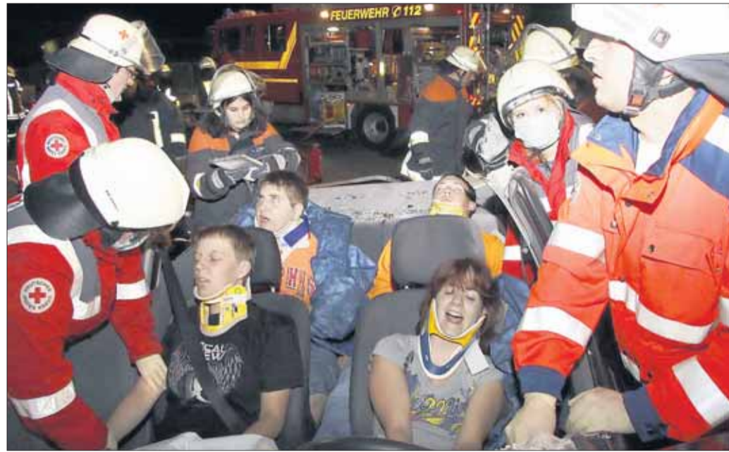
Ein realistisches Szenario prägte die gemeinsame Übung der Feuerwehren.

Seligenstadt – Verkehrsunfall mit mehreren Fahrzeugen vermutlich Gefahrgutaustritt lautete die Alarmierung am Donnerstagabend zur zweiten gemeinsamen Übung der Seligenstädter Feuerwehren in diesem Jahr. In der Ferdinand-Porsche-Straße stellte sich den Einsatzkräften folgende Lage dar. Ein mit brennbaren Flüssigkeiten bestückter Tankwagen, kollidierte mit drei Kraftfahrzeugen. In den Fahrzeugen befanden sich insgesamt 12 Personen, die von Puppen und Jugendlichen der DLRG Seligenstadt simuliert wurden. Aus dem Tank des Lastkraftwagens lief eine brennbare Flüssigkeit aus. Um diese auf zu fangen, mussten aufwändige Maßnahmen unter einem Chemikalienschutzanzug durchgeführt werden. Kanäle abdichten, Leckagen zu schließen Stoff analy-