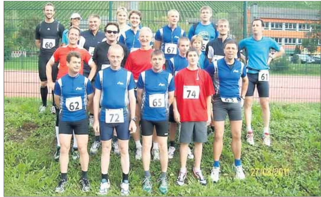
Die Feuerwehr Hainstadt wurde beim Feuerwehr Lauf-Cup zum zehnten Mal in Folge Deutscher Meister und erstmals schnellste Freiwillige Feuerwehr über 10 000 Meter.

Auflagen der Naturschutzbehörden („Wir erfüllen alle Maßgaben, werden kontrolliert und halten uns an die Gesetze“) hat der Motorsport in Klein-Krotzenburg auf der Grasbahn eine schöne und lange Tradition. Die nicht sterben sollte.