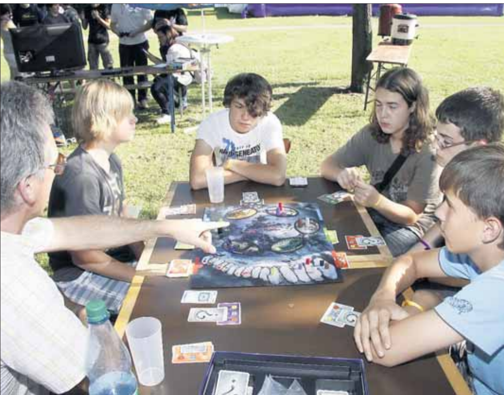
Den ersten ökumenischen Jugendtag „up2date“ gab es im katholischen Gemeindezentrum von St. Marien, dem evangelischen Gemeindezentrum Seligenstadt und drumherum. Es war ein buntes Fest mit einem Markt, Workshops, Musik und Gottesdienst. Der Vorbereitungsprozess bestand aus ehren- und hauptamtlichen Mitarbeiterinnen und Mitarbeiter der kirchlichen Jugendarbeit - freute sich über die Beteiligung von vielen unterschiedlichen Gruppen.

Gruppen aus Nieder-Roden und Mühlheim wurden mit dem Nachhaltigkeitspreis des Jugendtages ausgezeichnet, da sie mit öffentlichen Verkehrsmitteln angereist waren. Das Bühnenprogramm am Samstag endete am Abend mit einem Konzert der Bands „Bliss“, „Most wanted“ und „Gedankenlärm“ (ehemals „Simon rocks“). Veranstalter des ökumenischen Jugendtages up2date mit dem Motto „Ein Date, zwei Konfessionen, viele nette Leute, Begegnungen mit Gott und der Welt“ waren die Katholische Jugendzentrale Offenbach-Land/BDKJ in den Dekanaten Rodgau und Seligenstadt und die Evangelische Jugend im Dekanat Rodgau.