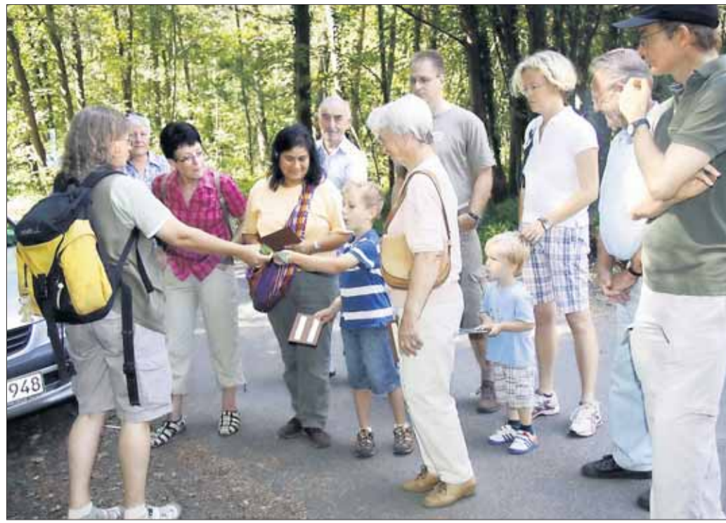
Bäume regen seit jeher die Fantasie der Menschen an und spielen in vielen Märchen eine wichtige Rolle. Deshalb bot das Forstamt Langen im Rahmen des „Internationalen Jahres der Wälder, eine „Baummärchenwanderung“ in Hainburg in der Nähe der Liebfrauenheide an. Dabei wurden einzelne Baumarten vorgestellt und durch die mit ihnen verbundenen Geschichten und Märchen erfuhren die Wanderer etwas über ihre charakteristische Gestalt und Art.

Rock'n Roll Show des Bad Homburger Rock'n Roll Tanzentrums setzt dem ganzen die Krone auf und wird zum echten Höhepunkt der Veranstaltung. Was für die Engel das Fliegen, ist für die Menschen das Tanzen. Der Verein lädt ganz herzlich ein, den Monat Oktober vielleicht als Engel zu beginnen. Sie sollten sich rechtzeitig Karten für diese Veranstaltung am 01. Oktober 2011 in der Sporthalle Hainstadt sichern. Karten sind im Vorverkauf zum Preis von 10 Euro, inkl. Sektempfang, ab 29. August bei Lotto Griehl, sowie in der Postagentur erhältlich.