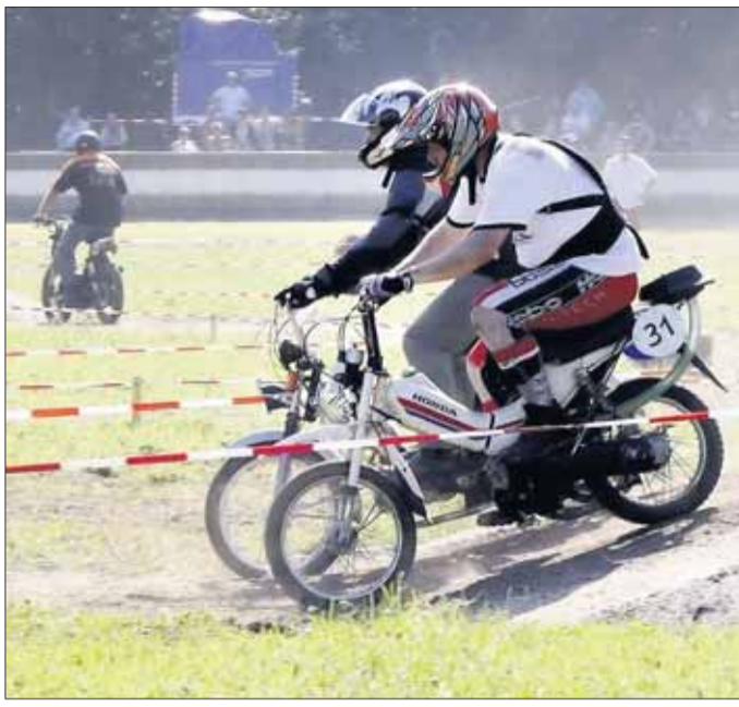
Geschicklichkeit auf der Grasbahn.

Hainburg (th) - Das legendäre Grasbahnrennen des Motorsportclubs Klein-Krotzenburg ist tot - es lebe das Grasbahnrennen! 50 Mal wurde Jahr für Jahr auf dem Gelände der Motorsportfreunde um den „Goldenen Fasanen“ gekämpft, 50 Jahre lang kamen Motorrad- und Gespannfahrer nach Hainburg, um sich auf der Grasbahn zu messen. Der Geruch von Methanol und Benzin lag in der Luft für Freunde des Motorsports wohlriechender als jedes Parfum. In diesem Jahr ist alles anders. „Das Grasbahnrennen in der traditionellen Form wird es nicht mehr geben“, sagt der Pressewart des ausrichtenden MSC Klein-Krotzenburg, Manuel Hielscher. Der Aufwand wurde zu groß, organisatorisch konnte die Veranstaltung nicht mehr gestemmt werden. Zudem wolle man jetzt ein jüngeres Publikum ansprechen. Heißt: Das „1. MSC Open Race“ ist geboren und lockt am vergangenen