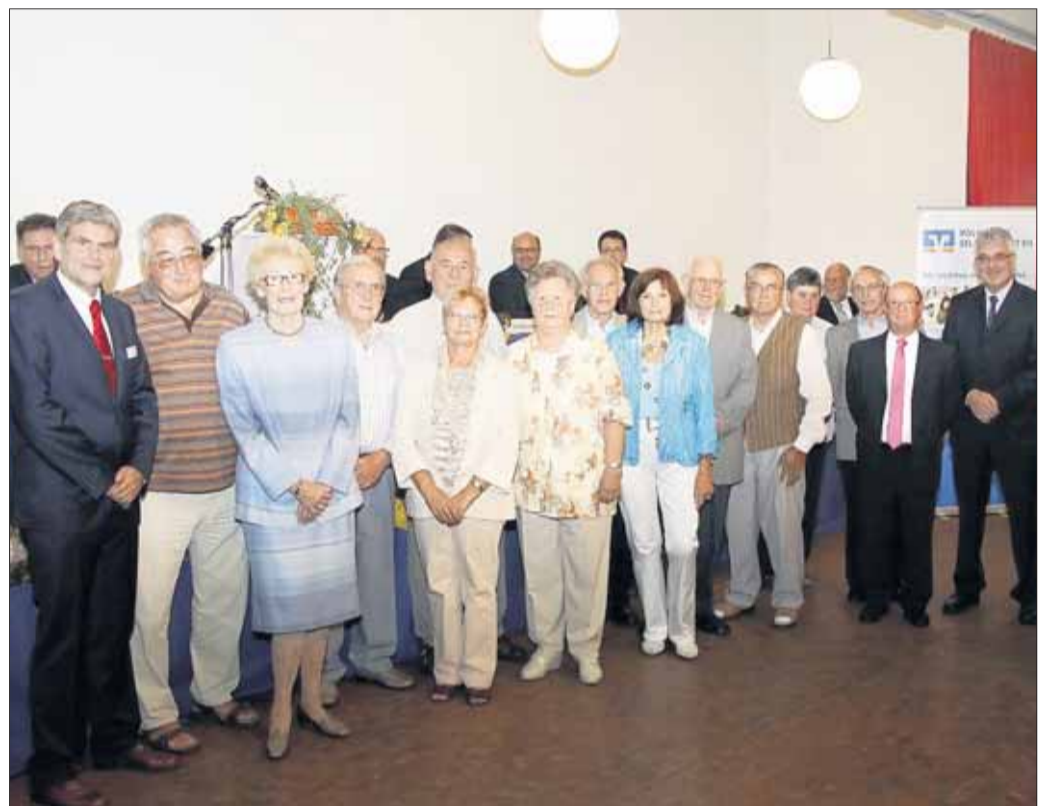
Zahlreiche Jubilare, die bereits seit 40 und 50 Jahren treue Mitglieder der Seligenstädter Genossenschaft sind, wurden am Ende des offiziellen Teils der Generalversammlung der Volksbank Seligenstadt vom Vorstand ausgezeichnet.

Nur „wenig Unterschiede zwischen den Konfessionen“ festgestellt: