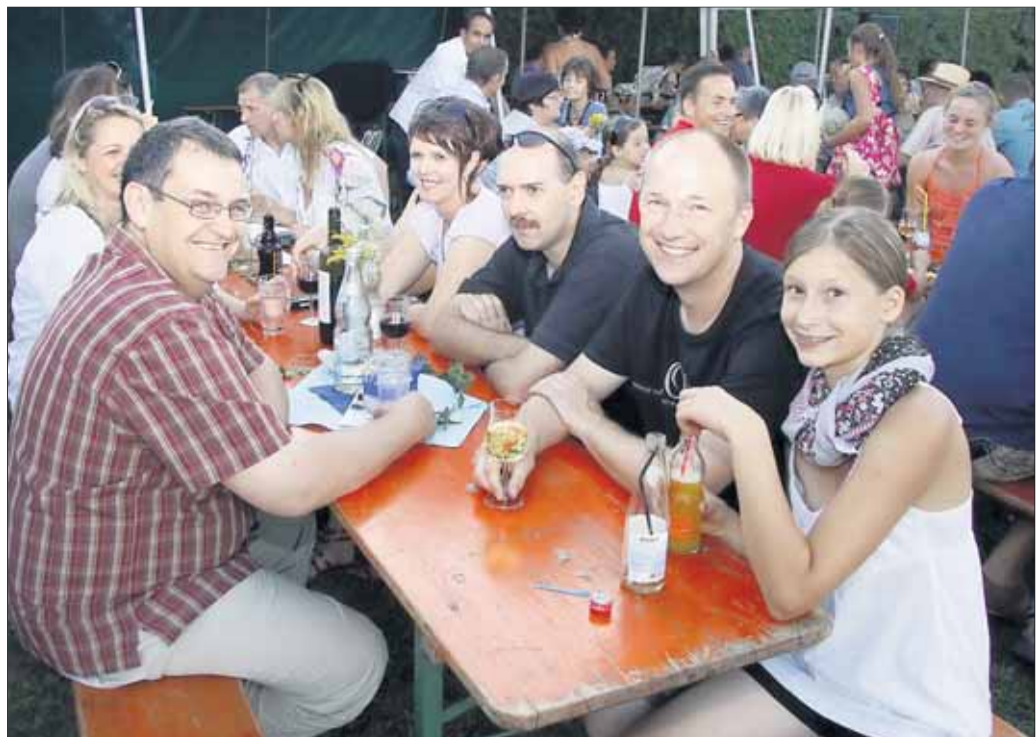
Ihr gut besuchtes Sommer-Wein-Fest feierte die Turngemeinde Zellhausen (TGZ) am vergangenen Wochenende hinter der Turnhalle an der Mainflinger Straße. Das Programm begann mit einer Leichtathletik-Olympiade und „Rope-Skiping“. Am abend traten die Hessenmeisterinnen in Step-Aerobic auf. Am Sonntag gab es Ständchen des Liederkranz-Kinderchores, es folgten Jazzdance, Step-Aerobic und Tischtennis zum Mitmachen.

Menschen bei zahlreichen Veranstaltungen der Schule, der auf das Schulleben ausstrahlt.“ Gemütlich, engagiert, sportlich und musikalisch ging denn das Fördervereinsfest zu Ende: Bei Apotheker Ochmann gab's den letzten BMI-Test, nochmal ein Besuch beim Bücherflohmarkt der beiden Referendarinnen oder bei der „Kunst in der Cafeteria“, einen Blick auf die 3D-Animation der Kreuzburgschule im Raum des Medienkurses, die Artikel aus drei Jahrzehnten Förderverein angeschaut und schnell die letzten Tombola-Gewinne - übrigens gestiftet von Mc Neill - abholten. Die Verantwortlichen dürften zufrieden gewesen sein mit dem 30. Geburtstag. Die Kreuzburgschule bereitet sich derweil vor auf den Tag der offenen Tür unter dem Motto „Offene KBS“ am Samstag, 5. November.