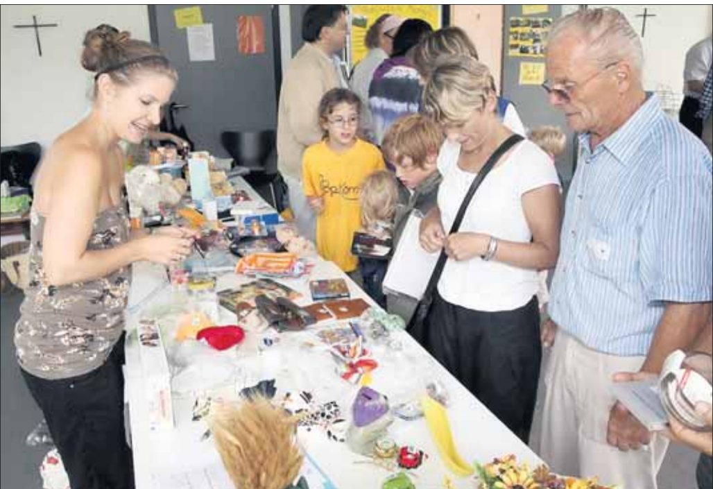
Ein gelungenes Gemeindefest feierten die Gläubigen der katholischen Pfarrgemeinde St. Marien Seligenstadt am vergangenen Sonntag nach dem Motto: „Gott begegnen - Menschen treffen“. Das Fest begann mit der Eucharistiefeyer Die Stadtkapelle sorgte für den musikalischen Hörgenuss.

Basilika feiert am Sonntag um 10 Uhr das Kirchweihfest: