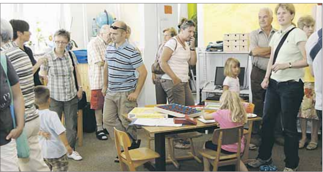
Es gab für die Freie Schule Seligenstadt-Mainhausen drei Gründe zu feiern. Der Erste war der Kauf, die Renovierung und der Umzug in das ehemalige Grundschulgebäude in Zellhausen. Ein zweiter Grund zu feiern war die Genehmigung, die Schule bis zur Klasse 10 zu erweitern. Kurzfristig sind für die zweite Klasse noch zwei freie Plätze zu vergeben. Informationen sind telefonisch unter 06182/898151 zu erhalten. Der dritte Grund zum Feiern war der erste „Tag der offenen Tür“ in den neuen Räumlichkeiten.

wie schon in anderen Gemeinden in Deutschland, Österreich und der Schweiz, einmal im Monat donnerstags für die Erneuerung der Kirche gebetet werden. Beginn ist um 20 Uhr, im Anschluss besteht Gelegenheit zum Gespräch. Eingeladen sind alle, denen ihre Kirche am Herzen liegt und die sich für eine zeitgemäße, am Menschen orientierte Kirche einsetzen wollen. Damit Kirche in Bewegung kommt.