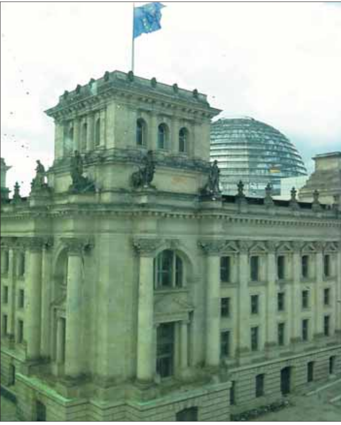
Das Berliner Reichstagsgebäude, die Kuppel und viele andere Sehenswürdigkeiten bekommen die Mainhausener zu sehen, die für Ende Oktober mit der Pfarrgemeinde einen Berlinbesuch planen.