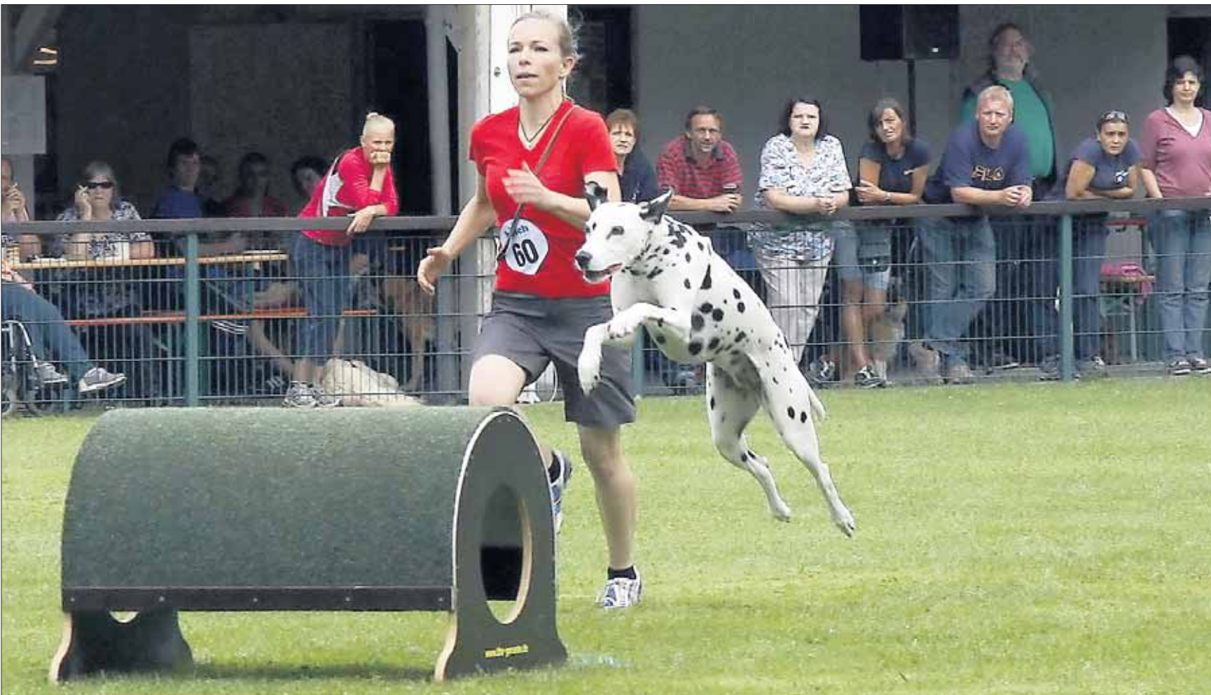
Zum Agility- und Sommerfest lud der Hundesportverein Mainflingen am vergangenen Wochenende ein auf sein Vereinsgelände am Mainweg. Die Gäste freuten sich neben dem Feiern natürlich auch über sportliche Darbietungen mit Hindernislauf und mehr.

Mainhausen (red) – Der nächste Termin für die Entsorgung von Gartenabfall am Festplatz in Mainflingen ist am Samstag, 13. August. Die Annahme übernimmt im Auftrag der Gemeinde Mainhausen die Firma Höfling. Ein Containerfahrzeug wird von 10 bis 13 Uhr auf dem Festplatz am Main stehen. Folgende Preise gelten für Kleinmengen: Speisbütt/Eimer/Sack 1,80 Euro; PKW-Kofferraum vier Euro; PKW-Kombi-Kofferraum 6,50 Euro; Klein-Anhänger zehn Euro. Diese Preise sind Brutto-Preise inklusive Mehrwertsteuer. Größere Mengen und Gebinde werden nicht angenommen. Die Aststärke darf maximal 15 Zentimeter betragen. Kleinere Wurzelstümpfe werden bis 30 Zentimeter Durchmesser angenommen.