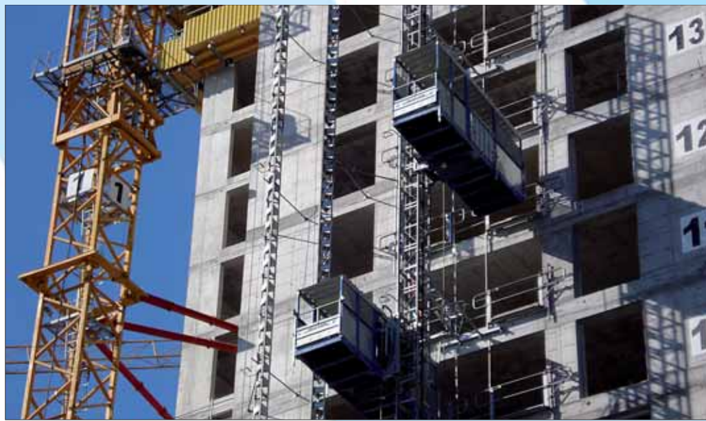
Ips/Cb. Emittenten stammen aus Industrie und Handel.

auch in „Kerneuropa“ eine Alternative zu Staatsanleihen. Wegen der höheren Renditen erwarten Finanzanalysten weiterhin ein verhältnismäßig besseres Abschneiden gegenüber Staatspapieren mit sehr guten Ratings.