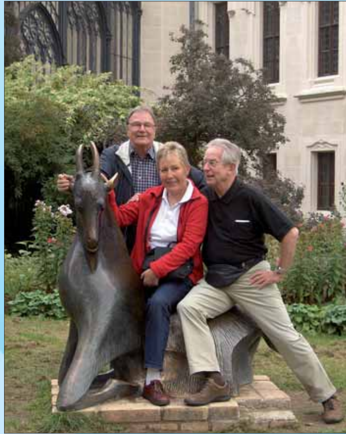
Ips/Cb. Heute an morgen denken

wirksame Anteil steigt jährlich weiter, bis er 2025 volle 100 Prozent erreicht. So investiert man in die persönliche Altersvorsorge und holt sich mit der Einkommensteuererklärung Steuererstattungen zurück. Die Basisrente garantiert eine lebenslange Altersrente. Man kann sich zwischen der klassischen und einer fondsgebundenen Variante entscheiden. Die fondsgebundene Basisrente bietet attraktivere Renditechancen. Mit Garantieplänen kann man auch die damit verbundenen Risiken absichern. Mit zunehmender Laufzeit erreicht man 100 Prozent des Guthabens zum vereinbarten Rentenbeginn. Neben den monatlichen Beiträgen können je nach Anbieter weitere Beiträge zusätzlich gezahlt werden, um die Steuererstattung Jahr für Jahr zu optimieren. Auch Einmalzahlungen sind möglich. Beiträge zur Basisrente sind Hartz-IV- und insolvenz sicher. Bei längerer Arbeitslosigkeit oder Insolvenz müssen die Beiträge nicht verwertet werden.