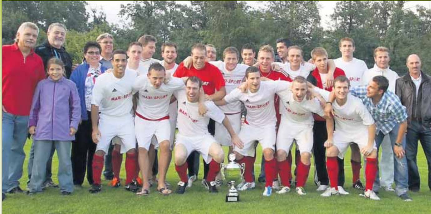
Mainpokalsieger 2011: Verbandsligist Sportfreunde Seligenstadt verteidigte erfolgreich seinen Titel und sicherte sich seinen 27. Sieg bei diesem Turnier insgesamt.