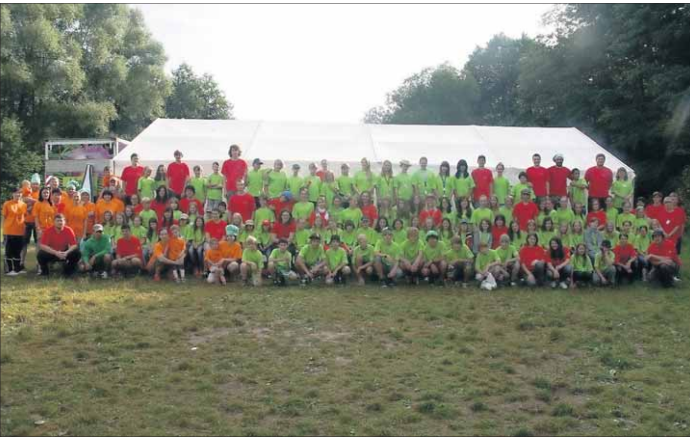
Im Zeltlager der Basilika-Pfarrei sind alle eine große Familie und für zehn Tage fühlten sich dort alle gemeinsam sehr wohl.

Basilika-Zeltlager im Oberfränkischen mit allen Wettern und viel Begeisterung: