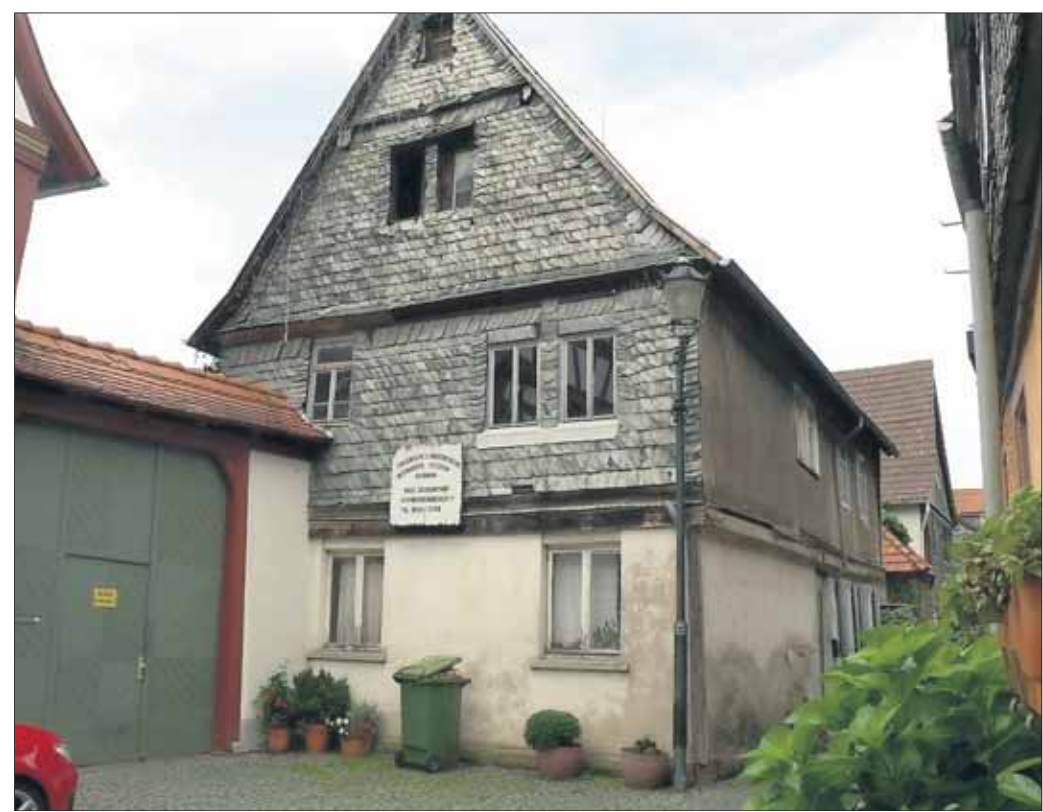
Einen erbärmlichen Anblick im Ensemble zahlreicher restaurierter Fachwerkhäuser vermittelt dieses seit langem unbewohnte Haus in der Seligenstädter Schafgasse. Es ist in der Liste der Kulturdenkmäler vermerkt. Die Restaurierung eines solchen Fachwerkhäuses ist eine sensible Angelegenheit.