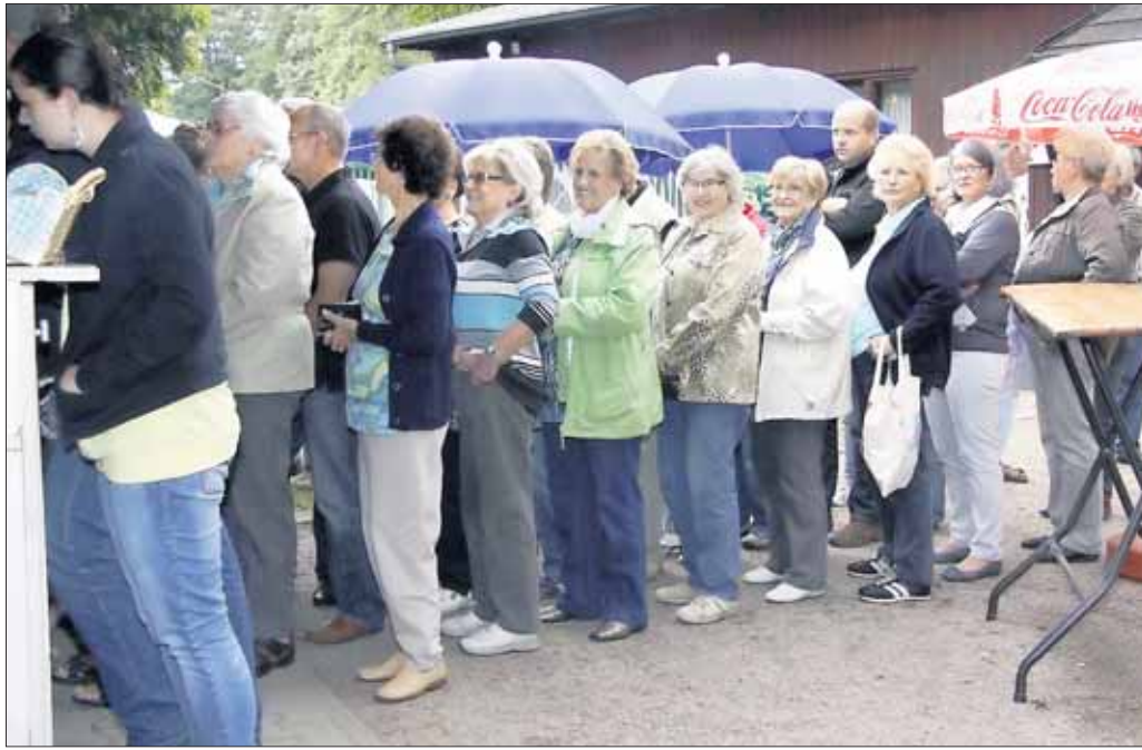
Einen Ansturm auf die gebackenen Forellen gab es zum Abschluss der kulinarischen Wochen am Glaabsweiher. Täglich bot die Vereinsküche der Klein-Welzheimer Sängervereinigung Germania wechselnde Spezialitäten an, die sich großer Beliebtheit erfreuten.

Die kulinarischen Überraschungen unterwegs lassen natürlich auf nicht auf sich warten und der Abschluss wird auf Einladung der Kolpingsfamilie mit einem gemeinsamen Eintopf-Essen auf dem Kolpinggelände stattfinden. Treffpunkt ist um 11 Uhr an der Kolpinghütte. (Auch bei schlechtem Wetter) Wer zu der gut einstündigen Wanderung mitkommen möchte, bekommt noch Karten im Vorverkauf beim „Bücherwurm“, Seligenstadt oder unter: ☎ 06182-899449, Kulinarische Wanderung: 12 Euro.