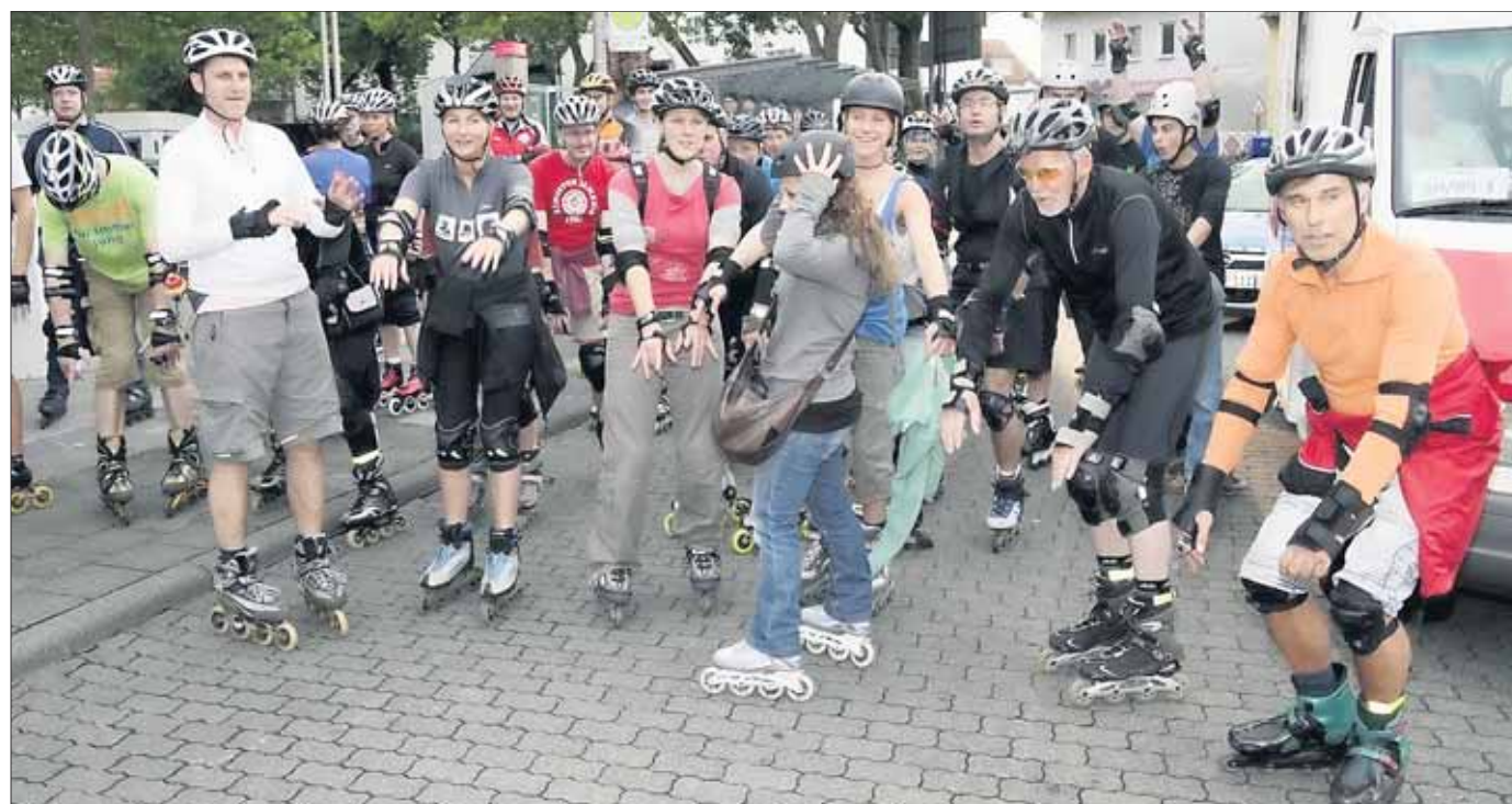
Die vierte Inline-Tour startete am vergangenen Donnerstag am Kapellenplatz. Die mittlerweile weit über die Stadtgrenzen hinaus bekannten „Seligenstädter Skate-Nights“ haben sich in den letzten Jahren einen Namen in Sachen Innovation, Freundlichkeit und Steckenführung gemacht. Dieses Mal führte die Strecke vom Kapellenplatz aus über die Babenhäuser Straße und Würzburger Straße nach Klein-Welzheim. Von dort geht es nach Mainflingen und über die Brüder-Grimm-Straße bis nach Zellhausen. Über die Ringstraße und den Mainring ging es zurück nach Seligenstadt. Über die Würzburger Straße, die Einhardstraße, Wolfstraße gelangten die Skater zum Freihofplatz, wo nach 14 Kilometer zur Stärkung eine Pause eingelegt wurde. Weiter ging es nach Klein-Krotzenburg und zurück nach Seligenstadt.

Der Jahrgang 1959/60 Seligenstadt trifft sich am Mittwoch, 10. August, ab 18 Uhr an der Edelweißhütte zum gemütlichen Beisammensein.