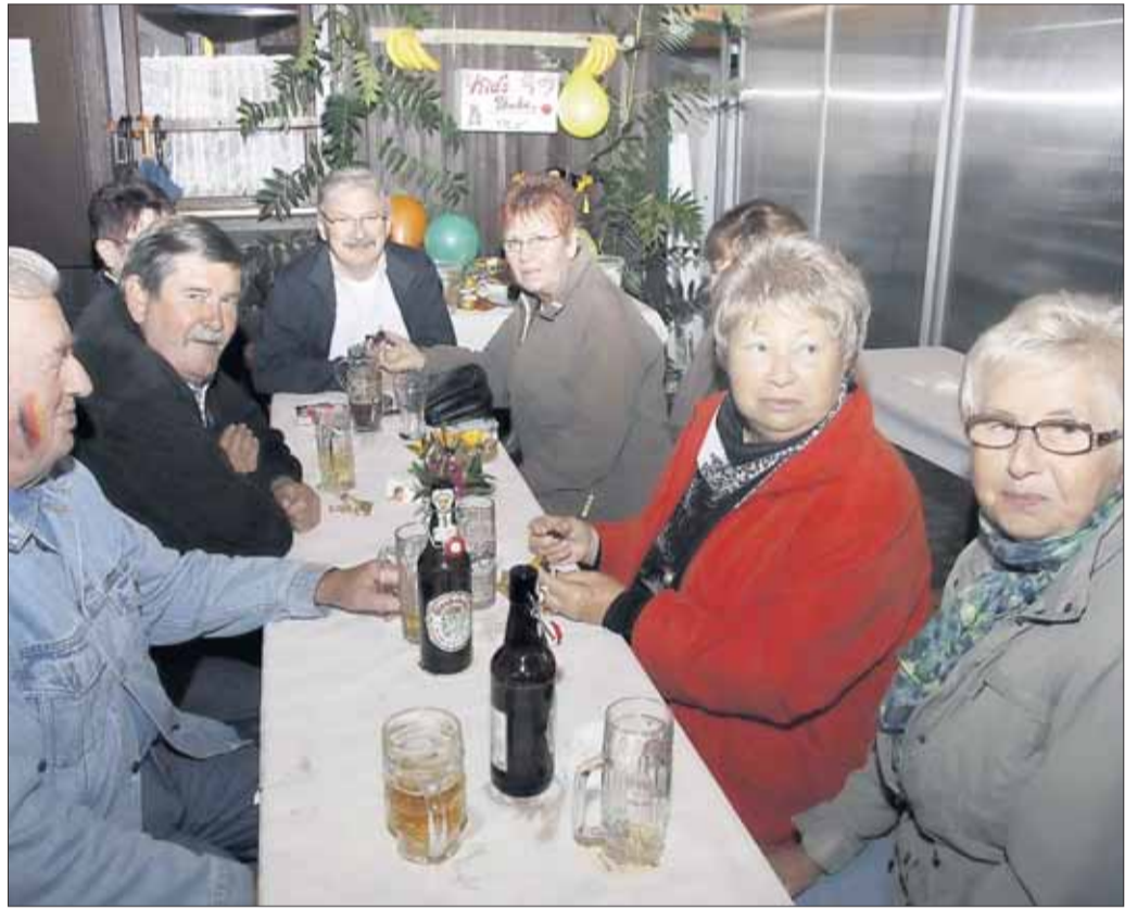
Sein traditionelles Sommerfest zur Sonnenwende feierte der Kleingärtnerverein am Breitenbach in Seligenstadt bei nicht allzu sommerlichen Temperaturen...