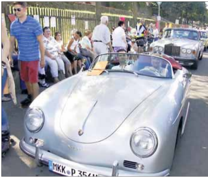
Dieser Speedster im Bestzustand zog alle Blicke auf sich.

Seligenstadt – Pünktlich kam der Sommer zurück, eigentlich „wie bestellt“, als der Oldtimerclub WWWV (WirtschaftswunderWagen Vereinigung) am vergangenen Sonntag, an der malerischen Mainuferpromenade seine Zelte für die 26. Oldiepräsentation aufschlug. Die Aussichten versprachen stetige Wetterbesserung, was sich auch bestätigte und so stellten sich schon früh zahlreiche Oldtimerfreunde mit ihren blitzblank herausgeputzten Fahrzeugen und staunende Gäste unterhalb der Stadtmauer ein. Dicht umlagert war das Info-Zelt an der Einfahrt, denn viele meldeten