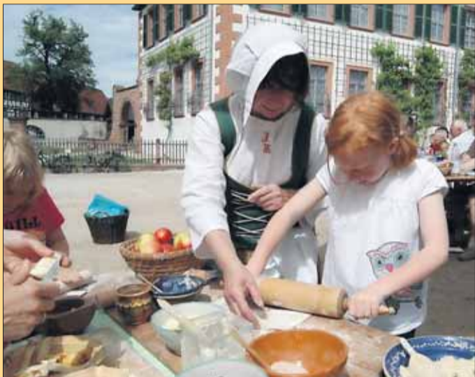
Unter fachkundiger Anleitung gelingt jedes Backwerk.

Kinder können zusehen, wie in der alten Klostermühle Getreide zu Mehl gemahlen wird und sind eingeladen, sich ihre eigenen süßen oder herzhaften Brotfladen selbst zu belegen und dann im Klosterbackofen backen zu lassen. Brotteig steht bereit, ebenso Obst, Nüsse, Rosinen, Zimt und Zucker. Die herzhaften Fladen werden mit Käse und Olivenöl sowie mit Kräutern aus dem Klostergarten, wie Rosmarin, Salbei oder Oregano belegt. Unter Anleitung der Klatschmohnfrauen rollen die Kinder selbst ihre Teigfladen aus und können sie dann nach eigener Entscheidung belegen. Bevor die Fladen in den Backofen geschoben werden,