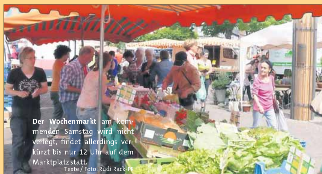
Der Wochenmarkt am kommenden Samstag wird nicht verlegt, findet allerdings verkürzt bis nur 12 Uhr auf dem Marktplatz statt. Texte / Foto: Rudi Rack-PR

heimer Straße) und am Friedhof (Evangelische Kirche, Aschaffener Straße) zur Verfügung. Im Rahmenprogramm werden Backen mit Kindern, Kinderschminken, u.s.w. und spezielle Kinderstadtführungen angeboten. Seligenstadt heißt alle Bürger und Gäste willkommen!