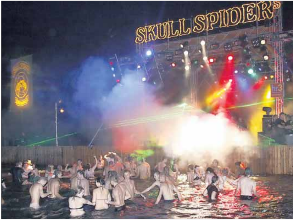
Feucht-fröhlicher gehts nicht mehr: Die Beach-Party in Mainflingen.

Mainflingen – Die Mutter aller Strandpartys ist zurück: Die Mainflinger Beach-Party 2011 lockt am kommenden Samstag, 2. Juli, wieder Gäste aus der ganzen Republik. Bereits zum zwölften Mal veranstaltet der Motorradclub Skull Spiders aus dem Raum Seligenstadt die beliebte Sause am Mainflinger Badensee, Seestraße 11. Schon seit 1989 ist die Feier am Wasser der Sommer-Event in der Region. Neben einer großen Schwimmbühne auf dem See, auf der verschiedene Showeinlagen präsentiert werden, gibt's zwei 15 Meter lange Bars, drei Bierstände und einen riesigen Grillstand.