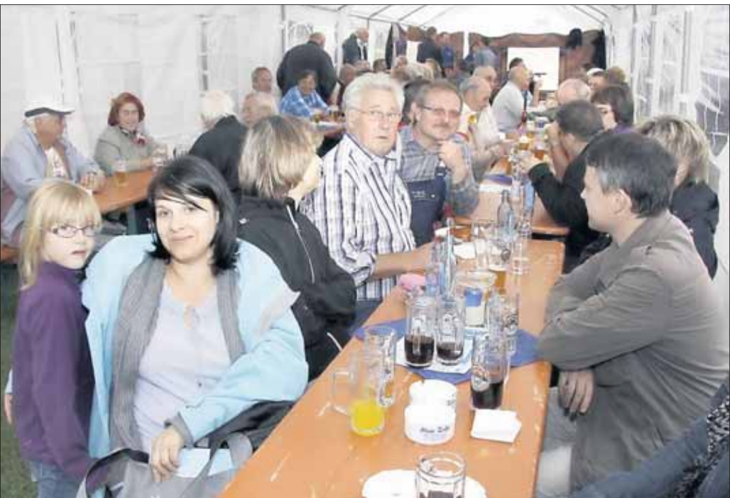
Trotz der schlechten Witterung war das sechste Gickel-Lampion-Fest des Geflügelzuchtvereins Froschhausen sehr gut besucht. Nach dem traditionellen Bieranstich wurden die Besucher in bewährter Weise mit deftigen Grillspezialitäten, Speck und Eier und den beliebten Hähnchenschenkel versorgt.