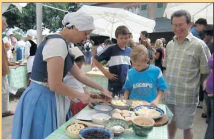
Kneten, formen, naschen beim Klatschmohn.

Erholung von all den angebotenen Aktivitäten findet man bei einem Spaziergang im nahe gelegenen Konventgarten oder indem man in gemütlicher Runde den Geschichten der Märchenerzählerin lauscht. Von Hänsel und Gretel, Frau Holle oder von Aschenputtel wird sie den fleißigen Kindern erzählen, alles Märchen, die etwas mit Backöfen oder Küchenherden zu tun haben. In der alten Klostermühle drehen sich die Mühlräder. Die Kinder können sehen, wie aus Körnern Mehl gemahlen wird. Beginn: ab 11 Uhr bis ca. 18 Uhr. Wo: Vor dem Klosterbackofen in der ehemaligen Abtei in Seligenstadt.