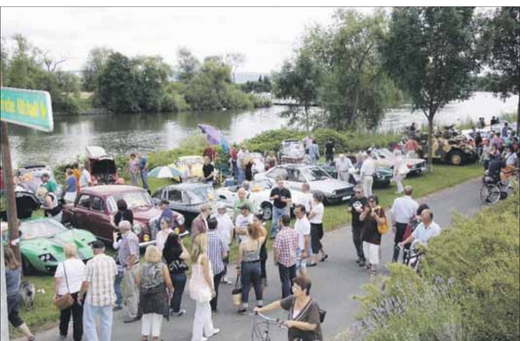
Faszinierende Oldtimer und Klassiker waren die Publikumsmagneten des vergangenen Sonntags in Seligenstadt. Die WWV vereinte sie bereits zum 26. Mal zur Oldiepräsentation.

Mit Applaus und Komplimenten für eine gelungene Veranstaltung verabschiedeten sich die Seligenstädter Oldtimerfreunde von ihren zahlreichen (Stamm-)Gästen und Besuchern bis zum nächsten Jahr, wenn sie wieder zur 27. Auflage der Oldiepräsentation an das beschauliche Mainufer einladen.