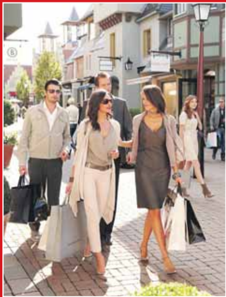
*Gegenüber ehemaliger UVP