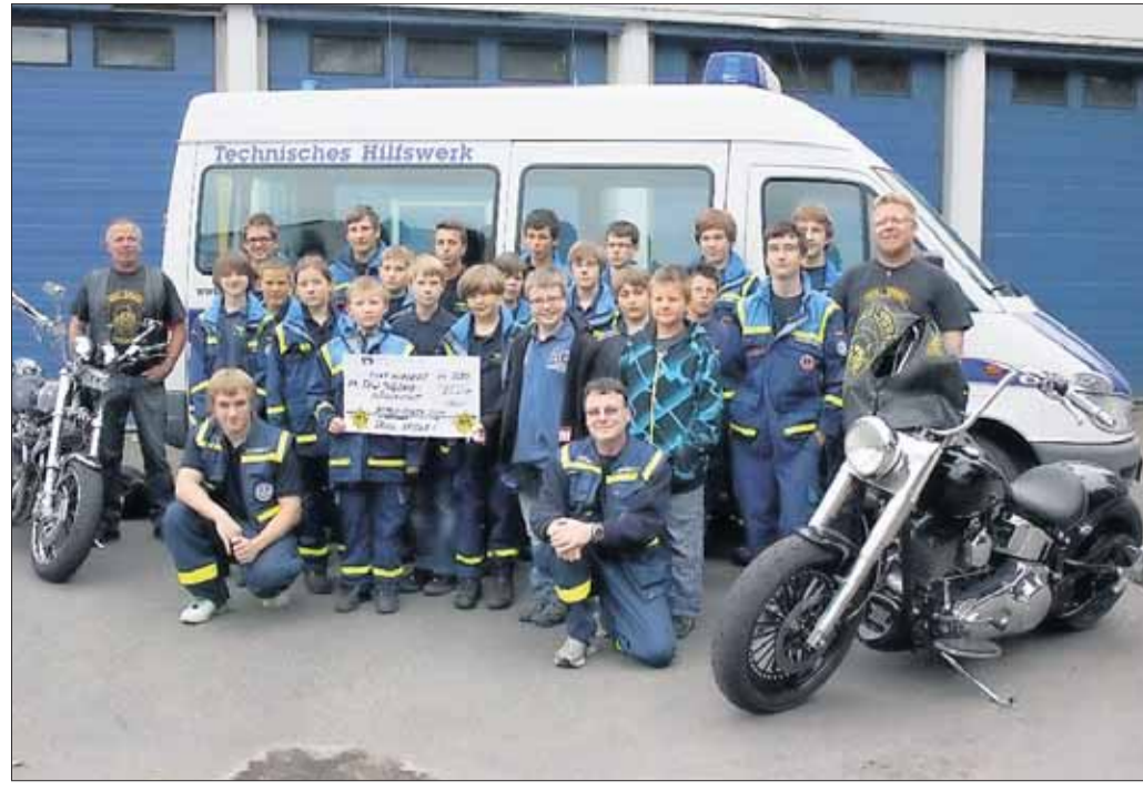
Aus der Mainhausener Beach-Party des Vorjahres spendeten die Skull Spiders 500 Euro für die Jugendgruppe des THW in Seligenstadt. Die Jugendbetreuer sagten herzlichen Dank an die Skull Spiders, dass sie das THW für diese Spende ausgewählt haben: „Das war unverhofft und hat uns alle wirklich sehr gefreut.“ Die nächste Beach Party ist am 2. Juli.

genau aus diesem Grunde muss der Veranstalter auf eine begrenzte Eintrittszahl achten, da der Innenraum auch nur über eine gewisse Anzahl an Plätzen verfügt. Diese Besetzung ist bereits ausgeschöpft und vorerst muss der Verein den Verkauf der Eintrittskarten stoppen und den Ausverkauf der Veranstaltung melden. Falls am Samstag, 18. Juni, herrliches Sommerwetter vorherrscht und die Veranstaltung, wie geplant als Open-Air stattfindet, können Kurzentschlossene noch einen Besuch wagen und eventuell weitere Eintrittskarten vor Ort erstehen.