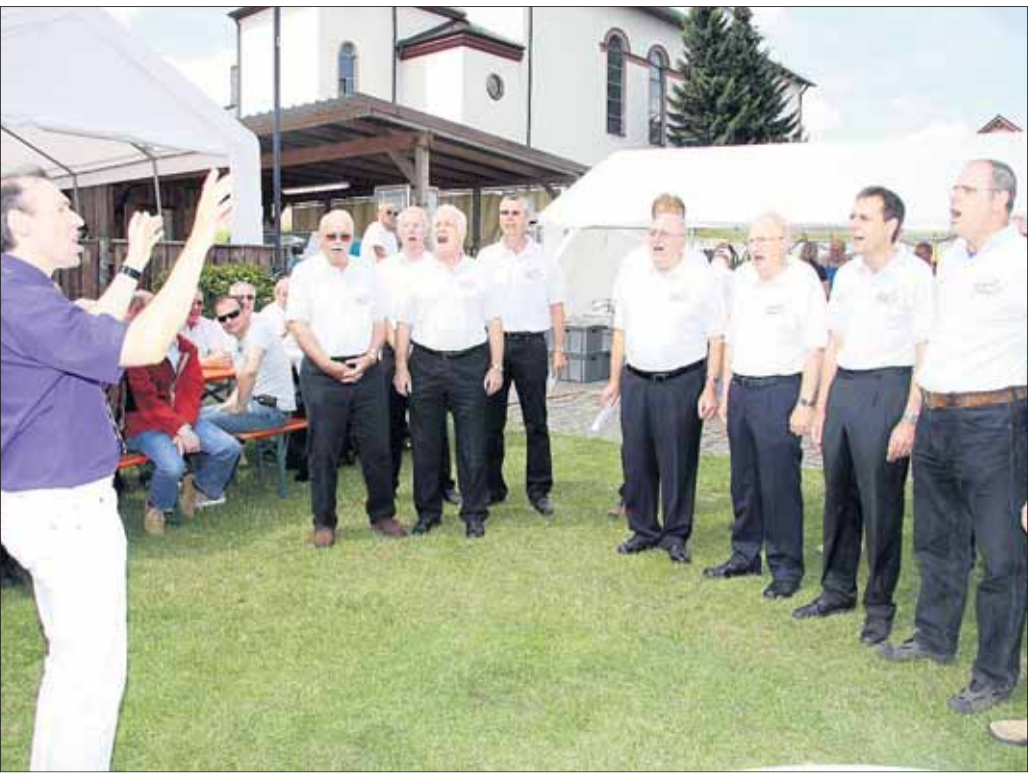
Derr Sängerbund 1901 Mainflingen feierte an den Pfingsttagen sein 110-jähriges Bestehen am Vereinsheim in Mainflingen unterhalb der Kirche am Main. Unser Bild entstand am Pfingstmontag während des Sängerknospens, hier mit dem Männerchor des Jubelvereins. Am Nachmittag trug der Kinderchor des Sängerbundes zur Unterhaltung bei.

Weitere Messstation in Mainflingen soll Unfallrisiko verringern: