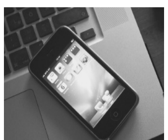
Smartphone und PC ermöglichen eine flexible Steuerung von Haushaltsgeräten.