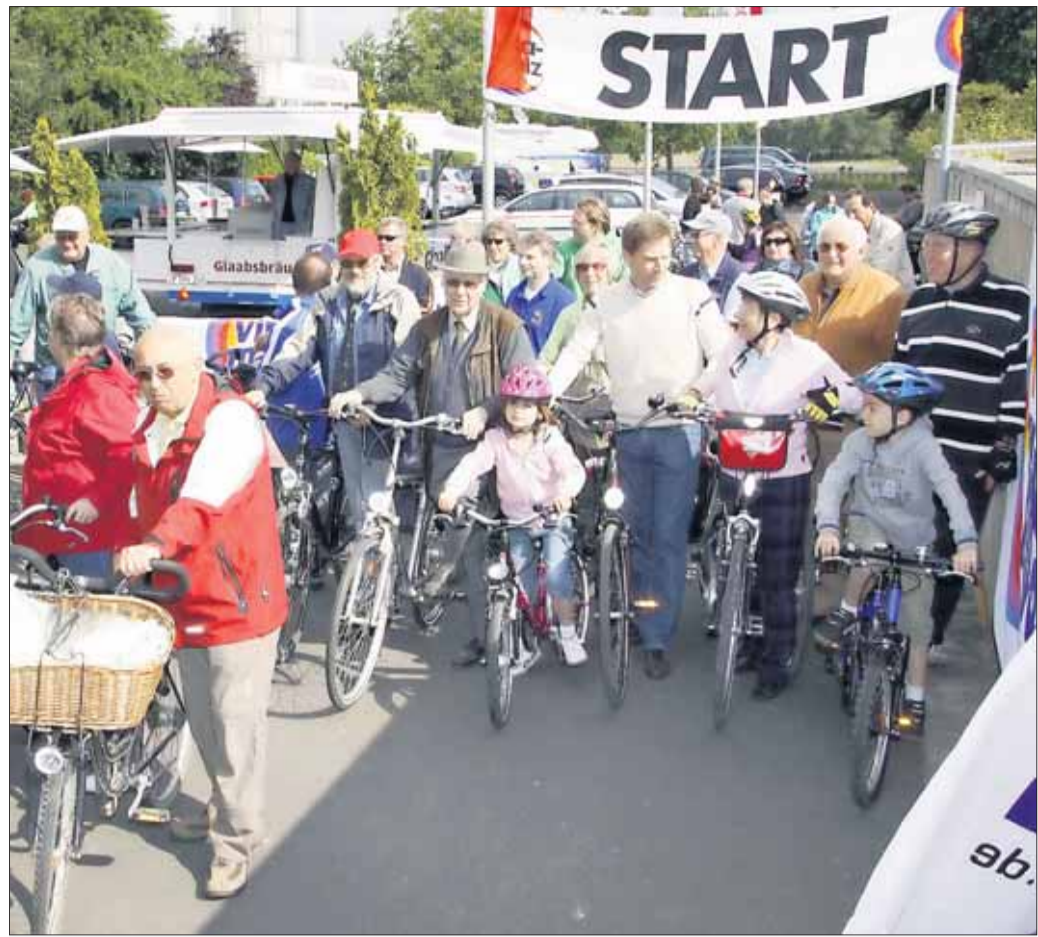
Prominentenstart zum Volksradfahren in Hainburg.