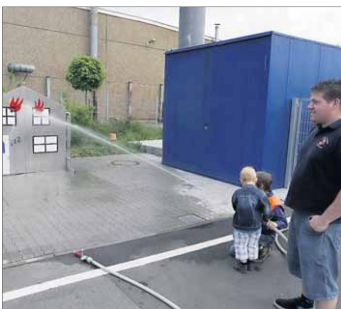
Als Feuerwehrleute konnten sich die Kinder an dieser Spritzwand üben.

Mainflingen – Auch dieses Jahr begrüßte die Feuerwehr Mainflingen den Mai mit ihrem traditionellen Maifest am 1. Mai. Bestes Fahrradwetter begleitete den Festakt den ganzen Tag, was sich deutlich in den Besucherzahlen niederschlug. Das Maifest, welches erstmalig am neuen Feuerwehrhaus in Mainflingen stattgefunden hat, wurde so gut besucht wie lange nicht mehr.