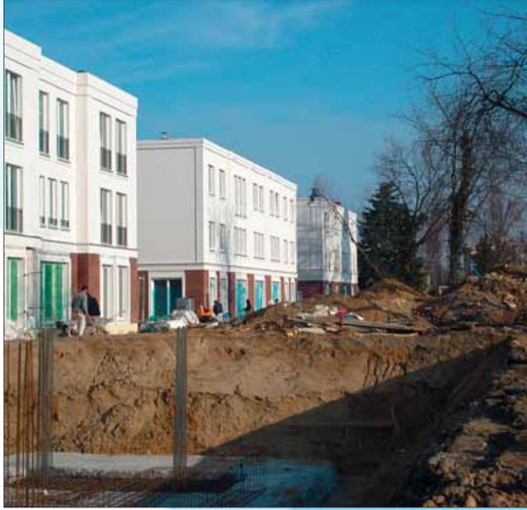
Ips/Cb. Prämienbegünstigt: Eigenheim-Erwerb

Ein Anspruch auf die Wohnungsbauprämie besteht bereits ab dem 16. Lebensjahr. Das heißt, auch wer erst im De-