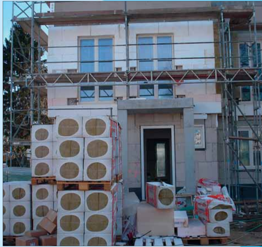
Ips/Cb. Baustellen-Risiken absichern

die Haftung für Sach- und Personenschäden übertragen zu haben. Diese Fehleinschätzung kann fatale Folgen haben und unter Umständen das ganze Bauvorhaben gefährden. Ein Bauherr unterliegt der gesamtschuldnerischen Haftung. Er haftet für Sach- und Personenschäden bei Verletzung der Verkehrssicherungspflicht und der Überwachungspflicht. Eine entsprechende Haftpflichtversicherung bietet Sicherheit. Die Versicherung endet mit Beendigung der Bauarbeiten, spätestens zwei Jahre nach Versicherungsbeginn.