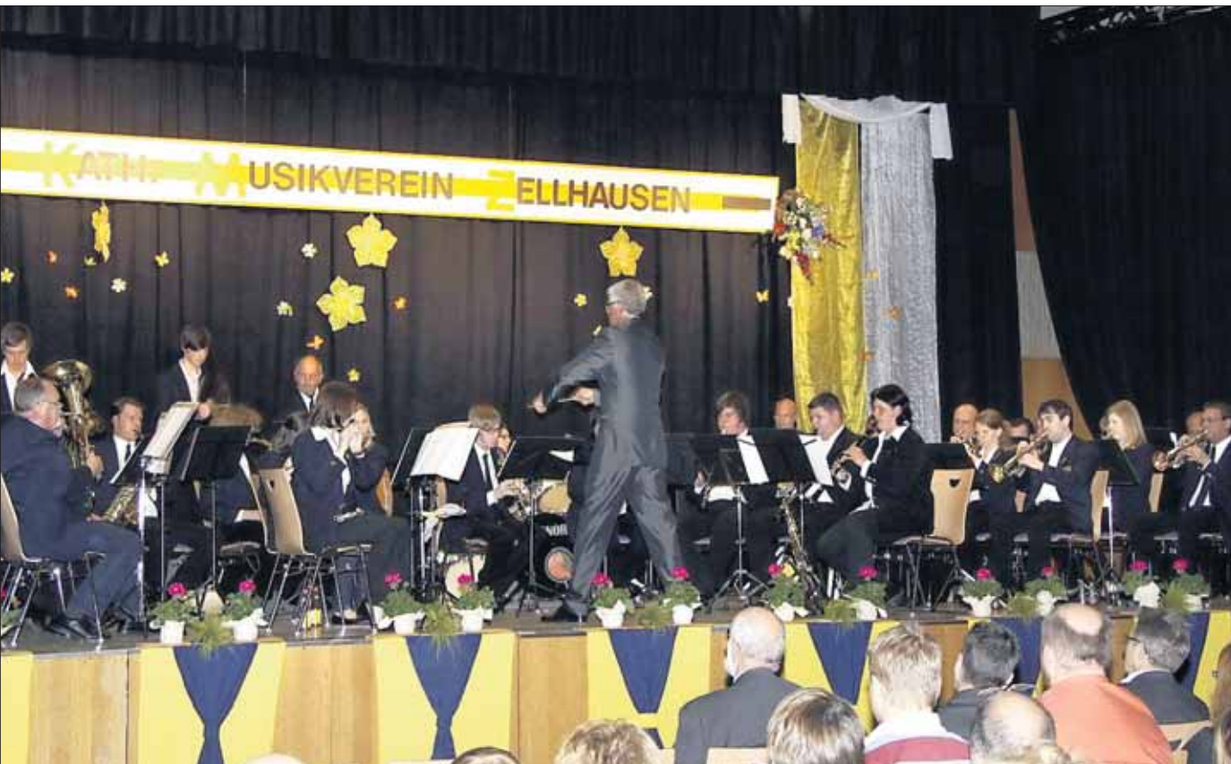
Zum Frühlingskonzert hatte der Katholische Musikverein Zellhausen ins Bürgerhaus eingeladen.