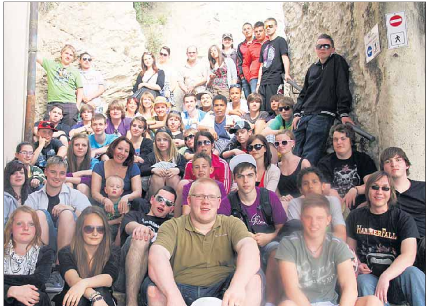
Zurück von den „Tagen der Orientierung“ sind 52 Schülerinnen, Schüler, Lehrer und Teamer der Hainburger Kreuzburgschule. Im Jugendwerk Brebbia am Lago Maggiore standen zahlreiche Gespräche über den „Sinn des Lebens“ ebenso im Programm wie der Besuch des Mailänder Friedhofs und des Felsenklosters Sta. Caterina. Das Thema „Orientierung“ stand im Blickpunkt der Woche.

schäften bei denen das DM-Plakat im Eingangsbereich hängt, sind DM-Zahler willkommen. Nutzen Sie den kostenlosen Service der Fachgeschäfte und realisieren Sie Ihre Wünsche und Ziele. Freundliche Bedienung und individuelle Beratung erwarten Sie in allen Geschäften. Kostenlose Parkplätze finden Sie ganz in der Nähe..