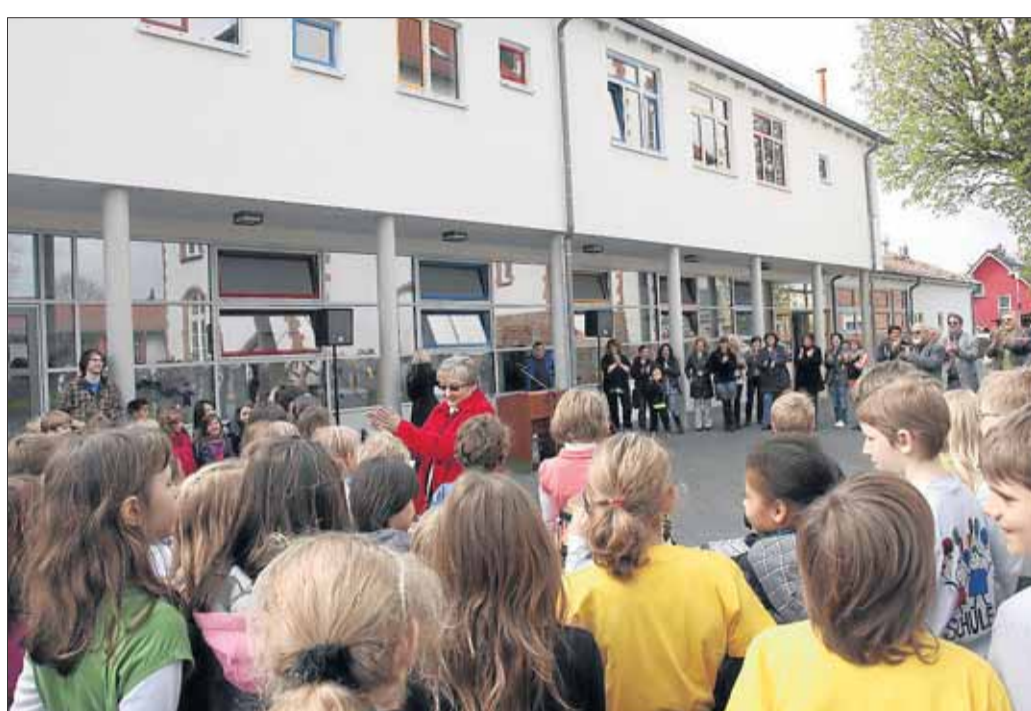
An der Anna-Freud-Schule (AFS) Mainflingen wurde gefeiert. Auf dem Schulgelände entstand ein zweigeschossiger Neubau mit etwa 630 qm Grundfläche. Im Erdgeschoss ist alles auf die Betreuung ausgerichtet. Dort gibt es unter anderem zwei Betreuungsräume, ein Büro, Speiseraum und Küche mit den erforderlichen Nebenräumen. Im Obergeschoss findet künftig auch Unterricht statt. Die Investition für die Baumaßnahme beliefen sich auf rund 1,98 Millionen Euro. 890.000 Euro davon entfallen auf den schulischen Teil. paw