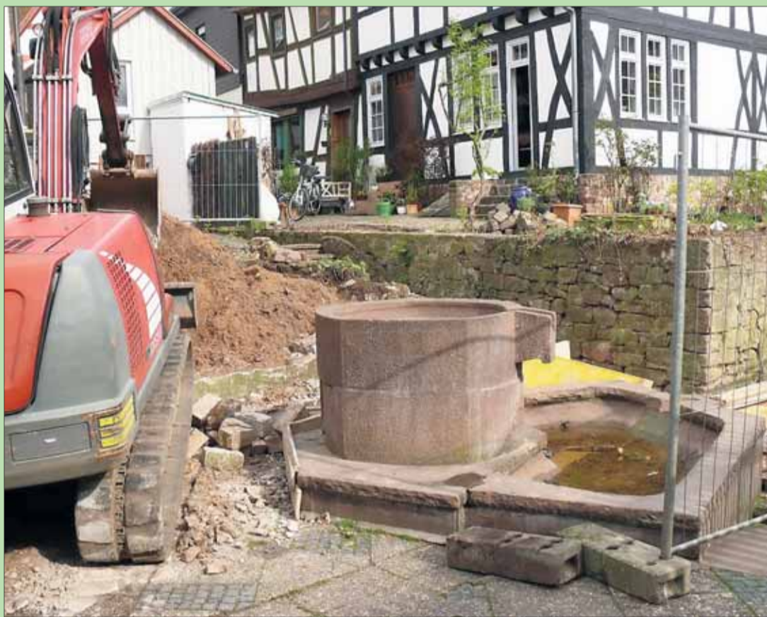
Baustelle „Roter Brunnen“: Nach Jahrzehnten kommt jetzt die Veränderung.

Seligenstadt – Um den Roten Brunnen ranken sich Geschichten. Das „versteckte Plätzchen“ ist ein Ort, an dem gern verweilt wird. Der Magistrat hat dieser Tage den Auftrag für die Umgestaltung des Platzes am „Roten Brunnen“ vergeben. „Der Platz am „Roten Brunnen“ wird grundlegend umgestaltet.“ Die Gesamtbaukosten betragen etwa 75.000 Euro, wobei Sponsorengelder die Finanzierung und Bauausführung erst ermöglicht haben. Der erste Bauabschnitt wird Anfang April 2011 in Angriff genommen und wir rechnen mit einer Fertigstellung noch vor dem Geleitsfest, also mit einer Bau-