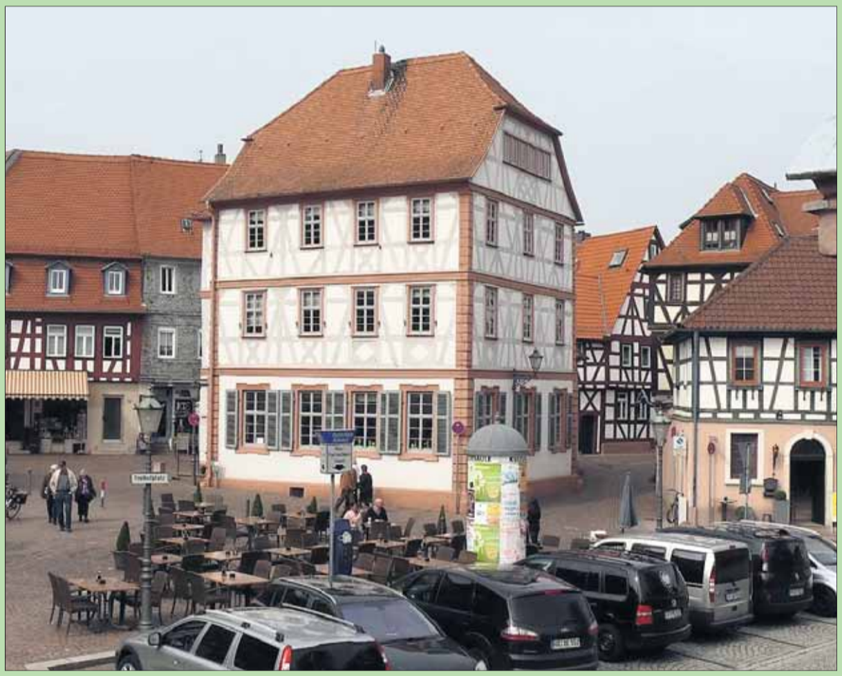
Seligenstädter „Talentschmiede Musikschule“.