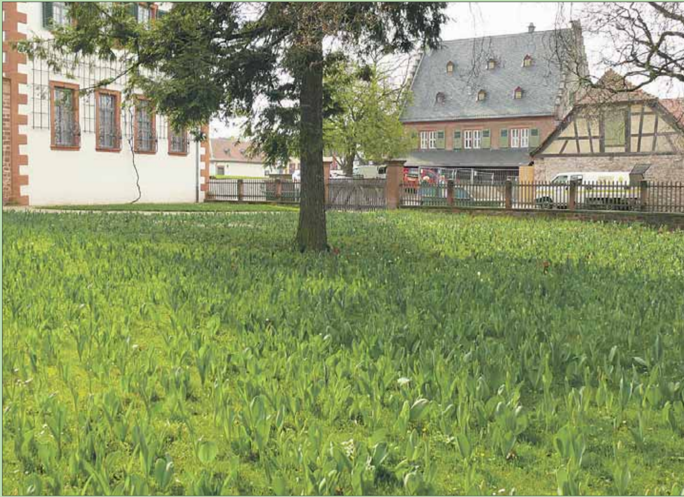
Einladung zum Frühlingserlebnis mitten in der Einhardstadt: Tausende Tulpenzwiebeln sind im Klostersgarten prächtig aufgegangen und dürften sich bei diesen Temperaturen bis zum Wochenende in voller Blüte zeigen. Texte / Fotos: Rudi Rack-PR

Mode> JOSIE'S FASHION | Mode> STADDSON'S | Schuhe> QUICK-SCHUH | Schuhe> SCHUHHAUS FRANZ | Mode> NKD VERTRIEBS GMBH | Mode> KAUFHAUS MITTL Spirituosen> DIE VITRINE | Tabakwaren> TABAK FLÜGEL | Sportartikel> INTERSPORT BEIKE | Schuhe> SCHUHHAUS RÖTTINGER | Bilder/Plakate> GALERIE PLAKAT AM MARKT Bäckerei> BÄCKEREI HAAS | Mode> COSIMA | Metzger> METZGEREI FECHER | Bücher> BÜCHERWURM | Foto> FOTO EHRMANN | Kinderbekleidung> LILLIPUT | Mode> MODEHAUS BLUMÖR Farben & Tapeten> TAPETENWECHSEL LÜCK-WURZEL | Kaffee> GRUBER -KAFFEE-TEE | Feinkost> BARLETTA FEINKOST & VINOHEK | Deko> DEKO-ARTS | Gaststätte> ZUM NEUEN SCHWAN Lederwaren & Accessoires> BAYER LEDERSTUDIO | Pelztextilien> PELZ SCHENKEL DESIGN | Mode> MODE FÜR SIE | Drogerie> DIRK ROSSMANN GMBH | Blumen> BLUMENWERKSTATT SCHLIEßMANN Gaststätte> KLEINE'S BRAUHAUS | Uhren & Schmuck> CRAZY TIME | Parfümerie & Kosmetik> PHILIPPI | Haushaltswaren> LINK | Metzger> FRANZ BECKER | Schmuck> STRANDGUT- SCHMUCK & MEER Eiscafe> FELTRIN | Mode> FASHION CORNER | Mode> STILECHT SCHUHE & TASCHEN | Mode> STILECHT MODE & ACCESSOIRES | Innenausstätter> GARDINEN SEIBERT | Kinderbekleidung> ERNSTING'S FAMILY Telekommunikation> E-PLUS | Geschenkartikel> W&W WUNDERLAND MARKUS WUNDERLICH | Schmuck> SCHMUCKSTÜCK | Foto> FOTOSTUDIO AUGENBLICKE | Schenken & Wohnen> LA PETITE BOUTIQUE