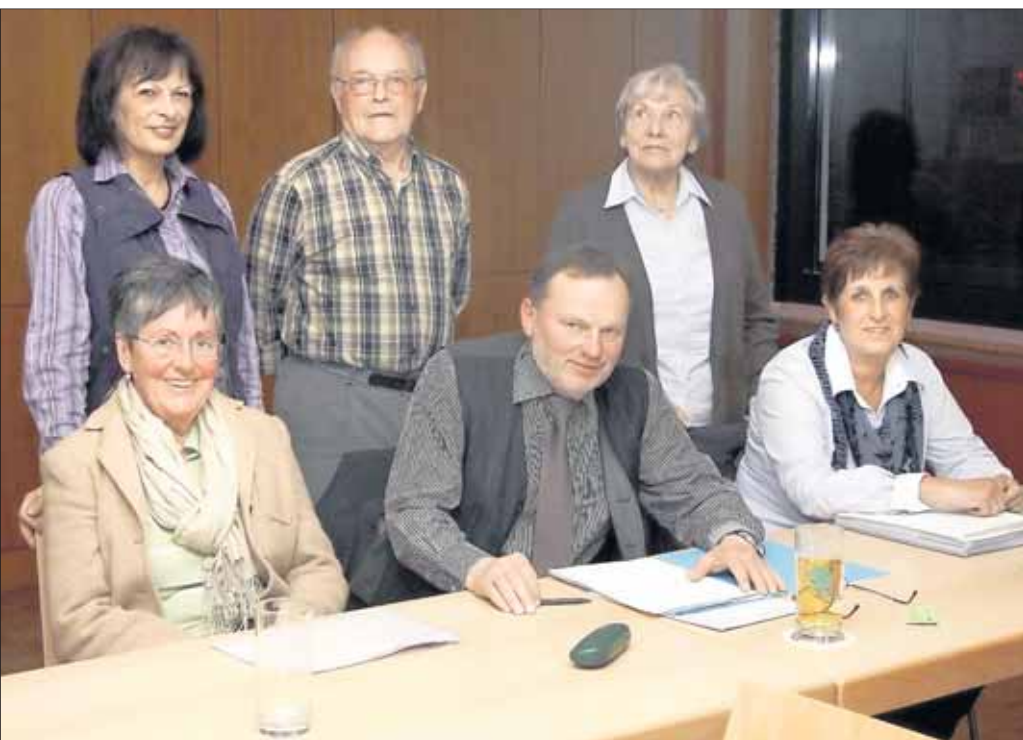
Der VdK-Ortsverband Mainflingen hatte seine gut besuchte Jahresversammlung am vergangenen Freitag im Bürgerhaus in Mainflingen. Die Versammlung entlastete und bestätigte den amtierenden Vorstand einstimmig.