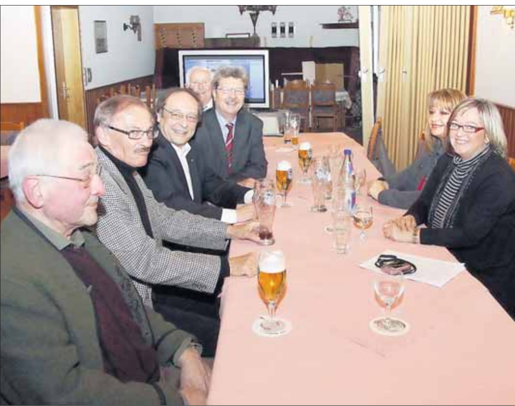
Die Hainburger Christdemokraten luden ihre alle Freunde, Helfer und interessierte Hainburger Bürger in die Gaststätte „Zum Löwen“ in Klein-Krotzenburg zur obligatorischen Wahlparty ein und freuten sich über das gute Ergebnis, welches als herausragend in der Region gelten darf.