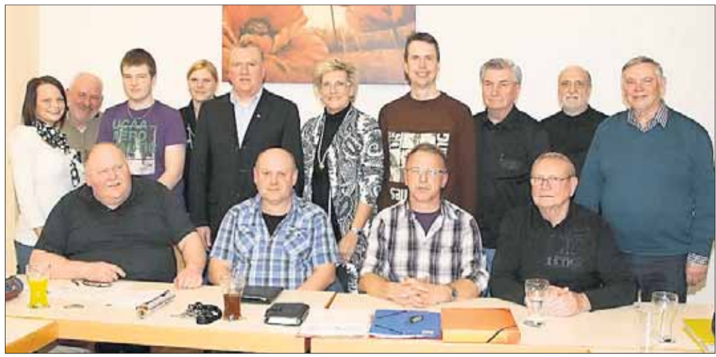
Mit diesem Vorstandteam blickt der TuS-Spielmannszug optimistisch in die Zukunft.