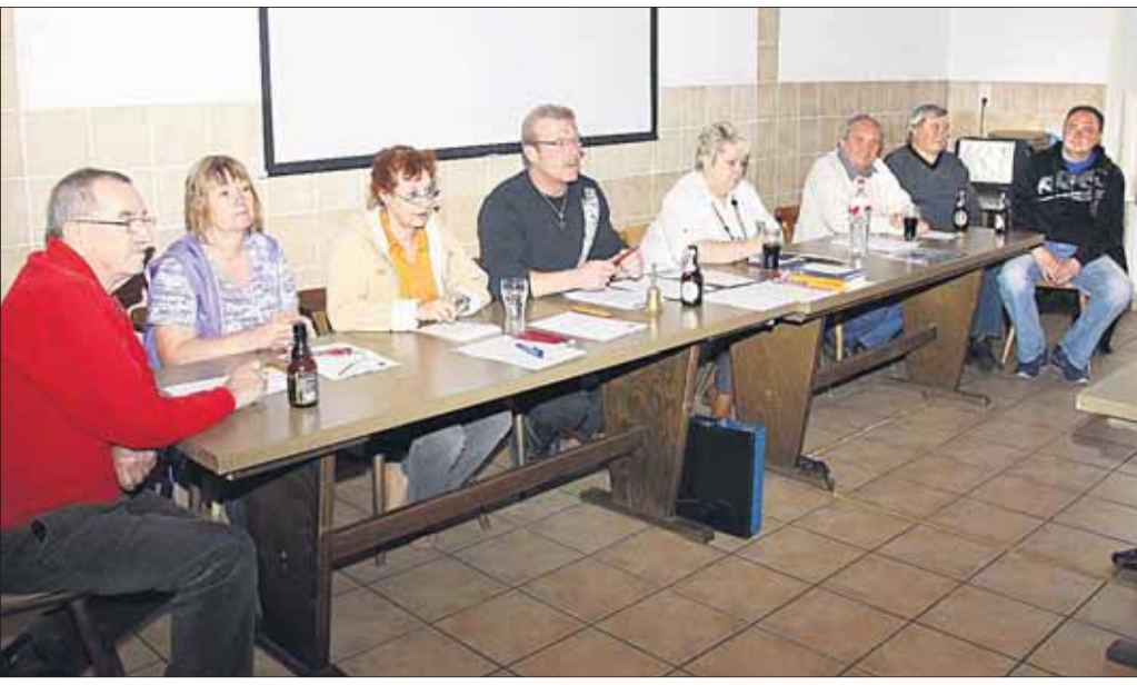
Der Hainstädter Kleingartenbauverein hatte am Samstag seine gut besuchte Jahresversammlung, bei welcher der bewährte Vorstand einstimmig bestätigt wurde. Über die weitere Nutzung des Vereinsheims durch aktive und passive Mitglieder wird an einer zufriedenstellenden Lösung gearbeitet.