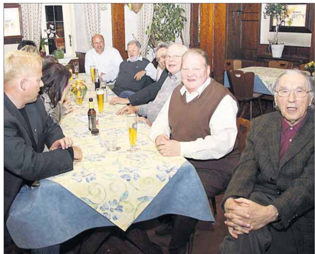
Der Ortsverband der CDU Seligenstadt veranstaltete im Saal des Römischen Kaisers seine Wahlparty zur Kommunalwahl. Trotz deutlicher Stimmenverluste strahlten die Christdemokraten Zuversicht aus und konnten im landesweiten Vergleich „noch zufriedenstellend“ abschneiden.