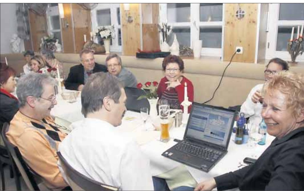
Das SPD-Wahltreffen war in den „Drei Kronen“ angesagt. An diesem Abend gab es ja noch kein Endergebnis, da die kumulierten und panaschierten Stimmzettel doch nicht ausgezählt waren, doch der landesweit vermeldete Trend stimmte die Genossen optimistisch, auch wenn das Wahlergebnis erst in den Tagen nach der Wahl feststand.