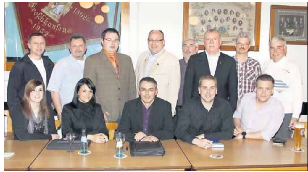
Eine gut besuchte Jahresversammlung hatte der Gesangverein Harmonie Froschhausen. Auf der Tagesordnung standen die Jahresberichte und Vorstandswahlen. Unser Bild zeigt das bewährte Führungsteam.