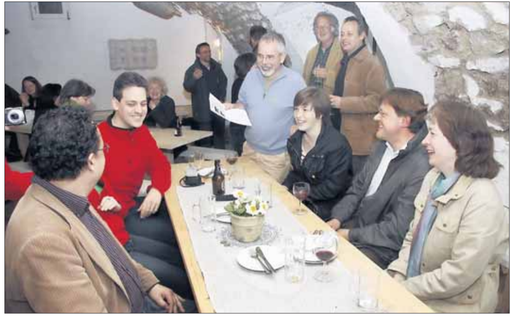
Allen Grund zur Freude hatten die Seligenstädter Grünen, als die ersten Hochrechnungen zur Kommunalwahl vorlag. Sie feierten ihre Wahlparty im Kellergewölbe bei Chez Bemm in der Steinheimer Straße 24.

Unter www.kunstforum-seligenstadt.de können Karten online bestellt werden und es steht auch von Montag bis Freitag von 8,30 - 19,30 Uhr eine Ticket-Hotline mit der Rufnummer 0180 5040300 zur Verfügung.