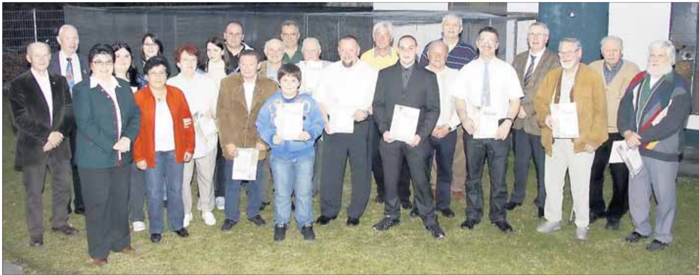
Die Stadt zeichnete die besten Kleintierzüchter und Hundesportler des vergangenen Jahres aus.