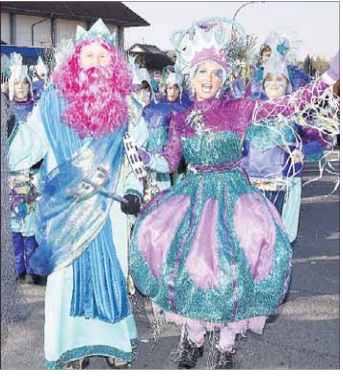
Helauuuuuuu in Zellhausen!