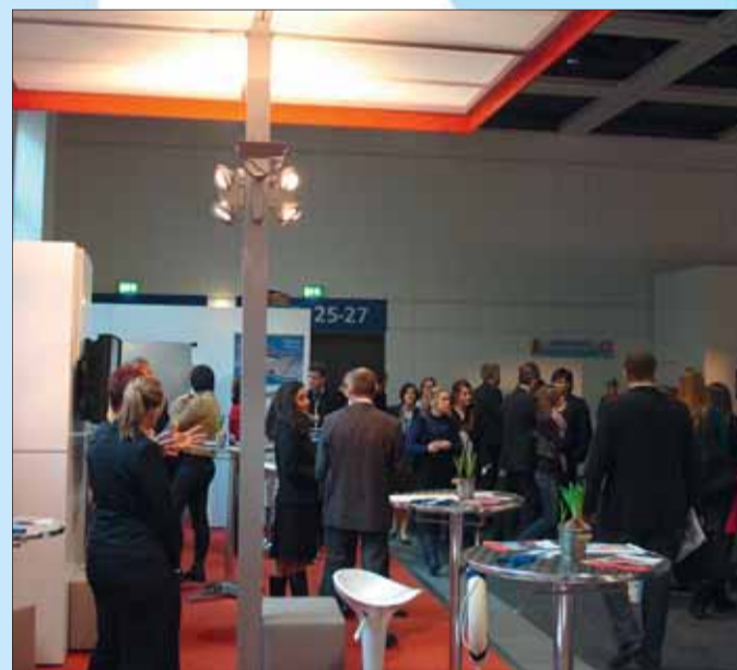
Kosten im Zusammenhang mit der Arbeitssuche sind Werbungskosten.

nachzuweisen. Bei fehlendem Nachweis der tatsächlichen Aufwendungen kommt ebenfalls ein Werbungskostenpauschbetrag zum Abzug. Steuerberater helfen.