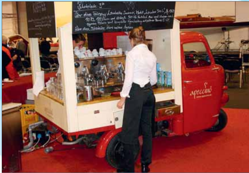
Ips/Cb. Kleinunternehmer bleiben nicht immer umsatzsteuerfrei.

(zum Beispiel ein längerer Urlaub in der Weihnachtszeit) auch im folgenden Jahr Anspruch auf die Kleinunternehmerregelung besteht und die Umsatzsteuer nicht etwa aus eigener Tasche zu zahlen ist.