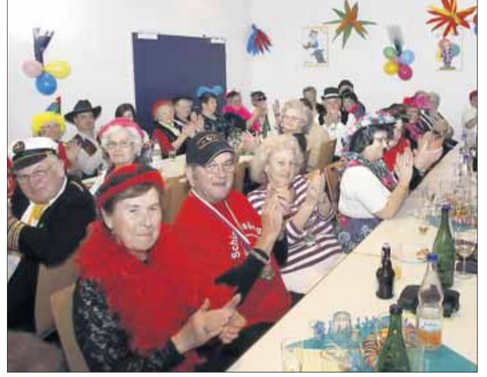
Spaß an der Freud' beim Kilianuschor.