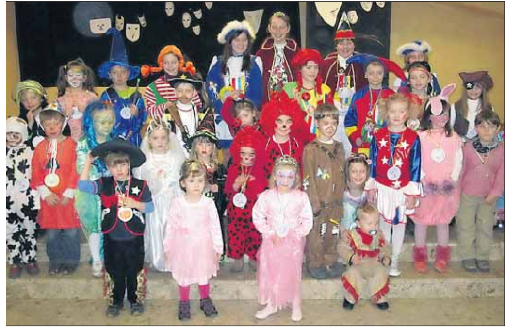
Fröhlich feierten die Kleinsten der Pfarrei St. Nikolaus am Sonntag mit dem Klein-Krotzenburger Kinderprinzenpaar ihren Kleinkinderwortgottesdienst zum Thema „Lächeln zu verschenken“. Bunt gekleidet und fröhlich singend lobten sie Gott und beteten zu Jesus.

den sie pünktlich um 24 Uhr unter großem Helau aller Närrinnen und Narren die Fastnachtskampagne 2011 beenden und aus der Narrhalla ausziehen. Der Volkschor und die Radsportvereinigung freuen sich auf ihren Besuch und versprechen schon jetzt, dass dieser fastnachtliche Kehraus wieder zu einem stimmungsvollen und lohnenden Abend für alle Närrinnen und Narren werden wird.