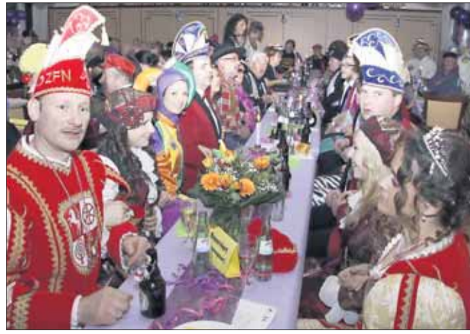
Schunkelecken lockerten das Programm auf.