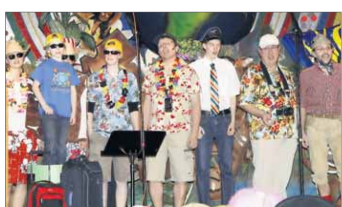
Reisegesellschaft: „Vater-Sohn-Tochter-Chor“.