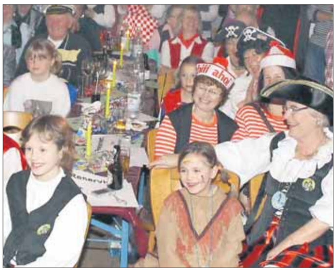
Liederfreunde - begeistert von ihren Fastnachtsaktivitäten.