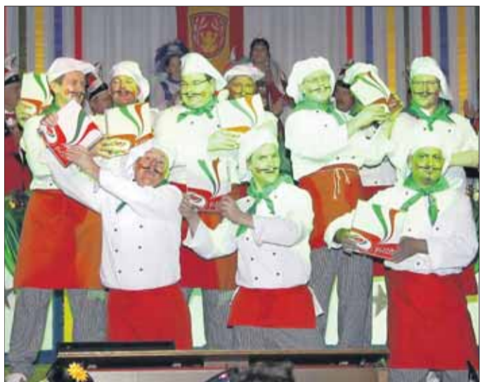
Lecker und immer nett, das Harmonie-Männerballett!