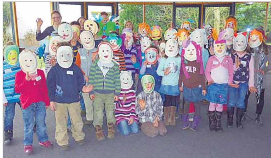
De Kinder von St. Marien stellten sich gegenseitig ihre Masken vor, wie hier zu sehen, gab es Löwen, Dinosaurier, Clowns, Pippi Langstrumpf, Blumen und auch schaurige Gestalten.