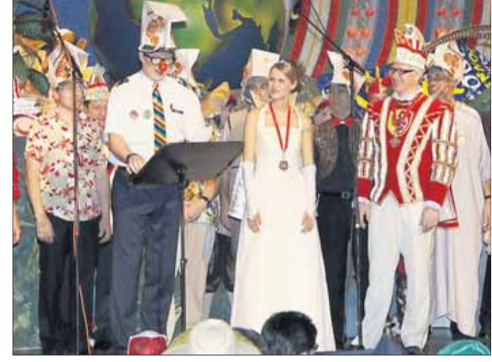
Gaudi für das Prinzenpaar mit den „Duttesängern“.