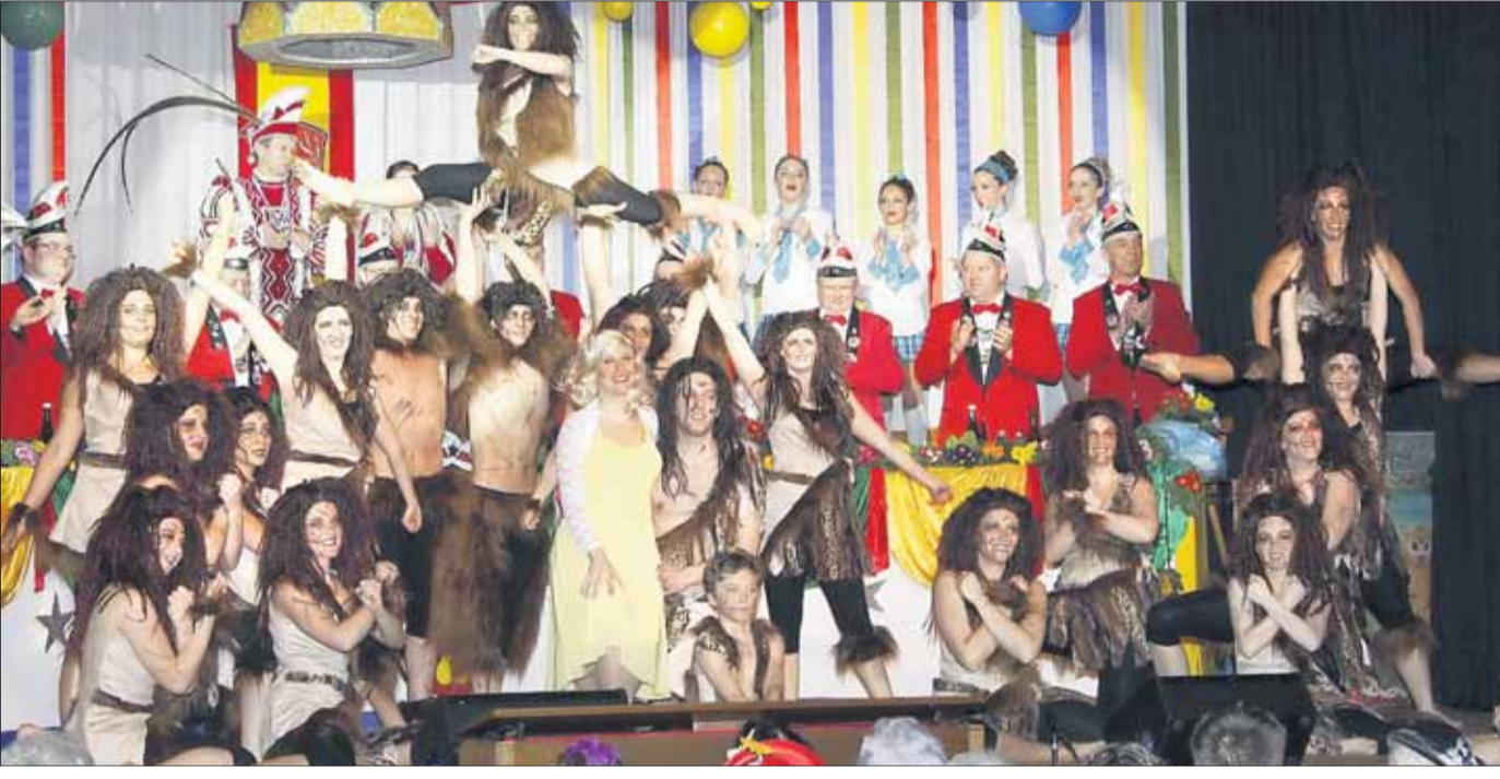
Die Tanzgruppe „Dance for Harmonie“ zeigt immer wieder eindrucksvoll, dass die Harmonisten sehr vielseitig sind.

„Ganz Froschhause von Herzen bebt, wenn hier die Fastnacht lebt“: