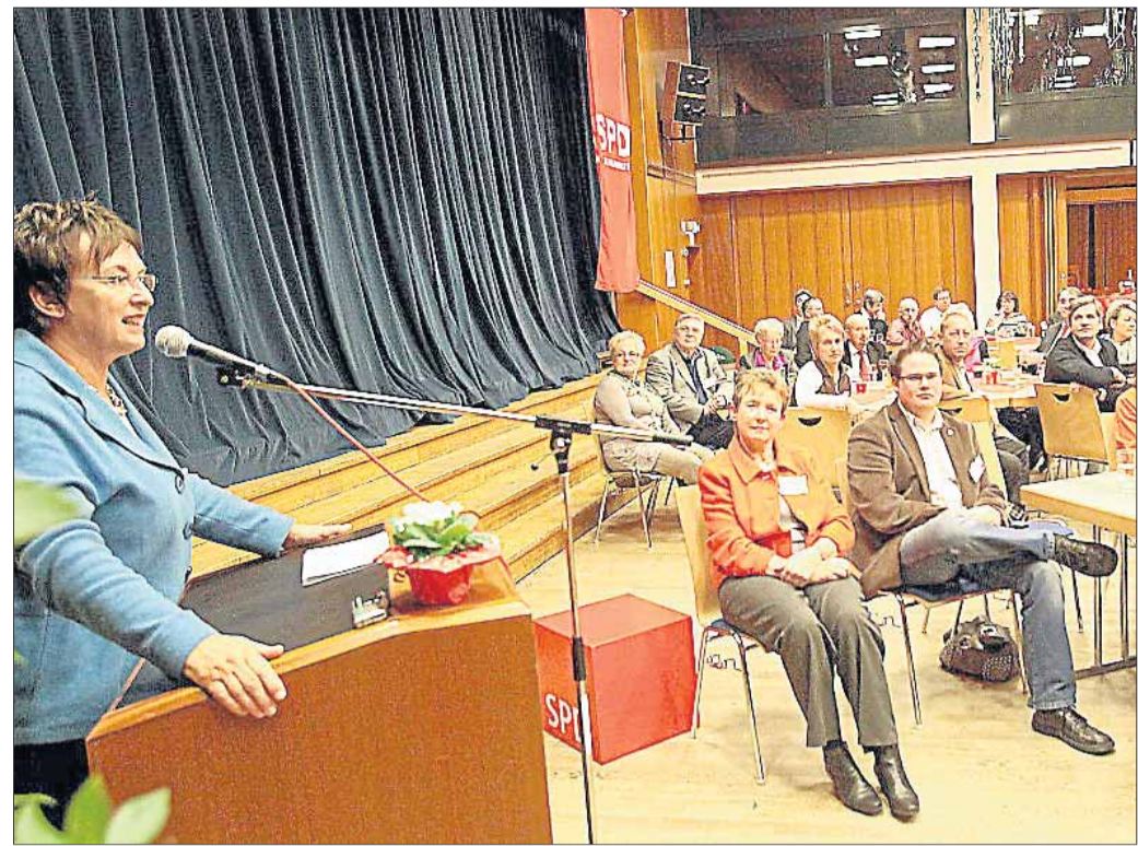
Ex-Ministerin Brigitte Zypries beim SPD-Neujahrsempfang in Mainhausen.