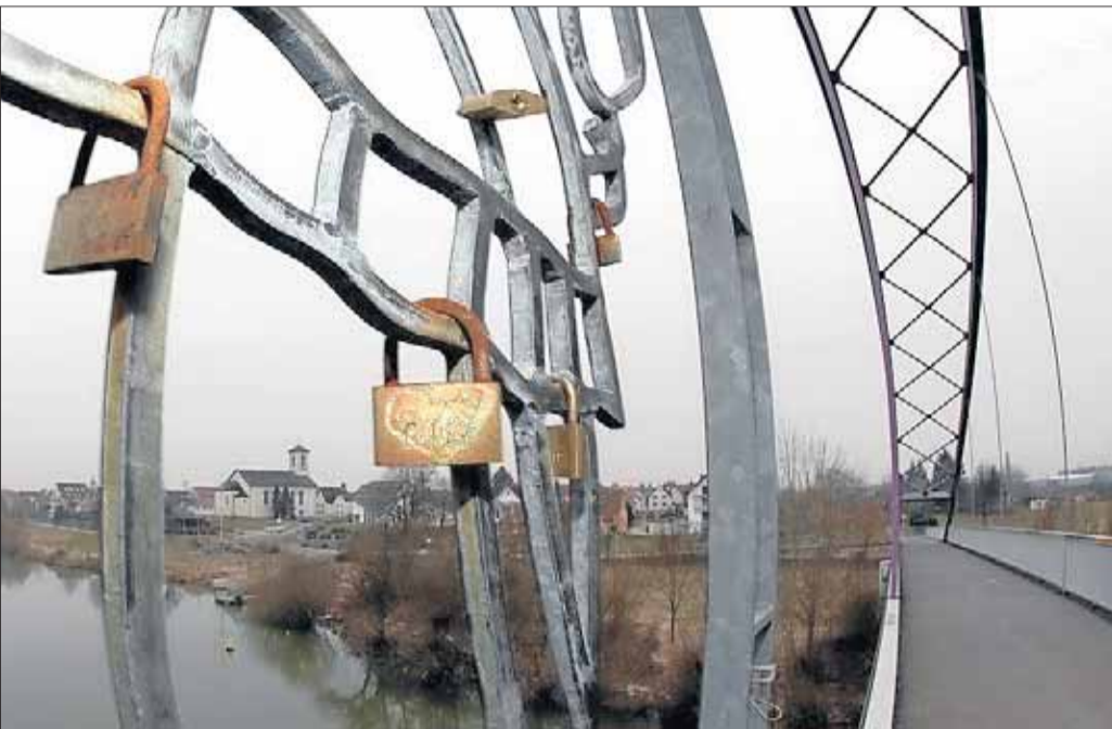
Mehrere so genannter Liebesschlösser zieren das schmiedeiserne Kunstwerk des Heiligen Kilianus auf dem gleichnamigen Steg über den Main bei Mainflingen. Der Trend auf diese Weise ihre Verbundenheit zu dokumentieren soll in Köln geboren worden sein. Angeblich sollen sich dort schon rund 40 000 Liebespaare auf diese Weise „zusammengeschlossen“ haben.