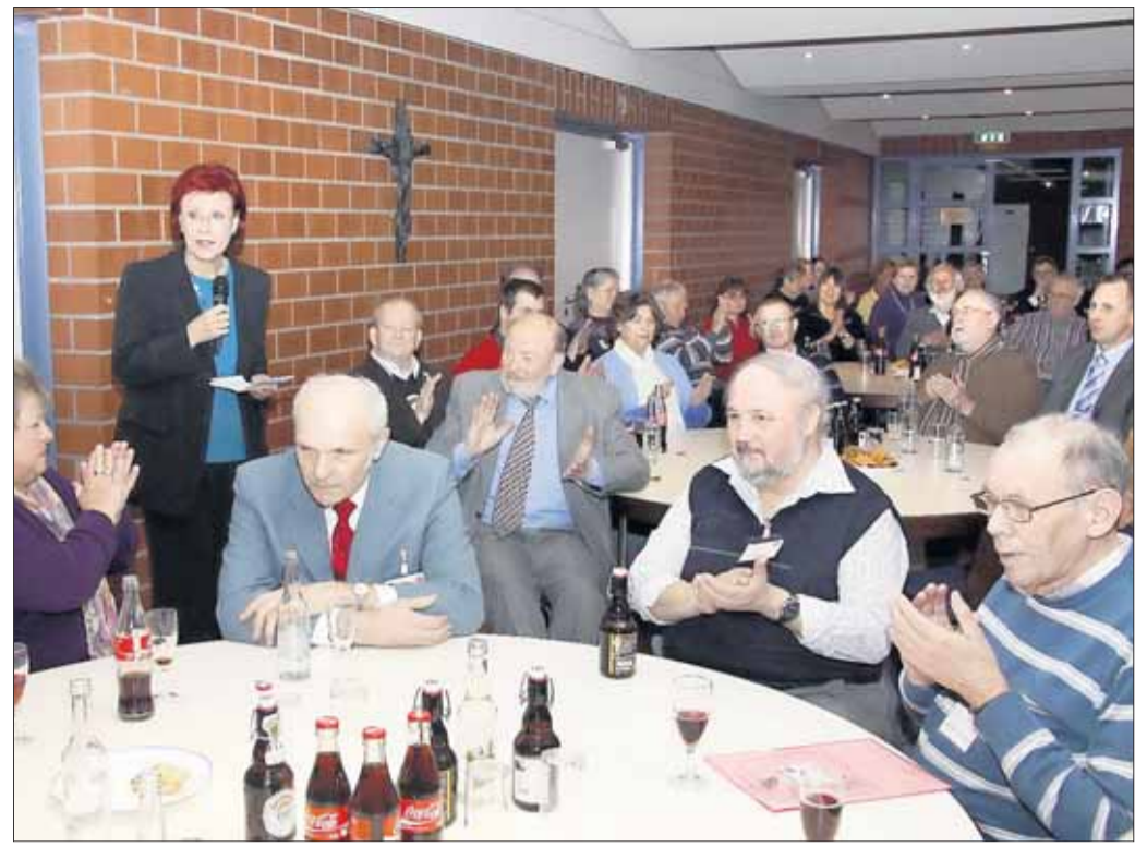
Die Hainburger Sozialdemokraten hatten am Montag ihren gut besuchten Neujahrsempfang im Foyer der Kreuzburghalle. Prominenter Gast war Heidemarie Wieczorek-Zeul MdB und Bundesministerin a.D. Die Kandidatinnen und Kandidaten für die Gemeindevwahl in Hainburg wurden vorgestellt und auf ein erfolgreiches Jahr angestoßen.

und Anwohner der Region ein, sich bei dieser Gelegenheit über die Wege und Möglichkeiten zu informieren, die jetzt genutzt werden sollen, um die umstrittene Errichtung von Block 6 am Standort Großkrotzenburg zu verhindern. Denn mit der jetzt erteilten Teilgenehmigung werden wesentliche Weichen für die Realisierung von Block 6 gestellt. Rechtsanwalt Matthias Möller-Meinecke, der die kommunale Klagegemeinschaft vertritt, wird an diesem Abend ausführlich die Rechtslage darlegen.