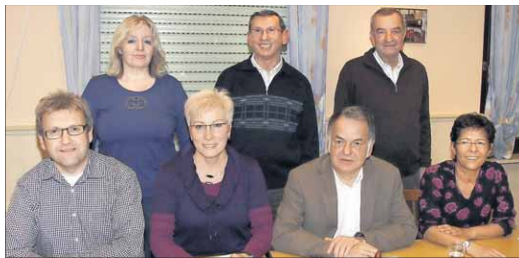
Zuversichtlich blickt der neue Vorstand in die Zukunft des Hainstädter Gesangvereins