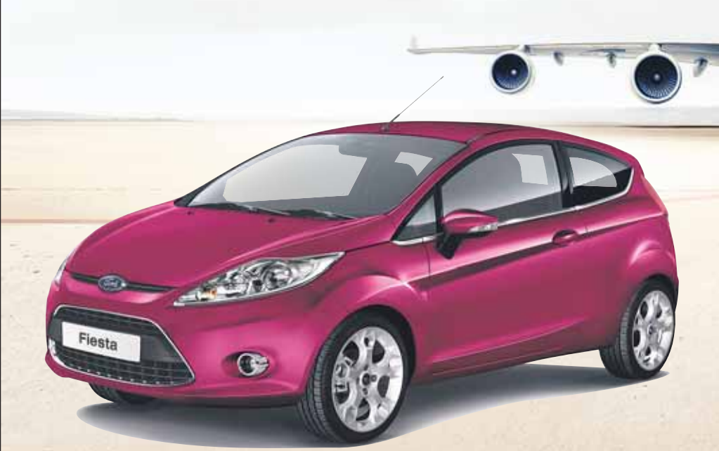
Abbildung zeigt Wunschausstattung gegen Mehrpreis.

Für fast alle Ford-Pkw-Modelle, nur bis zum 31.01. MIT DER FORD FLATRATE 3 MONATSRATEN GESCHENKT.!