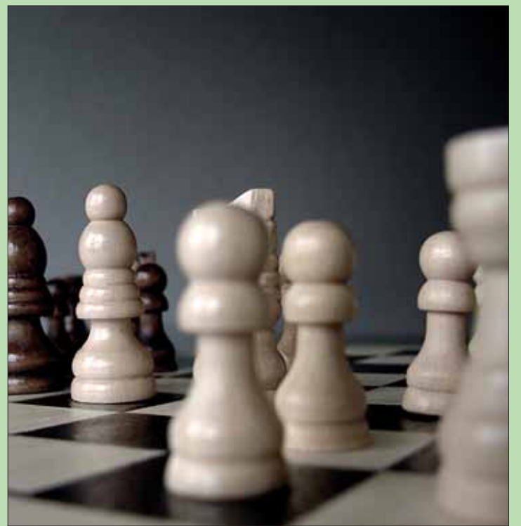
Ips/zz. Die Software läuft ohne Zusatzgeräte auf jedem modernen PC.

tion und Feinmotorik ist. Doch die wissenschaftlich fundierten Übungen machen nicht nur den Senioren, sondern auch deren Enkeln jede Menge Spaß. Und so wird das Programm keineswegs nur eingesetzt, um altersbedingtem geistigem Leistungsabfall vorzubeugen, sondern auch bei Kindern mit einer Lernschwäche oder mit ADHS, also einer Aufmerksamkeitsdefizit-Hyperaktivitätsstörung. Die Software läuft ohne Zusatzgeräte auf jedem modernen PC. Wer einen PC mit einem Betriebssystem ab Windows XP und eine Bildschirmauflösung von mindestens 1024 x 768 Pixel sowie CD-ROM-Laufwerk hat, legt die CD einfach in das Laufwerk ein, folgt den Anweisungen auf dem Bildschirm und kann schon loslegen. In der wertvollen Präsent-Box mit ausführlichem Booklet zum Thema Gehirntraining gibt es den peds-Braintrainer 3 im Buchhandel vor Ort.