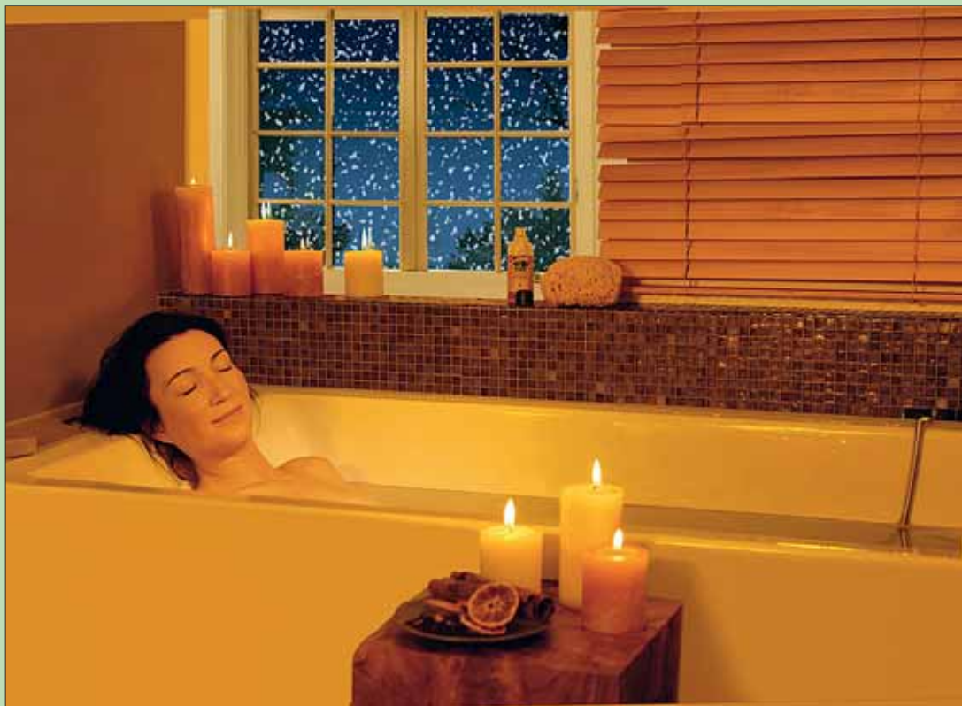
lps/zz. In der kalten Jahreszeit einfach abtauchen in ein Wohlgefühl für alle Sinne.

lps/zz. Wer glaubt, dass Sebastian Kneipp nur für kaltes Wasser steht, der irrt: Seine Empfehlung galt stets auch der Wirkung, die Pflanzen auf das Wohlbefinden und auf die Linderung bei kleinen Beschwerden ausüben können. Besonders wohltuend kann man dies mit den Kneipp-Badezusätzen und warmem Wasser erleben. So schützt pflegendes Mandelöl die Haut durch rückfettende Bestandteile. Wacholder belebt Muskeln nach Anstrengung, Melisse sorgt nach Alltagsstress für Entspannung und Lavendel für harmonische Momente. Roter Mohn und Hanf laden zu einer kleinen Auszeit und Ingwer mit Kardamon einfach zum Hineinsinken und Kuschneln ein. Zu Weihnachten verschenkt, zeigen diese Badeöle, wie sehr einem das Wohlbefinden des Beschenkten am Herzen liegt. Das Geschenkset ist mit diesen sechs Badeklassikern à 20 ml erhältlich. Im Internet können Sie weitere Infos und weitere Produkte ersehen.