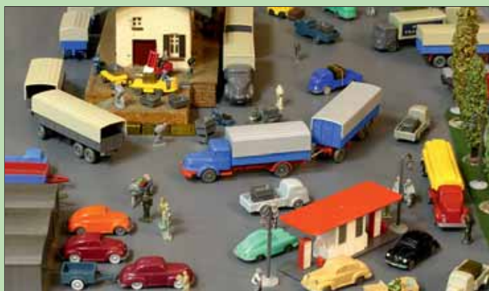
lps/ub. Die große Welt der kleinen Miniaturen zu Beginn der Viking-Ära: Die Verkehrsidee stand in den 1950er-Jahren im Mittelpunkt dieser Philosophie. Zugleich entstand eine in sich geschlossene Spielwelt. Foto: Unverglaste Modelle Wiking

Überraschend ist übrigens das Ergebnis einer Umfrage der Zeitschrift „Eltern family“. Dafür wurden insgesamt 1.754 Kinder und Jugendliche im Alter zwischen acht und 19 Jahren befragt. Knapp die Hälfte der Befragten (49 Prozent) stufte Weihnachtsgeschenke als „wichtig“ ein. Fast genauso viele (46 Prozent) kamen aber zu dem Ergebnis, sie seien „unwichtig“. 55 Prozent gaben an, ganz auf Geschenke verzichten zu können. Und acht Prozent sagten, sie würden auf Geschenke verzichten, wenn ihre Eltern arbeitslos werden.