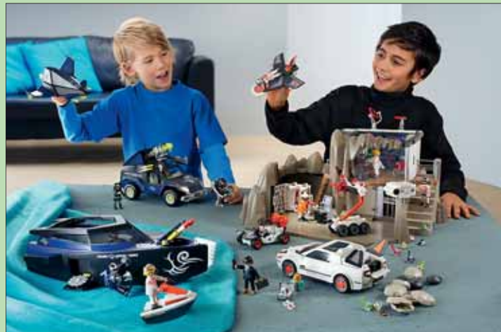
Ips/zz. Die neue Spielwelt ist ein Heidenspaß für kleine Agenten.

iden-Spielfigur Roboman. Zu Lande nutzt die Gang den Robo-Gangster-SUV als fahrendes Hauptquartier. Das Fahrzeug hat eine ausklappbare Satellitenabschussrampe mit schussbereiter Virenkapsel. Die Themenwelt „Top Agents“ richtet sich an größere Jungs ab sieben Jahren, die auch als Agenten im „richtigen Leben“ die technischen Tools, wie das Spionage-Kameraset mit USB-Anschluss und die elektronische Alarmanlage, einsetzen können. Das Agenten-Hauptquartier ist im Spielwarenhandel erhältlich.