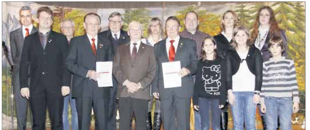
Gratulationen und Urkunden gab es für diese Jubilare des Sängerbundes.

– Am vergangenen Samstag gab es die Jahresabschlussfeier des Sängerbundes im Bürgerhaus. Der Kinderchor eröffnete, unter der Leitung von Theresia