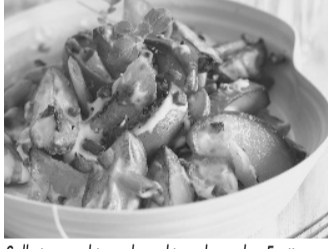
Selbstgemachtes schmeckt auch an den Festtagen am besten: Kartoffelsalat mit Schinken, Apfel und Miracel Whip.