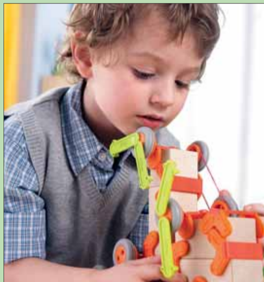
lps/zz. „Technik entdecken“: Mit Baustein-Kupplungen und Räder-Klemmen lassen sich tolle Fahrzeuge konstruieren.

lps/zz. Bausteine kann man nie genug haben – ob Quader, Zylinder, Säulen oder Dreiecke. Seit Generationen faszinieren Bausteine den Nachwuchs. Die Kleinen tasten und fühlen die verschiedenen Formen. Sie sind stolz, wenn der erste wackelige Turm steht und werfen ihn gleich voller Begeisterung um. Schön,