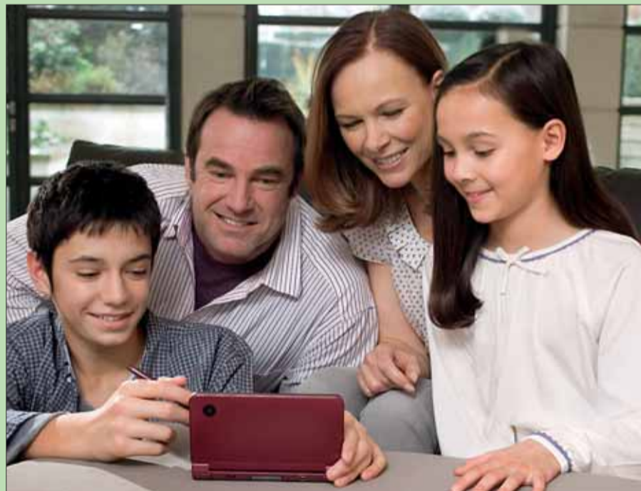
lps/zz. Mit spannenden Familienspielen kommt an den Weihnachtsfeiertagen sicherlich keine Langeweile auf.

vier Spieler eine fröhliche Verfolgungsjagd. Dank der verständlichen Steuerung der Wii ist die Bedienung kein Problem. Der Nintendo DS ermöglicht es, mit „Art Academy“ Zeichen- und Maltechniken auf kreative Weise zu erlernen. „Professor Layton und die verlorene Zukunft“ lädt alle Rätselfreunde zu einer epischen Zeitreise ein. Zum Abschluss stärkt und entspannt „Face Training“ die Gesichtsmuskulatur.