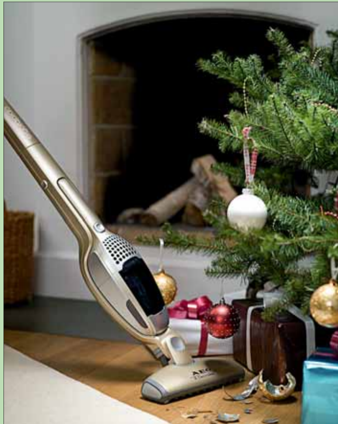
lps/zz. Das sofort einsetzbare Weihnachtsgeschenk: die Design-Akku-Staubsaugerreihe AEG Ergorapido Cyclonic 2in1.

Der designpreisprämierte Sauger ist in den Metallicfarben Stahl, Pistazie, Cassis und Citrus sowie als stärkerer Ergorapido plus AG 904x in Kupfer erhältlich.