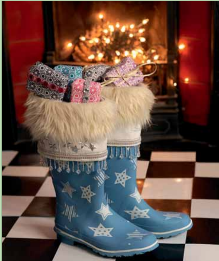
lps/zz. Da kommt der Nikolaus gerne: Eine schöne Idee sind fantasievoll gestaltete Stiefel. Sie können aus ausgemusterten Gummistiefeln und Jeanshosen gebastelt werden.