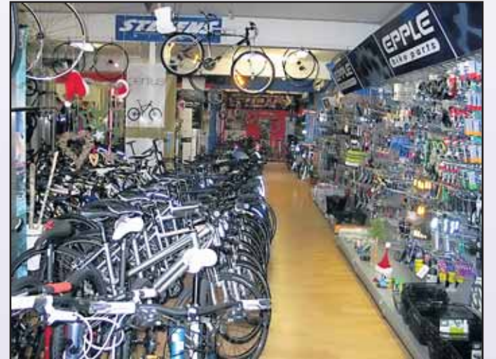
Radsport König, Ferdinand-Porsche-Str. 16a 63500 Seligenstadt, Tel. 06182 / 89 94 94