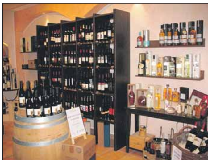
Barletta Feinkost & Vinothek, Marktplatz 763500 Seligenstadt · Telefon 0 61 82 / 78 24 62