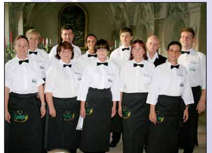
Metzgerei Kuhn, Dieselstraße 7, 63500 Seligenstadt, Tel. 06182 / 2 51 34