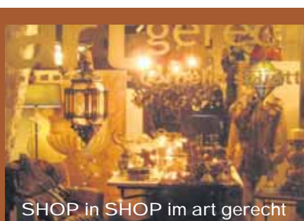
SHOP in SHOP im art gerecht