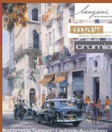
„Christian Sommer“ Laufende Ausstellung

Luitpoldstr. 8 – An Schloss – 63739 Aschaffenburg Tel.: 0 60 21 – 21 83 21 – Fax: 0 60 21 – 37 13 988 E-Mail: argerecht-ab@gmx.de www.artgerecht-aschaffenburg.de