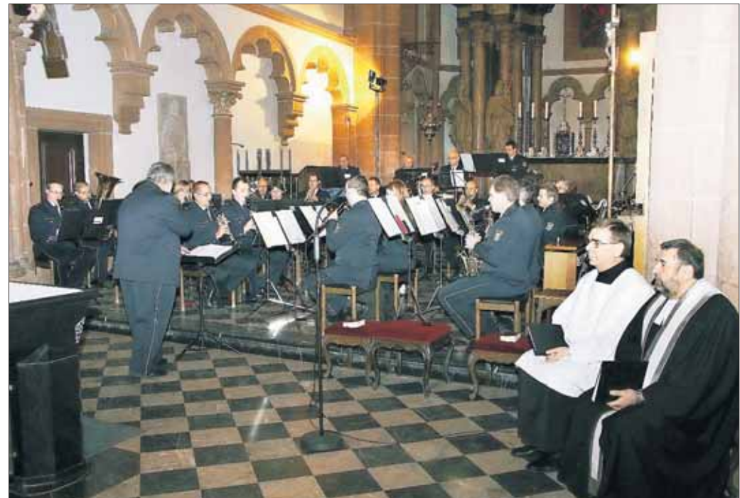
Das Polizeipräsidium Südosthessen hatte gemeinsam mit der evangelischen und katholischen Polizeiseelsorge am vergangenen Samstag einen ökumenischen Gottesdienst unter dem Motto „Miteinander - Füreinander“ gehalten. Für vorweihnachtliche Klänge sorgte das Landespolizeiorchester Hessen.