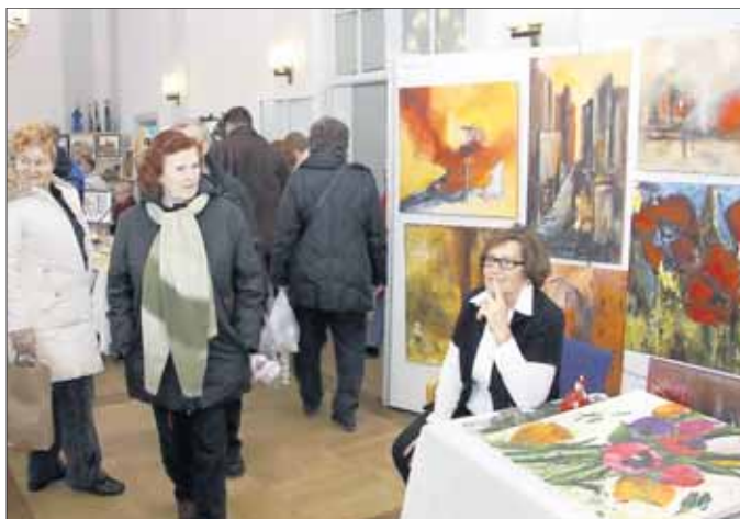
Sehenswerte Galerie im Sitzungssaal des Rathauses.