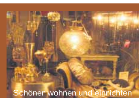
Schöner wohnen und einrichten

Giselastraße 17 · 63500 Seligenstadt 0 61 82 82 68 22 · www.relaxedbeauty.de