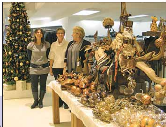
Seligenstädter Kaufhaus Mittl, Freihofstraße 2, 63500 Seligenstadt, Tel. 06182 / 9 33 40