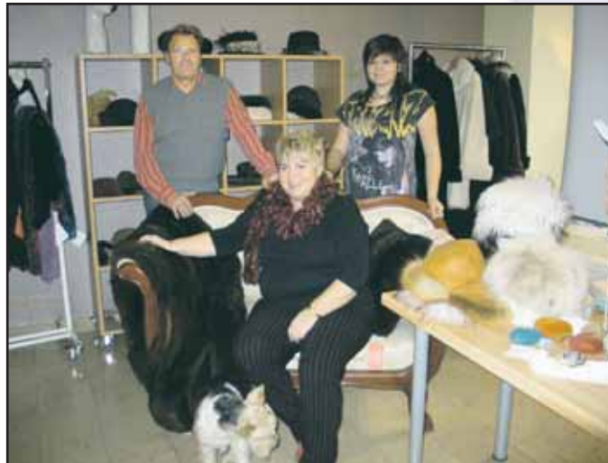
Schenkel MANUFAKTUR, Steinheimer Str. 10 63500 Seligenstadt, Tel. 06182 / 2 38 30