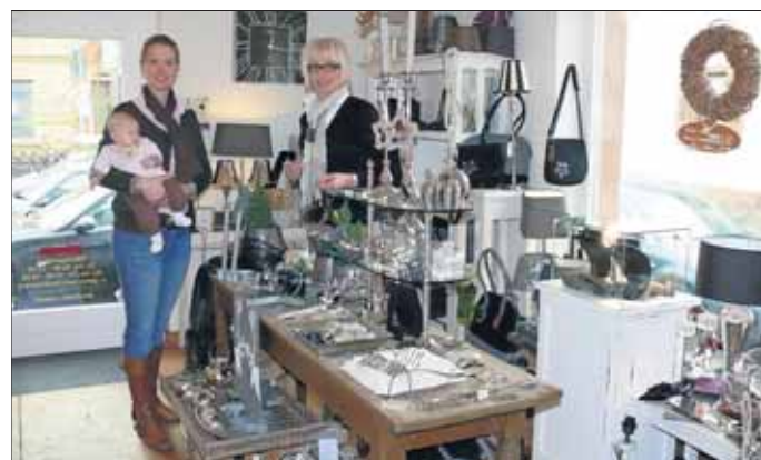
Schmuck und Wohnaccessoires in Schmuckstück und Wohn-Art.