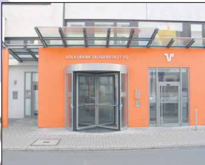
VOLKSBANK SELIGENSTADT EG, Bahnhofstraße 24, 63500 Seligenstadt, Tel. 06182 / 8 90 50