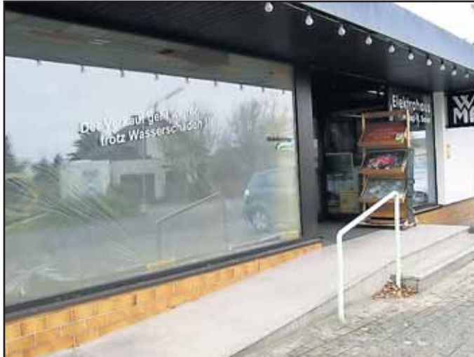
Elektrohaus Baier, Walinusstr. 27 63500 Seligenstadt, Tel. 06182 / 34 70