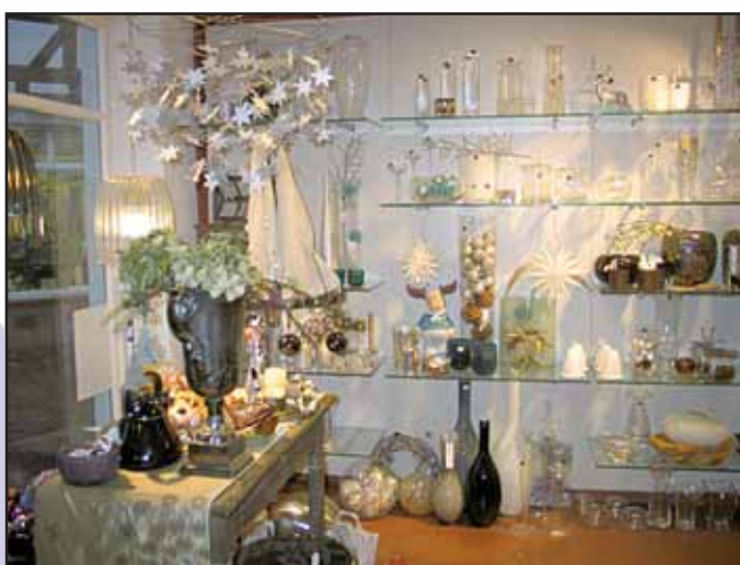
Link Ihr Treffpunkt Zuhause, Freihofstraße 1, 63500 Seligenstadt, Tel. 06182 / 33 01