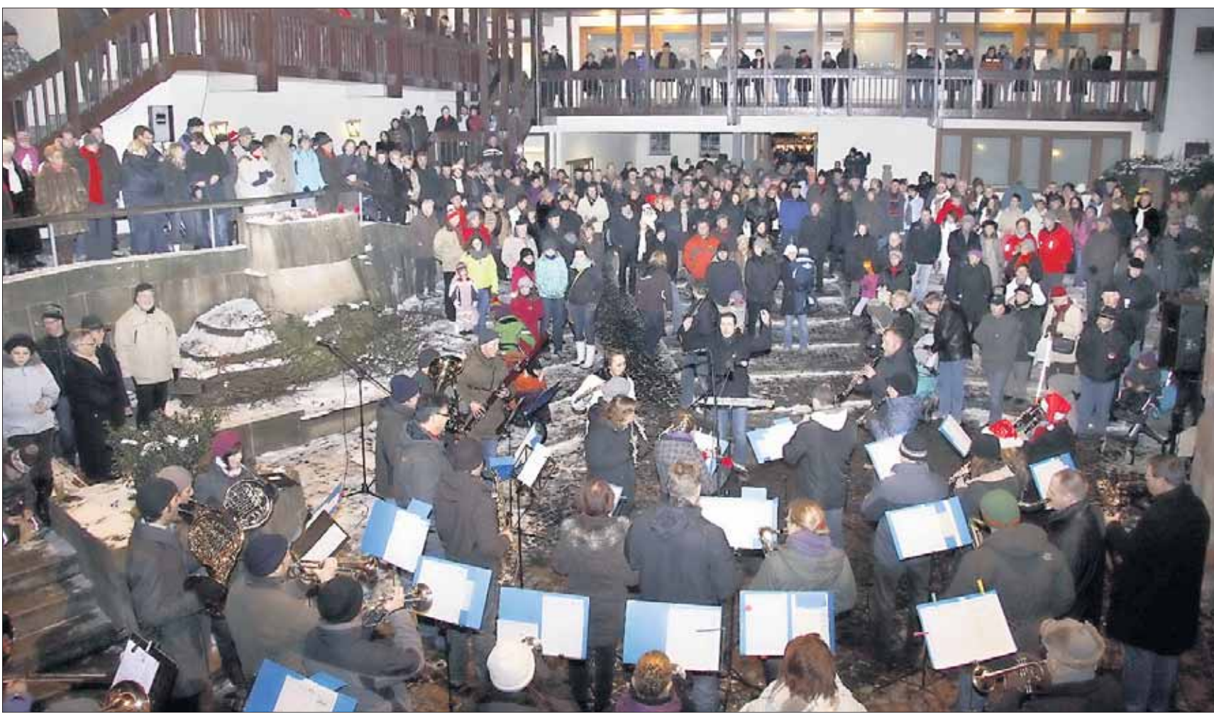
Konzerte zum Advent präsentiert der Heimatbund aus dem Reigen seiner Mitgliedsvereine, die an den vier Adventssonntagen jeweils ab 17 Uhr weihnachtliche Klänge im lichtergeschmückten Rathausinnenhof erklingen lassen. So spielte am vergangene Sonntag die Stadtkapelle (Bild) vor zahlreichen Gästen. Am dritten Advent lädt das Musikcorps der TGS ein und am vierten Advent der Klein-Welzheimer Musikverein.