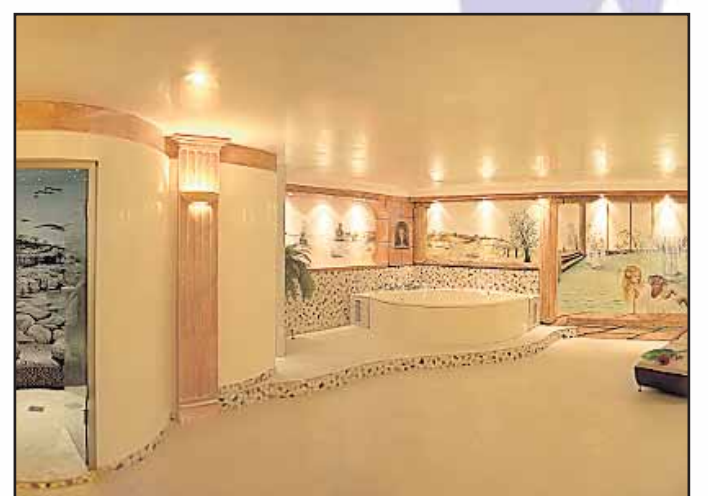
Relaxed Beauty, Giselastr. 17 63500 Seligenstadt, Tel. 06182 / 82 68 22