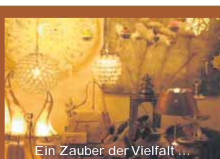
Ein Zauber der Vielfalt ...