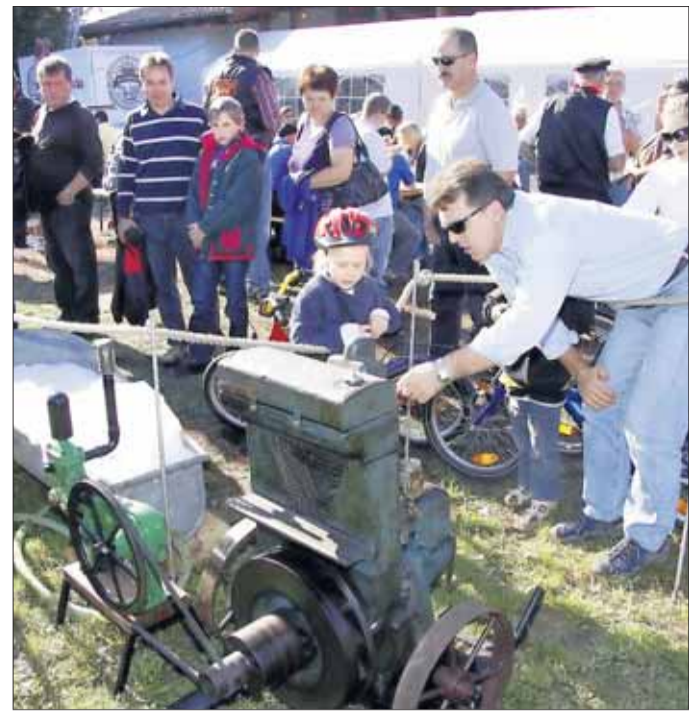
Sonniges Abgühen bei den Traktorenfreunden Seligenstadt: Zahlreiche historische Fahrzeuge und Gerätschaften gab es für viele Besucher zu bestaunen, als die Traktorenfreunde mit dem Abgühen das Ende der Saison feierten. Großes Interesse fand die Dreschmaschine Marke „Fortschritt“ aus dem Jahre 1910 und die Dampfmaschine „Dampfteam Rosenberg“, Leistung ca. 5 PS bei 150 U / min und 6 bar Dampfdruck. Gewicht 800 kg, Brennstoff: Holz oder Kohle. Die Maschine wurde 1885 in England gebaut. Sie diente dort in einer Hopfenplantage zum Antrieb einer Wasserpumpe. Diese Dampfmaschine ist das einzige noch erhaltene Exemplar dieser Bauart der Fa. Hindley. Die Maschine wurde im Jahr 2000 in England erworben und von Grund auf restauriert. Die Leistung reicht aus, um Kreissägen, Schmiedehämmer und kleinere Dreschmaschinen anzutreiben. Unsere Bilder zeigen Fahrzeuge der Hainburger Traktorenfreunde (links), den Vorsitzenden Peter Laube beim Bieranstich (Mitte, rechts) und begeisterte Zuschauer bei den Stationsmotoren.