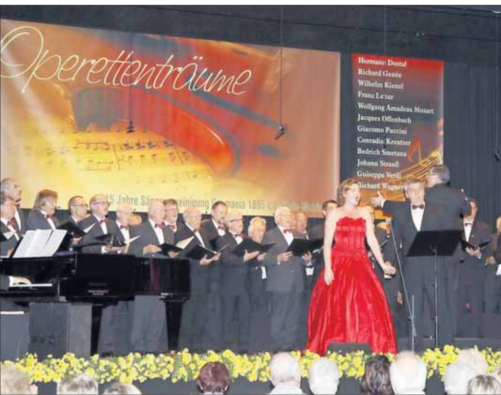
Operettenträume erlebten die begeisterten Gäste der Sängervereinigung Germania im Bürgerhaus. Chor und Solisten boten ein faszinierendes Konzerterlebnis.

„Les Comédiens de la Tour“ am Wochenende: