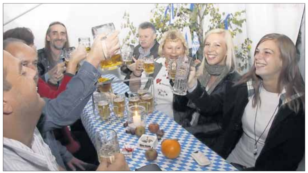
Ein zünftiges Oktoberfest feierte der Gesangverein Germania Hainstadt am vergangenen Samstag. Im beheizten Fesztelt am Vereinsheim fanden sich bereits zum Bieranstich zahlreiche erwartungsfrohe Gäste ein, denn die Organisatoren boten ein buntes Programm.

und um 17.05 Uhr in Froschhausen. Anmeldungen für diese Theaterfahrt nimmt bis 28. Oktober Christa Süßmann, ☎ 28030, entgegen.