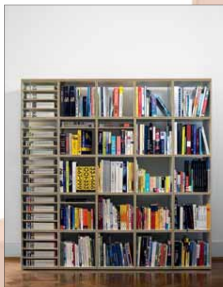
Ips/Bo. Modulmöbel passen in jede Wohnung.

Ips/Bo. Möbel, die mitwachsen, sind die idealen Partner für alle, die sich öfter mal verändern wollen. Derartige Modulmöbel passen sich jeder Wohnsituation an. Heute noch Bücherregal, morgen CD-Ständer und übermorgen Espresso-Station – Modulmöbel sind geniale Multitalente. Auf- und Umbau funktionieren nach dem Baukastenprinzip. Die dünnen Holzplatten werden mithilfe einer Kunststoffolie zum Würfel verspannt, ganz ohne Schrauben, Bohren oder Hämmern. Einzelne Module lassen sich innerhalb weniger Minuten ohne Werkzeug einfach zusammenstecken. Der nächste Umzug wird damit zum Kinderspiel. An jeden Würfel kann ein weiteres Modul angebaut werden. Form und Funktion können jederzeit variiert werden. Die Leichtgewichte halten Belastungen von bis zu 300 Kilogramm stand.