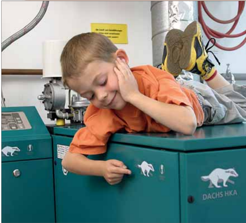
Ips/Bo. Ein Mini-Blockheizkraftwerk senkt die Energiekosten.

wärme umsetzen. Mit einem Austausch des alten Kessels lässt sich daher rund ein Viertel der Heizkosten sparen. Heizungsrohre sollen nicht den Keller heizen. Dämmstoff-Schläuche aus Schaumstoff, die einfach über die Rohre gestülpt werden, können hier Abhilfe schaffen. Eine gute Idee ist auch ein Pufferspeicher, in dem die Wärme gesammelt wird. Nicht benötigte Wärme kann hier gespeichert werden.