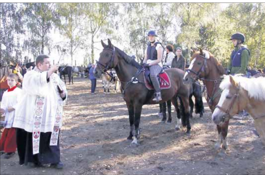
Einen Segnung der Pferde und Reiter gab es nach dem gemeinsamen Ausritt der Interessengemeinschaft für Pony- und Pferdesport Hainburg (IPPF) und Freunden am vergangenen Sonntag. Die Segnung fand unter Mitwirkung der Jagdhorngruppe „Reiterliche Jagdhornbläser Maingau“ auf dem IPPF-Gelände statt. Im November hat die Fahrerabteilung der IPPF ein Parcoursfahren organisiert. Am Sonntag, 21. November, können sich Vereinsmitglieder und befreundete Fahrer im Kegel- und Hindernisfahren messen.