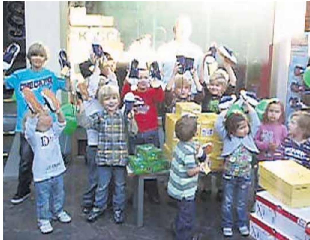
Zwölf Kindern konnte die Firma Schuhhaus Franz/Quick-Schuh in Seligenstadt den neuen, gesunden Kinderschuh der Firma Joya schenken. Dieser Joysy ist weicher als alle anderen Kinderschuhe und besitzt eine exzellente Passform. Die besondere Sohle trainiert eine aufrechte Körperhaltung, stärkt die Muskulatur und versorgt die Füße immer mit frischer Luft.

Weimarer Kultur-Express zu Gast in der Einhardschule: