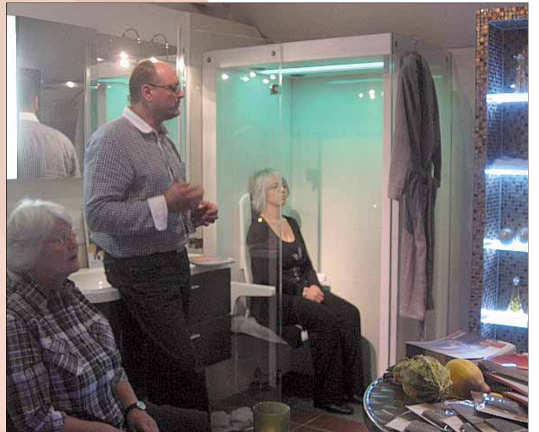
Die Firma W. Hillenbrand GmbH in Seligenstadt stellte am 6. Oktober 2010 in Ihren Ausstellungsräumen die neue Physiotherm Infrarotkabine vor. Den Besuchern wurde die Möglichkeit gegeben, die wohltuende Wirkung der Infrarotwärme während der Veranstaltung zu erleben. Die Firma Hillenbrand ist erreichbar unter 06182-25203 und www.hillenbrand-baederstudio.de