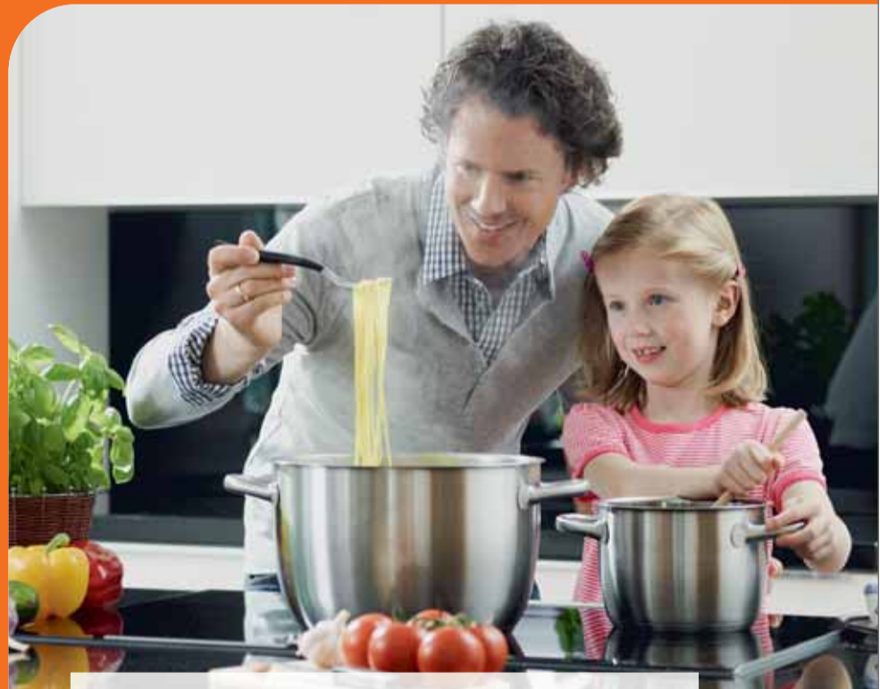
Wir planen schon heute für die Zukunft. Unsere Bank steuert die passenden Finanz- und Vorsorgelösungen bei. Und die sind nicht nur komplett durchdacht, sondern außerdem so flexibel, wie man es auch als Familie sein muss. So ist sie eben: unsere VVB.

VVB-Beratungsqualität – vom TÜV zertifiziert