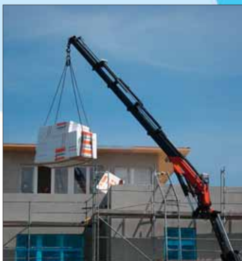
Ips/Cb. Unser Bild: Penthouse-Neubau

auch die Zulage geringer aus. Das Finanzamt prüft, ob sich neben der Zulage eine zusätzliche Steuerersparnis durch Abzug der Beiträge als Sonderausgaben ergibt. Weitere Vorteile eines solchen Bausparvertrages sind: Man bekommt ein zinsgünstiges Bauspardarlehen. Die Tilgungsbeiträge für das Darlehen wählt man innerhalb einer Bandbreite selbst. Es sind jederzeit Sondertilgungen in beliebiger Höhe möglich. Das Bausparguthaben wird verzinst. Die Guthabenzinsen unterliegen nicht der Abgeltungssteuer. Für das Bausparguthaben besteht ein Wahlrecht auf Umwandlung in eine lebenslange Rente. Mit den Riesterzulagen als Extratilgung verkürzt sich die Darlehenslaufzeit und man spart Darlehenszinsen. Individuelle Konzepte sichern eine Finanzierung bis zu 100 Prozent des Kaufpreises.