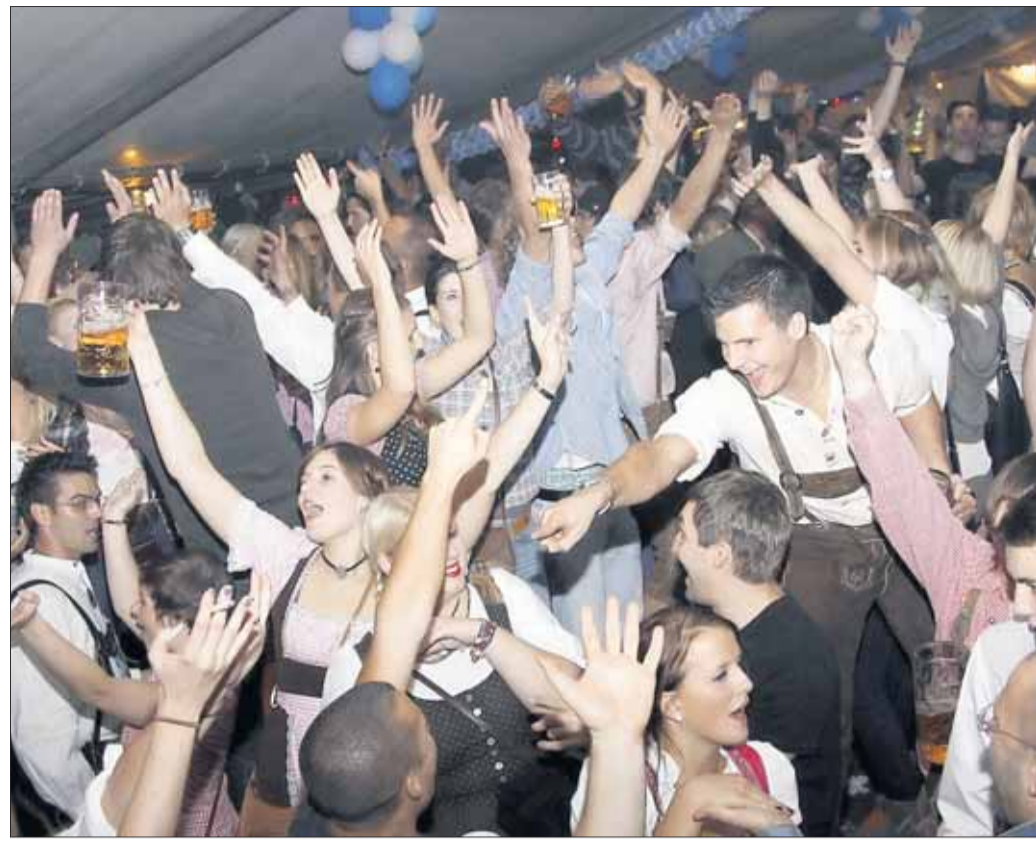
Schöner kann die Wies'n nicht sein: Richtig rund ging es beim Oktoberfest des Vereins Schwesternhaus im Festzelt auf dem Kolpinggelände. Zünftige bayerische Speisen und Bierspezialitäten wurden serviert. Am Samstagabend sorgten Blech und Co und DJ Alex für gute Stimmung. Mit Dicke-Backen-Musik startete der Frühschoppen am Sonntag.