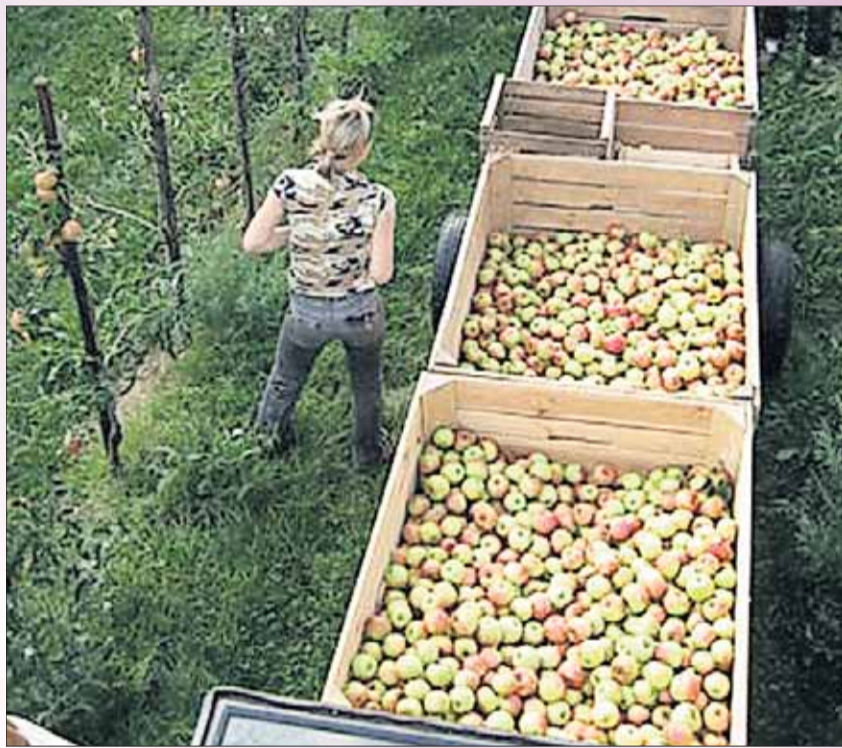
Die dritte Schätzaufgabe präsentiert Ihnen der „Obsthof Hauenstein“ in Krombach:

Und nun viel Glück und viel Spaß bei unserer Schätzaufgabe.