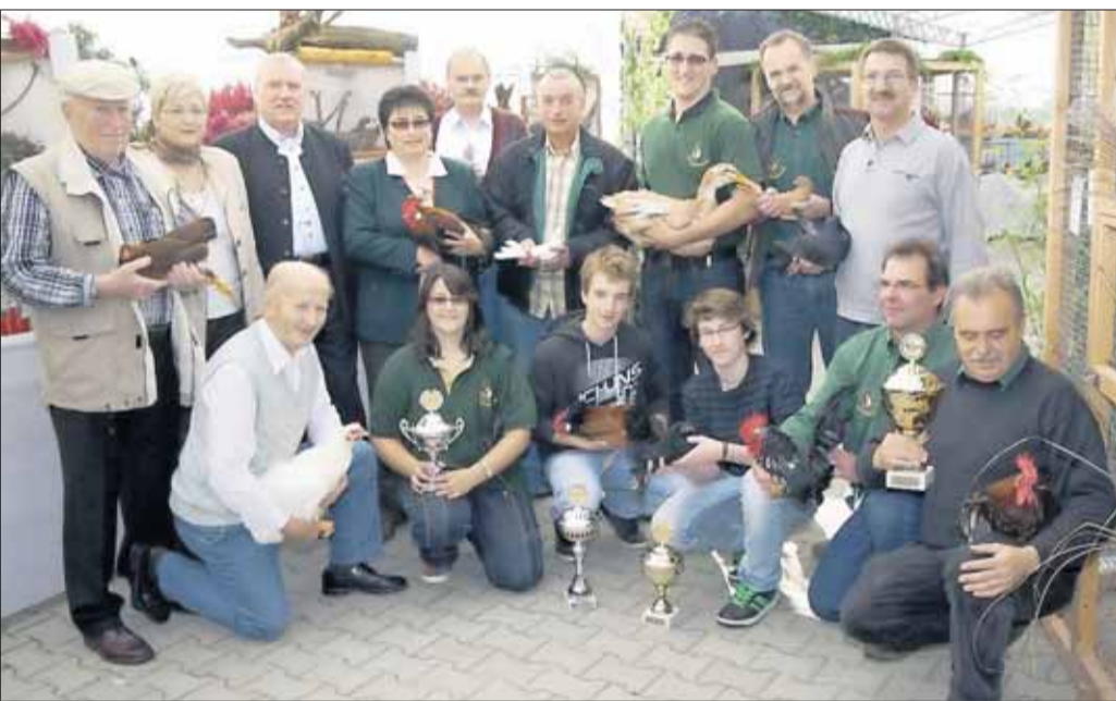
Strahlende Pokale und Gesichter bei den erfolgreichen Seligenstädter Geflügelzüchtern. Die Lokalschau brachte Bestnoten hervor und fand breite Beachtung.