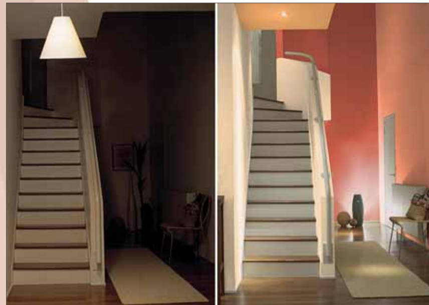
Ips/Bo. Auch der Flur gewinnt durch Licht und Farbe.

Wandflächen aktiv an der Lichtwirkung beteiligt sein. Eine farbige Gestaltung mit Glanzeffekten verleiht Räumen eine hochwertige Anmutung.