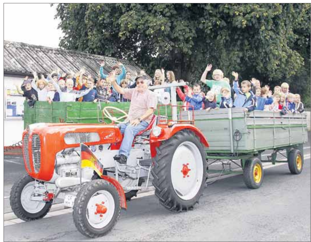
Zum Abschluss der Klein-Krotzenburger Ferienspiele gab es eine Fahrt durch den Ortsteil. Verteilt auf vier Traktoren samt Anhänger chauffierten die Traktorenfreunde Hainburg die Mädchen und Jungen durch die Straßen. Am Abend stand die Abschlussfeier mit den Eltern auf dem Programm.