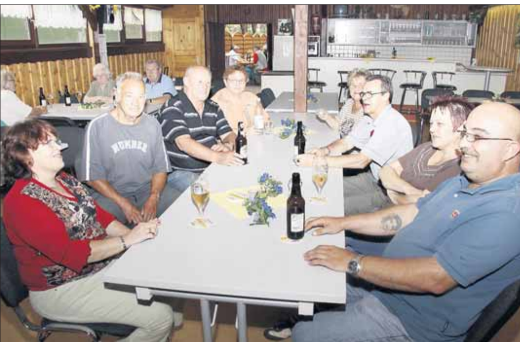
Das Sommerfest des Obst- und Gartenbauverein musste nach innen verlegt werden. Die Mitglieder und Gäste nahmen's sichtlich gelassen und verbrachten gesellige und heitere Stunden bei frohen Runden.

um 18 Uhr der ersten Mannschaft mit dem Punktspiel der Kreisliga A Offenbach gegen Germania Bieber vorbehalten. Das Fußballwochenende beginnt allerdings bereits am Freitag, 27. August, ab 18 Uhr mit einem AH-Turnier. Schon das Teilnehmerfeld mit TUS Froschhausen, Germ. Babenhausen, Germ. Großwelzheim, Sportvereinigung Hainstadt, Germ. Dettingen und SV Stockstadt garantiert unterhaltensamen AH-Fußball. Am Samstag um 17.30 Uhr trifft die „Zweite“ der TSG im Punktspiel der Kreisliga C auf Hainhausen II. Zuvor schon können in der Vereinsgaststätte der TSG ab 15.30 Uhr auf Großleinwand bei SKY die Bundesligaspiele des Tages verfolgt werden. Für das gesamte Fußballwochenende gilt: Eintritt frei.