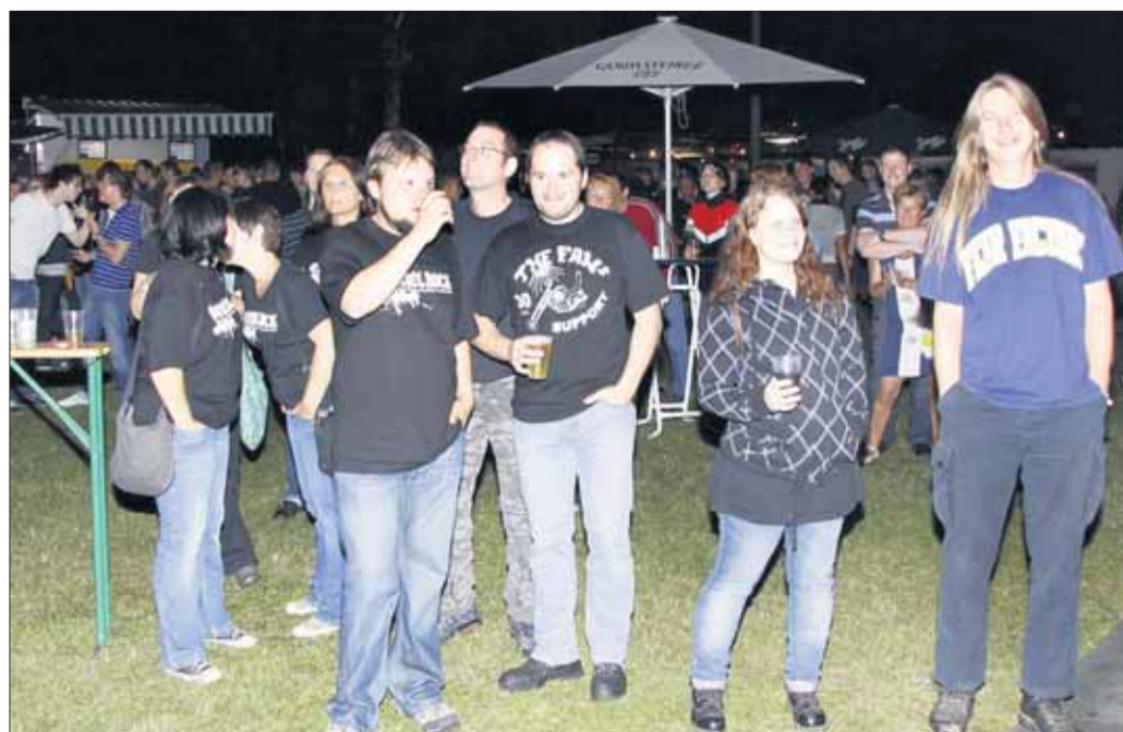
„Bembelrock“, ein Rock-Festival mit Kultcharakter und namhaften Coverbands, veranstaltete der Motorradclub „The Fans“ am Samstag auf dem Gelände des Hundesportclubs Zellhausen. Für Musik sorgten Straitaus Quo, Fight Footers, Satan Hansa und Live Wire. Infos gibt es unter www.thefansmc.de.