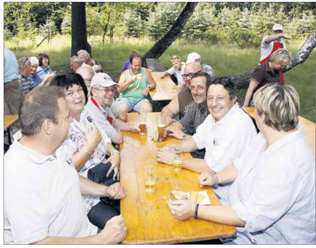
Zum traditionellen Familientag hatte die Gesellschaft der Freunde in den Stadtwald an Brehms Hütte eingeladen und konnte mit zahlreichen Mitgliedern und Freunden einen angenehmen, sommerlichen Tag im Wetterglück genießen.

Für Informationen steht gerne Elisabeth Emadi in der Geschäftsstelle der VHS, ☎ 06182 3569, zur Verfügung. Das Büro in der Steinheimer Straße 6 ist jeweils dienstags und donnerstags von 9.30 bis 11.30 Uhr geöffnet (nicht in den Schulferien). Ihre Anmeldung können Sie aber auch einfach per Post oder E-Mail: vhs-seligenstadt@t-online.de zuschicken.