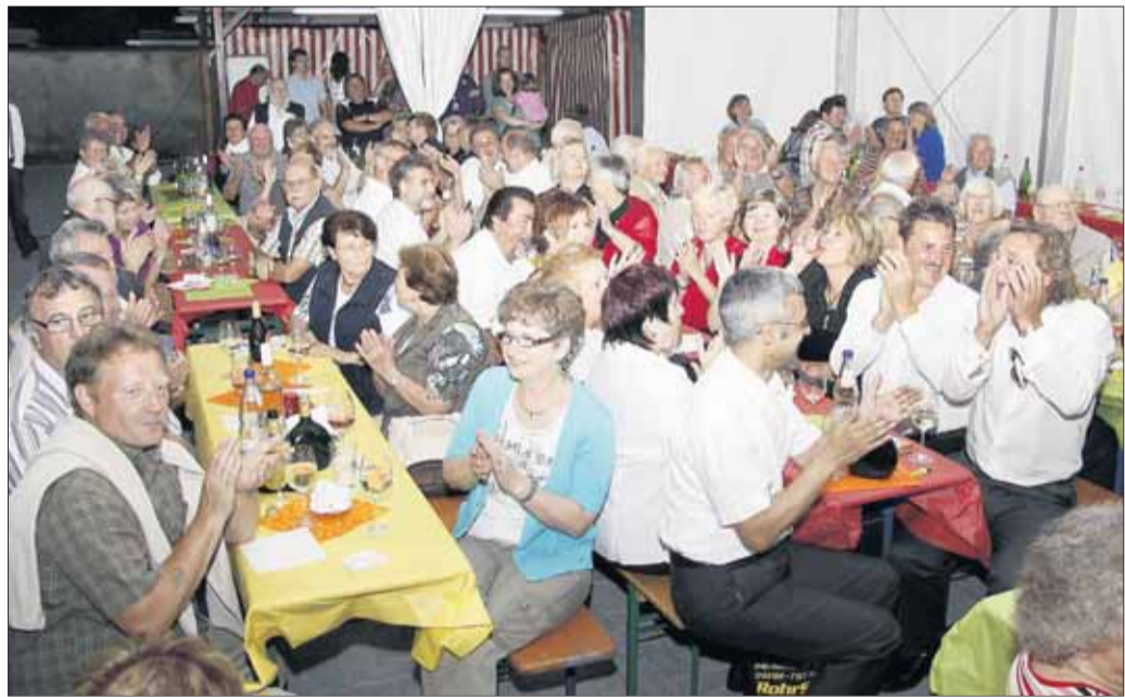
Der dritte musikalische Weinabend des Gesangvereins Liederfreund Hainstadt erlebte begeisterten Zuspruch. Allerlei Schmankerl und Käsespezialitäten sowie Frankenweine im Ausschank, gute Stimmung durch Beiträge mehrere Chöre, die in verschiedenen Zusammenstellungen Lieder darbrachten, erfreuten sich großer Beliebtheit. Unter dem Motto „150 Jahre Friedrich Silcher - Volksliedersingen“ beging der Liederfreund sein Weinfest.