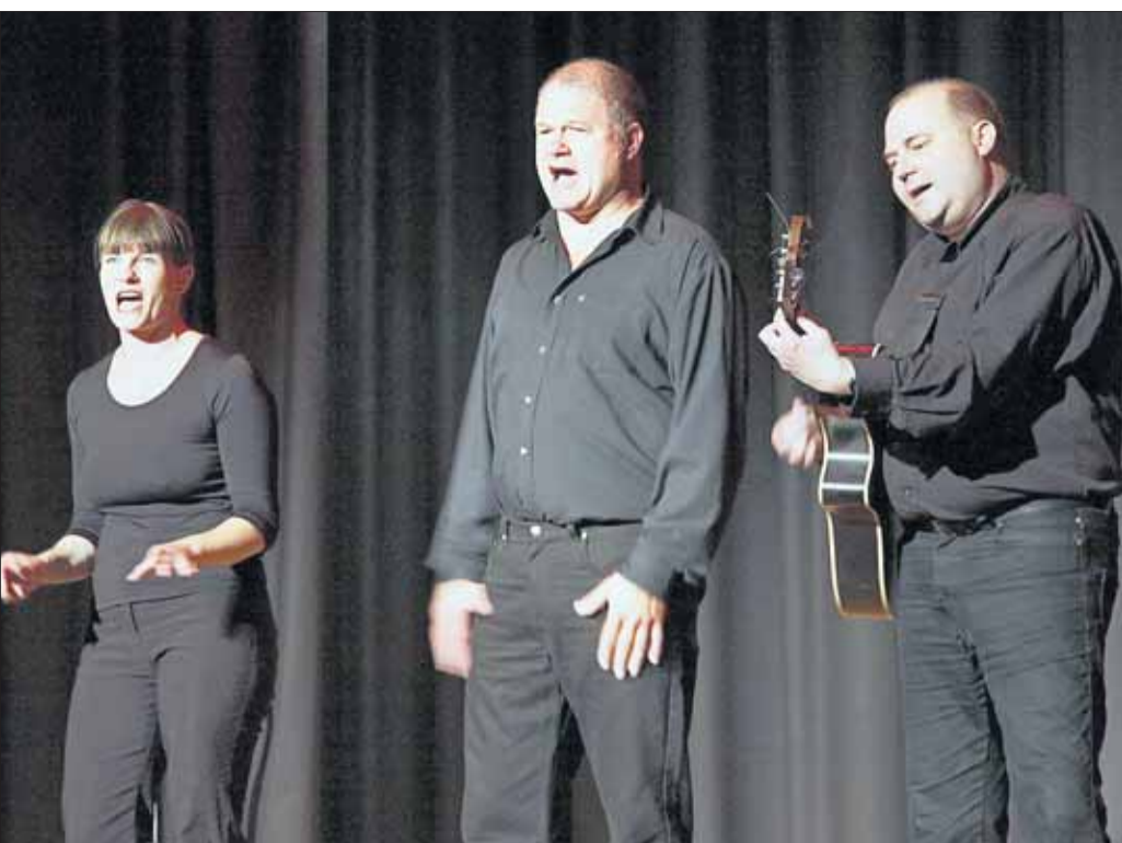
Szenen und Anekdoten über unseren oft nicht gewollt komischen Alltag präsentierten die Akteure der Schmiere.

Die „Schmiere“ brillierte im Riesensaal: