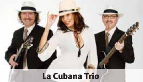
La Cubana Trio

Samstag, 21. August 2010 von 12 bis 23 Uhr und Sonntag, 22. August 2010 von 11 bis 21 Uhr