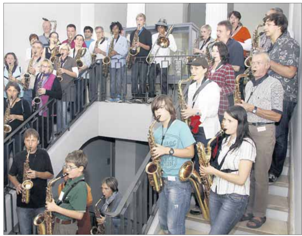
Das Finale des zweiten Seligenstädter Saxophonsfestivals am Sonntagnachmittag fiel ins Wasser. Ein heftiger Regenschauer machte den geplanten gemeinsamen Auftritt aller Teilnehmer auf dem Marktplatz unmöglich. Für das Schlussbild unseres Fotografen versammelten sich die Akteure statt dessen im Treppenhäus des Rathauses. Zuvor stand die Einhardstadt, wie ausführlich berichtet, vier Tage lang ganz im Zeichen des Saxophons. Workshops für Anfänger und Fortgeschrittene standen im Mittelpunkt.