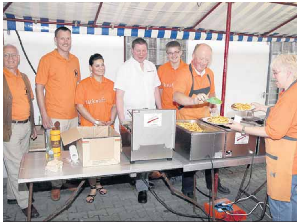
Trotz Regens fanden sich viele Besucher zum Kolping-Sommerfest ein. Vor allem die Kinder hatten viel Spaß beim Vorlesen und bei der Zaubershow, bei der sie selbst mitzaubern konnten. Auf dem Spielplatz haben sich die Kinder mal wieder so richtig austoben können, trotz Regen. Jung und Alt genossen das reichhaltige Angebot an Speisen und Getränken.