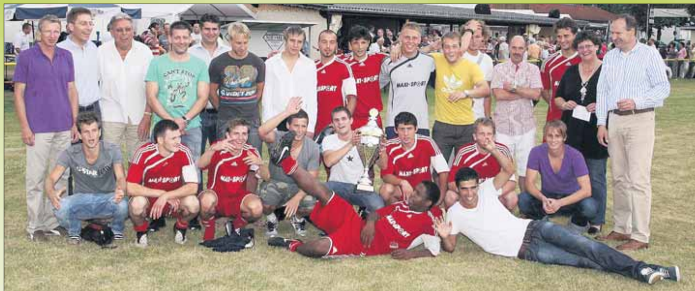
Mainpokalsieger 2010: Die Sportfreunde Seligenstadt.