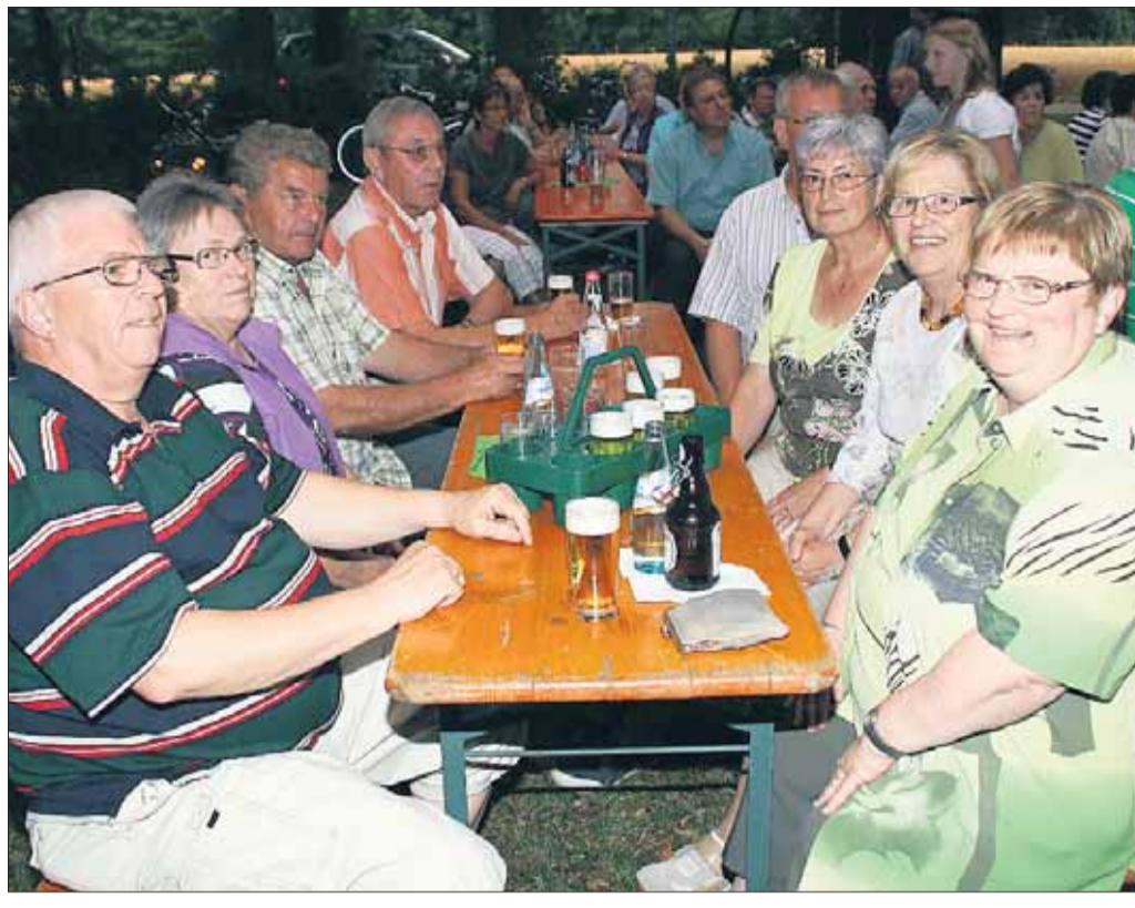
Für Speisen und kühle Getränke war bestens gesorgt beim Grillfest des Gesangsvereins Liederkrantz Klein-Welzheim, auf ihrem Vereinsgelände „Im Gieren“. Mitglieder, Freunde und Gönner des Vereins verbrachten einige schöne Stunden bei sommerlichen Temperaturen, in geselliger Runde.

freund, Am Sandborn, statt. Das Caritas-Kleiderlager der Basilika-Pfarrei an der Vautheigasse ist vom 28. Juli bis einschließlich 11. August geschlossen. Ab Mittwoch, 18. August, ist das Kleiderlager wieder von 15 bis 17 Uhr wöchentlich geöffnet. In der Zeit werden auch Kleiderspenden entgegengenommen. Zum zehnten Mal treffen sich die Ehemaligen von AEG und Nachfolger Schneider Electric in Seligenstadt. Ein großes Hallo wird es geben am Freitag, 27. August, ab 18 in der Brauerei-Gaststätte Klein am Bahnhof eintreffen. Weitere Infos unter 3353.