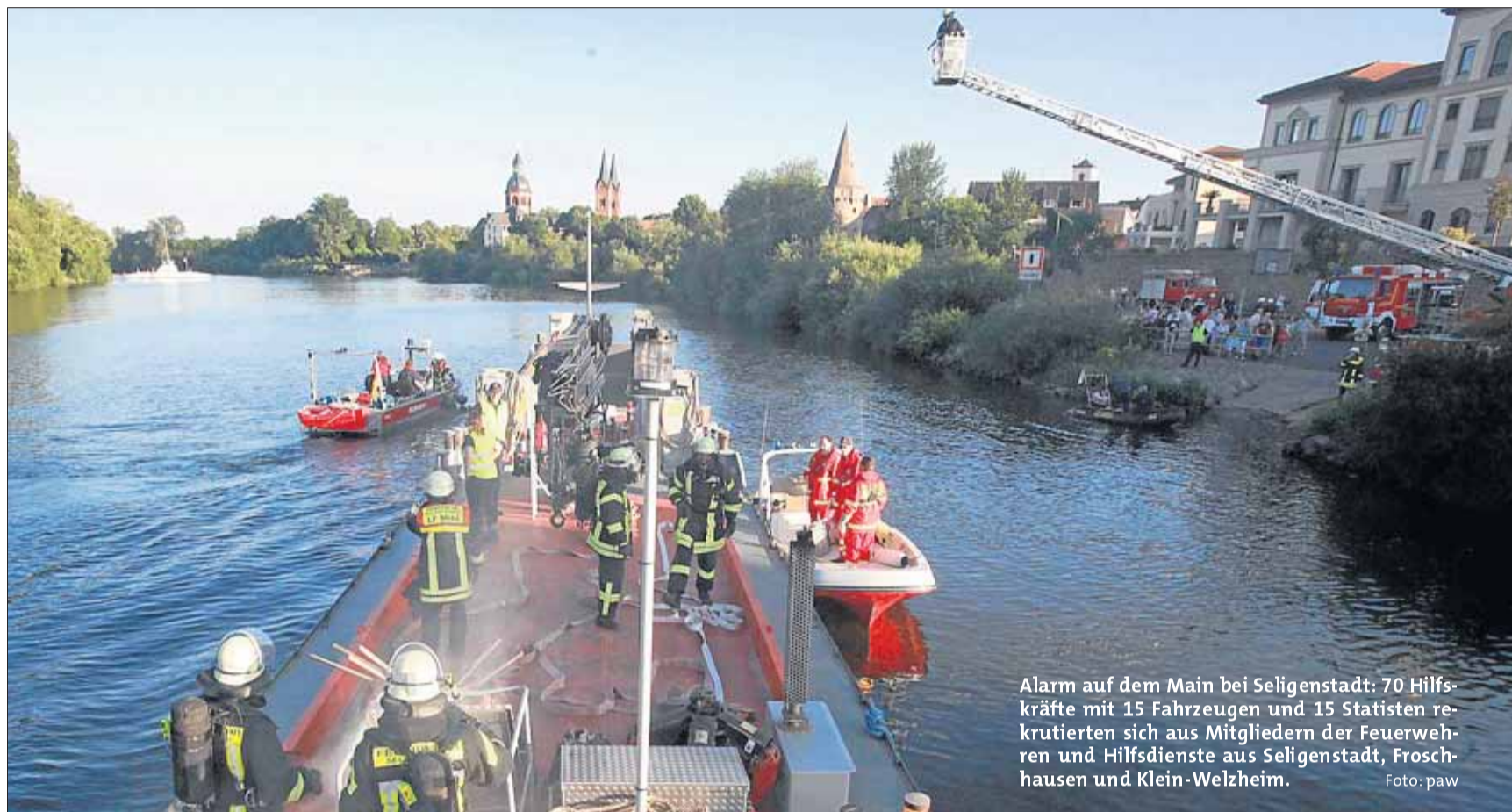
Alarm auf dem Main bei Seligenstadt: 70 Hilfskräfte mit 15 Fahrzeugen und 15 Statisten rekrutierten sich aus Mitgliedern der Feuerwehren und Hilfsdienste aus Seligenstadt, Froschhausen und Klein-Welzheim.

nem Sängerkor, es haben sich bereits etliche befreundete Chöre aus Seligenstadt und Umgebung angesagt. Auch die Speisekarte bietet für jeden etwas, so gibt es neben den üblichen Rindsbrat- Fleischwurst und Pommes auch Hackbraten und nur samstags Haxen. Zum sonntäglichen Mittagessen lädt dann zusätzlich der beliebte und mittlerweile zur guten Tradition gewordene Kaiser-Karl-Braten mit Serviettenknödeln sowie ein Fischgericht mit Nudeln ein. Ab 14 Uhr öffnet dann die TGM-Bäckerei mit feinsten selbstgebackenen Kuchenspezialitäten. Wie man sieht ist also kulinarisch und musikalisch bestens für das Wohl der Gäste gesorgt.