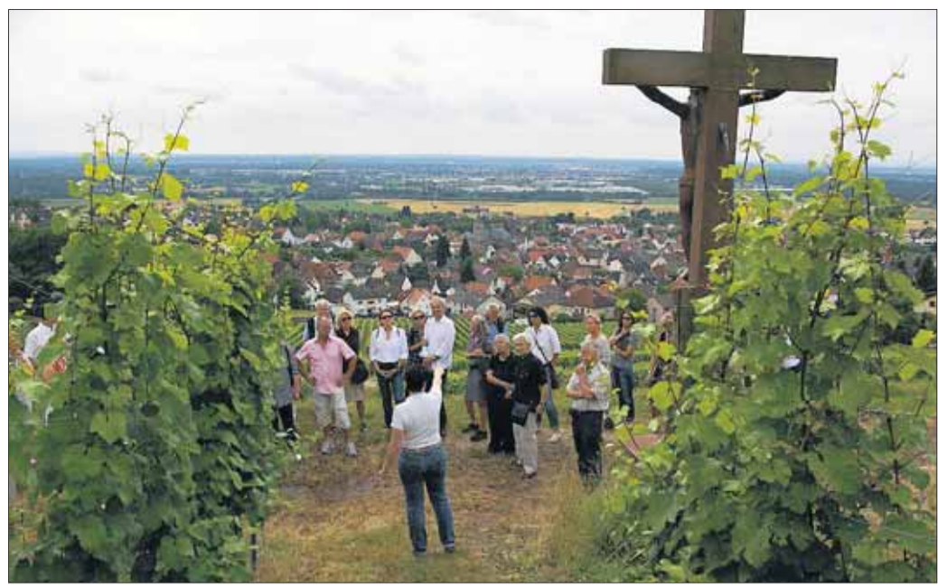
Führung durch die Weinberge - hoch über Hörstein mit Blick ins Maintal.