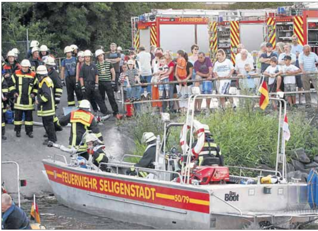
Zahlreiche Zuschauer hatten die Einsatzkräfte, die bei hochsommerlichen Temperaturen eine Havarie auf dem Main zu bestehen hatten.

„Das WSA zeigte sich als vorbildlicher Kooperationspartner. Es stellte uns ohne großes Zögern das Arbeitsschiff „Kinzig mit seiner Besatzung und zwei Leichter für die Übung „Schiffsunfall“ auf dem Main zur Verfügung. Während der Übung war der Fluss nicht gesperrt. Die Berufsschiffahrt konnte den Handlungsort ungehindert passieren. Das von vielen Gästen beobachtete Spektakel endete gegen 22 Uhr.