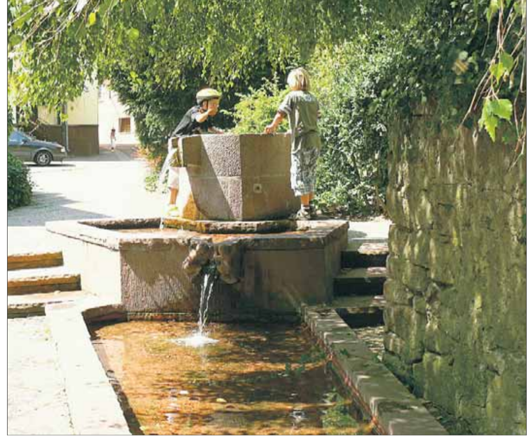
Abkühlung ist in diesen Hundstagen gefragt und so ist der Rote Brunnen eine beliebte Anlaufstelle, vor allem für die AltstadtKinder. Im Schatten der alten Birke kann nach Herzenslust geplantscht werden.

Bilanz ermöglicht es, die Maßnahmen auf ihre Wirksamkeit hin zu prüfen und anzupassen. Die Erstellung eines Klimaschutzkonzeptes durch Dritte oder die fachliche Beratung bei der Erstellung wird vom Bundesministerium für Umwelt, Naturschutz und Reaktorsicherheit (BMU) mit einem Fördersatz von derzeit 70 Prozent bezuschusst, heißt es abschließend