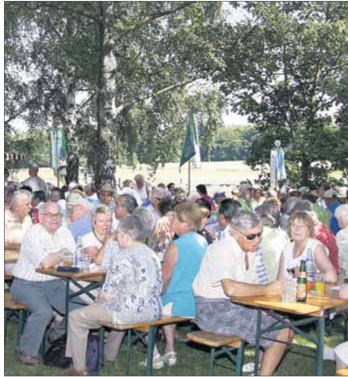
Gemütliche Rast unter schattigen Bäumen.

den Bezirken 1, 7 und 11 um jeweils 10 Euro/qm gestiegen. Bürgermeisterin Dagmar B. Nonn-Adams berichtet, dass die Bodenrichtwerte sich nun abhängig von der Lage der Grundstücke folgendermaßen darstellen. Wohnbaufläche: 360 bis 400 Euro/qm; Mischbaufläche: 270 bis 330 Euro/qm; Gewerbefläche: 140 bis 180 Euro/qm; Landwirtschaftliche Fläche: 4,50 bis 5,00 Euro/qm Die Bodenrichtwerte können als Liste und in Kartenform im Rathaus oder auf der Homepage (www.seligenstadt.de) eingesehen werden.