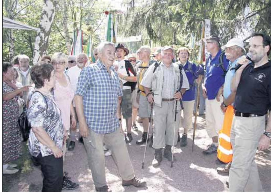
Große Freude beim Empfang der Wimpelgruppe. Nach und nach trafen 900 Wanderer ein.

Wanderclub Edelweiß richtete großes Spessartbundesfest mit mehr als 1 000 Gästen aus: