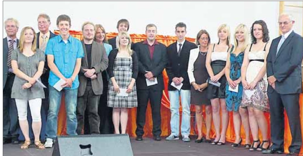
Stolz auf beiden Seiten: Die Klassenbesten mit ihren Lehrern.