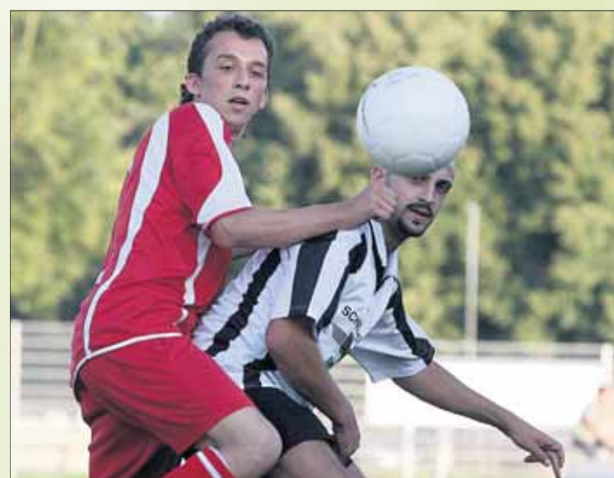
Spannende Zweikämpfe prägen den Mainpokal ebenso, wie die vielen Tore, die jährlich erzielt werden.