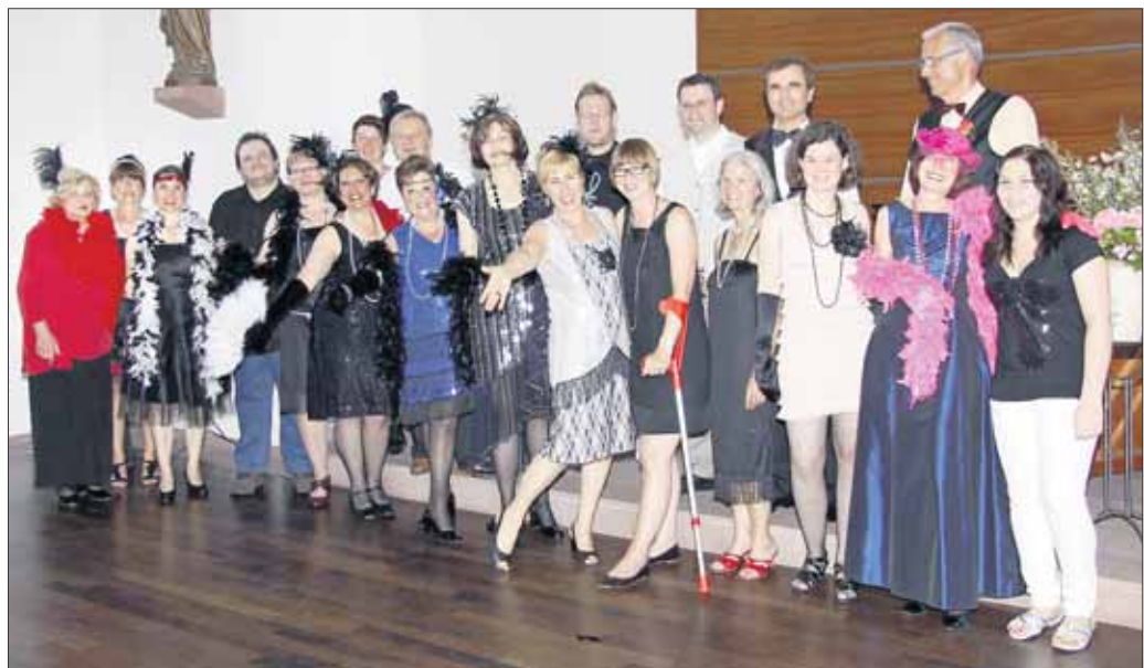
Das Vokalensemble „Con Piacere“ entführte sein Publikum in die „Goldenen Zwanziger“ des vergangenen Jahrhunderts. Musikschüler der Gesangsklasse von Pavlina Georgiev präsentierten im Edith-Stein-Saal beliebte Schlager, Evergreens und Lieder der Berliner Operette.

Gartenwasserschlauch Tricoflex, 5-schichtiger Schlauchaufbau, Innen-Ø 12,5 mm, 2,6 mm Wandstärke, 1/2", Berstdruck 25 bar, 30 m lang, 20 Jahre Herstellergarantie