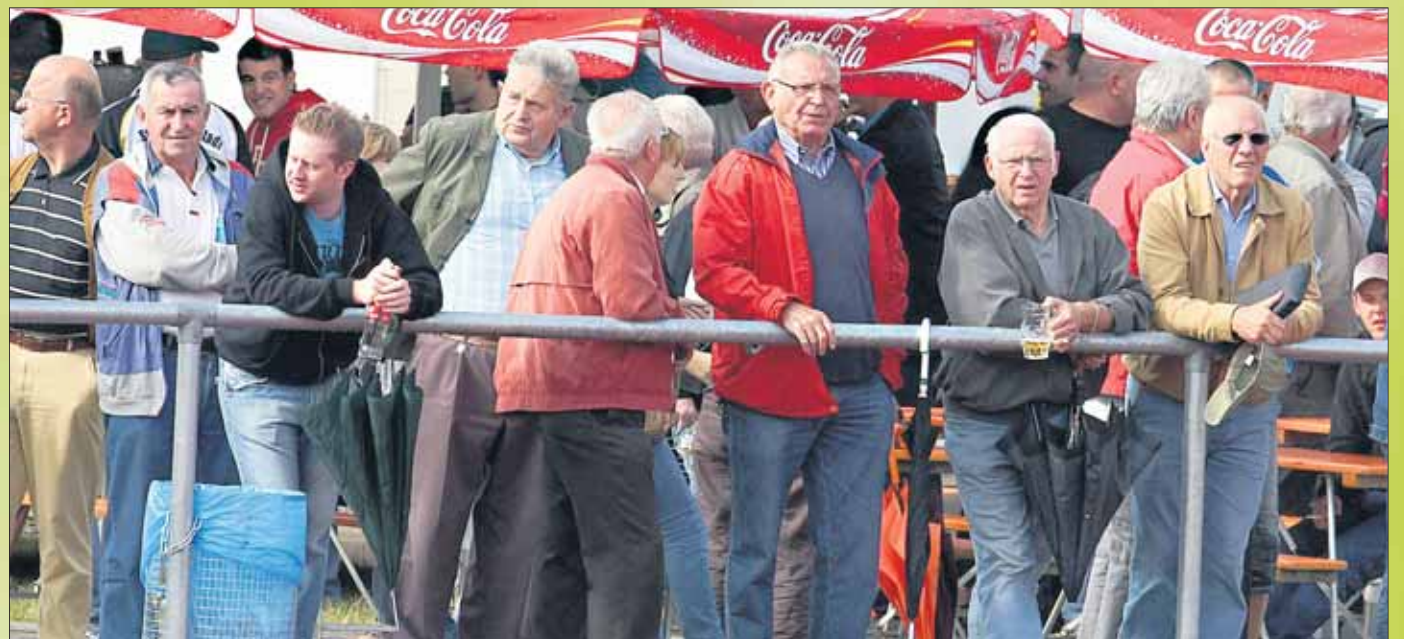
Kritischer Blick auf das Geschehen auf dem grünen Rasen: Die Besucher des Mainpokal-Turniers.