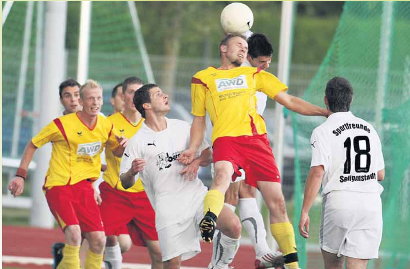
Eine Szene aus dem Finale 2009: Die TuS Klein-Welzheim (gelbe Trikots) und die Sportfreunde Seligenstadt lieferten sich ein packendes Duell, das der Verbandsligist schließlich mit 2:1 gewann.

Auch 2010 könnten sich beide Mannschaften im letzten Turnierspiel wieder gegenüberstehen. Die Klein-Welzheimer starten in der Vorrundengruppe A, die „Roten“ aus der Einhardstadt in der B-Gruppe. In der A-Gruppe steht unter anderem der ewig junge Vergleich zwischen den beiden Mainhäuser Stadtteilvereinen Mainflingen und Zellhausen an. Bereits am Dienstag, 6. Juni, treffen die beiden Mainhäuser Mannschaften, die zukünftig gemeinsam in der A-Liga Offenbach Ost spielen, aufeinander.