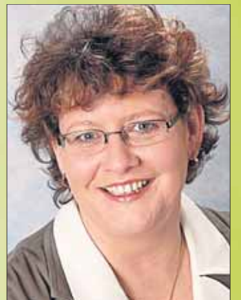
Fußballfans bei den Spielen zu treffen.

Dem diesjährigen „Mainpokal“ wünsche ich daher viele schöne und faire Spiele und es möge der Beste gewinnen. Ich freue mich darauf, viele