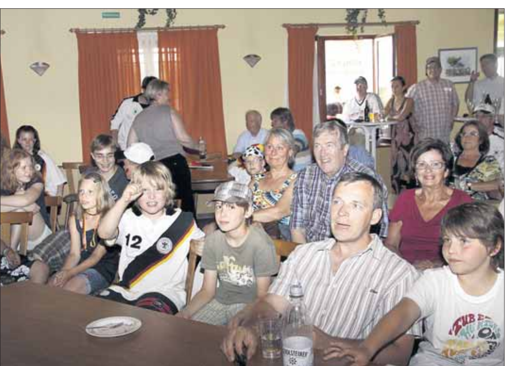
Spannung und Begeisterung gab es bei der MW-Übertragung Deutschland gegen England beim Sommerfest des EFS. Das große Sommer-Familien-Fest wurde mit guter Beteiligung auf dem Gelände der Kolping ausgerichtet.

Seligenstadt – Die Stadtbücherei bleibt während der Sommerferien vom 5. Juli bis zum 13. August geschlossen. Letzter Ausleihtag ist Freitag, 2. Juli. Interessenten haben bis dahin Gelegenheit sich aus dem erst kürzlich wieder erweiterten Sortiment mit Lesestoff einzudecken. Öffnungszeiten der Stadtbücherei am Klosterhof 5-6: Montags und freitags von 16 bis 18.30 Uhr; mittwochs von 9.30 bis 11.30 Uhr sowie von 17 bis 19.30 Uhr. Infos unter ☎ 06182 200074.