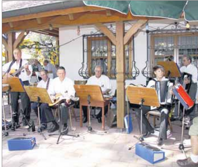
Die Edelweiß-Musikanten spielten bekannte Volkslieder auf.

Angeboten, das der Wanderclub Edelweiß innerhalb der Dachorganisation Spessartbund anbietet. 49 Jahre ist es her, dass der Seligenstädter Wanderclub Edelweiß das letzte sogenannte „Bundesfest“ des Spessartbundes ausgerichtet hatte, am vergangenen Wochenende war es wieder so