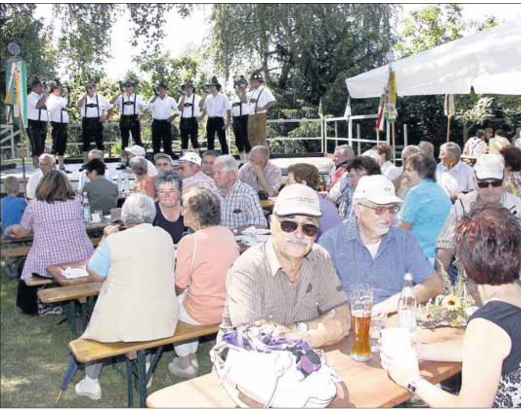
Die Begrüßung der Wanderer und Gäste erfolgte durch die Seligenstädter Jagdhornbläser.