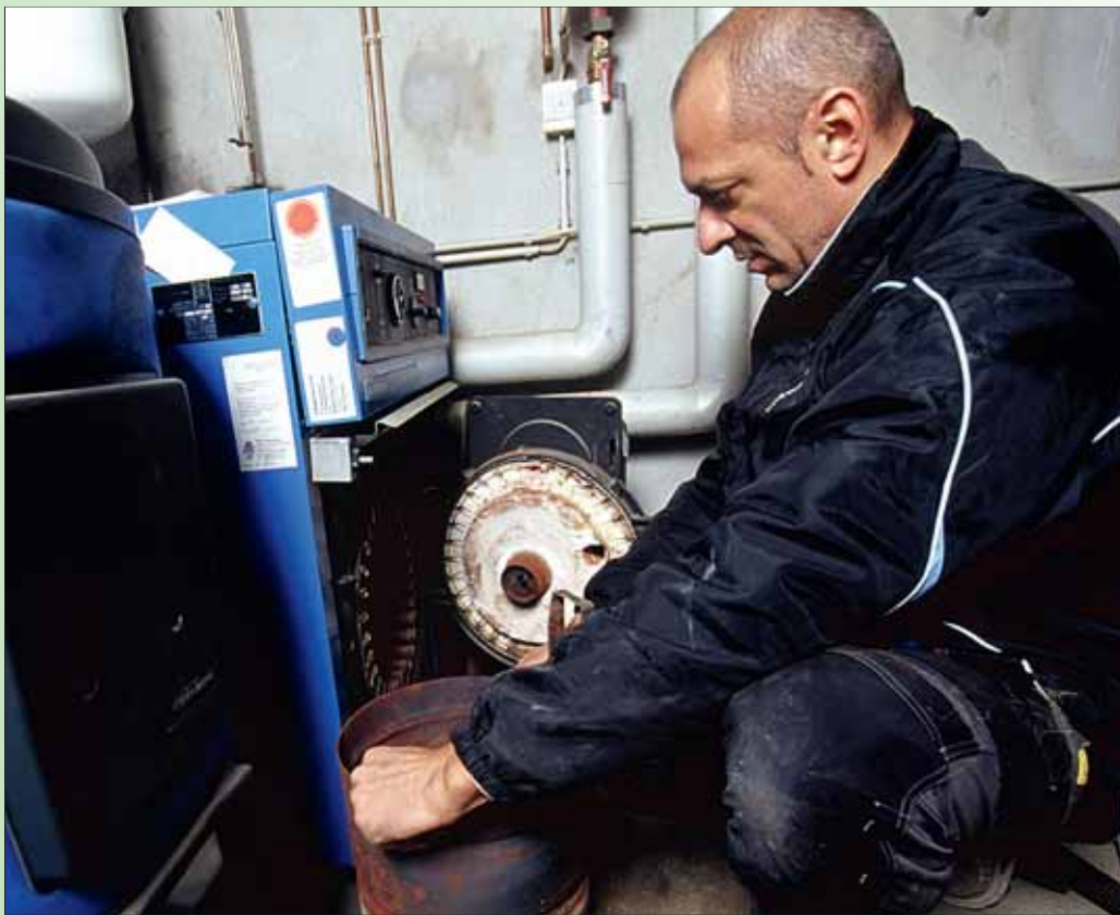
Der hydraulische Abgleich der Heizungsanlage wird am besten von einem Experten durchgeführt.

Ips/He. Wenn es draußen unangenehm kalt ist, arbeitet die Heizung auf Hochtouren, damit man es im ganzen Haus warm und gemütlich hat. Dabei wird allerdings nicht selten deutlich mehr Energie verbraucht, als eigentlich notwendig. Der Grund: Die Abstimmung der einzelnen Komponenten einer Heizungsanlage ist nicht richtig, pumpennahe Heizungskörper werden besser durchströmt als pumpenferne. Damit es dann – trotz aufgedrehter Heizung – im „pumpenfernen Obergeschoss“ nicht ungemütlich kühl bleibt, muss die gesamte Heizung deutlich mehr Wärme zur Verfügung stellen, als eigentlich nötig wäre. Und das geht dann ins Geld.